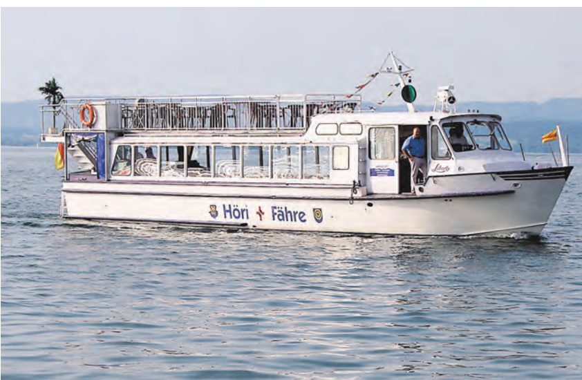
Die Saisonöffnung steht auch für die Höri-Fähre an. Am 2. April gib es zwei Saisonöffnungsfahrten um 11 und 17 Uhr zwischen Horn und Steckborn. Infos: Gästebüro Gaienhofen, 07735/81823.