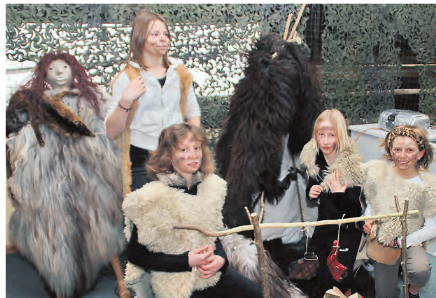
Kein Dino ist die Realschule Stockach: Mit modernen Mitteln wurden geschichtliche Epochen anschaulich aufgearbeitet.

Gesellschaft oder die Steinzeit aufgegriffen, bei technischen und textilen Arbeiten wurde zum Mitmachen eingeladen, Heimatgeschichte beleuchtete die Ausstellung »Geschichten aus der Geschichte«. Im Fach ITG wurden kunstvolle Montagen erstellt, die Bibliothekarinnen der Schulbücherei aus der achten Klasse lieferten Fakten über ihre Arbeit, und die Schülerzeitung, die Schulsanitäter und die SMV stellten ihre Tätigkeiten vor. Eltern informierten über den Förderverein, der im Frühjahr gegründet werden soll, und die Theater AG und die Klasse 7d führten Sketche in englischer Sprache auf. Für den musikalischen Rahmen sorgten die Bigband, die Gitarren AG, die Schulband, der Schulchor, die Tanz AG der Realschule und des »Nellenburg-Gymnasiums« sowie die Klasse 5b, die »einfach tierisch« Tierlieder und Raps vortrug. Die Realschule war also richtig gut.