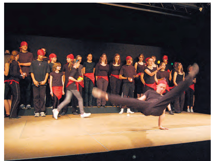
Eine Schule stellt sich vor und viele Besucher sahen sich die Vorstellung(en) an - beim Tag der offenen Tür am Nellenburg-Gymnasium in Stockach.