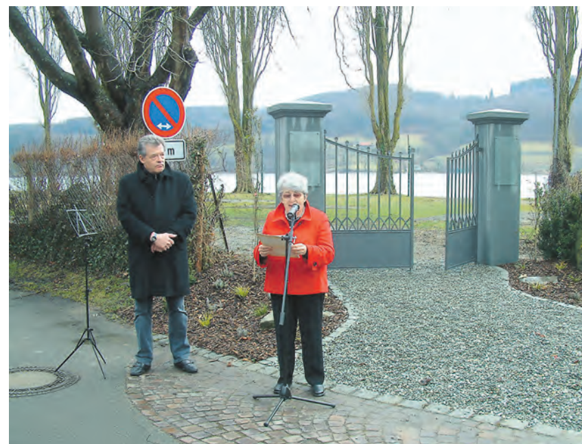
In einer ergreifenden Gedenkfeier weihte die Wangener Bevölkerung am vergangenen Sonntag die neue Gedenkstätte am Seeufer ein, mit der der Heimat-, Kultur- und Gästeverein an die im November 1938 zerstörte Synagoge erinnert.