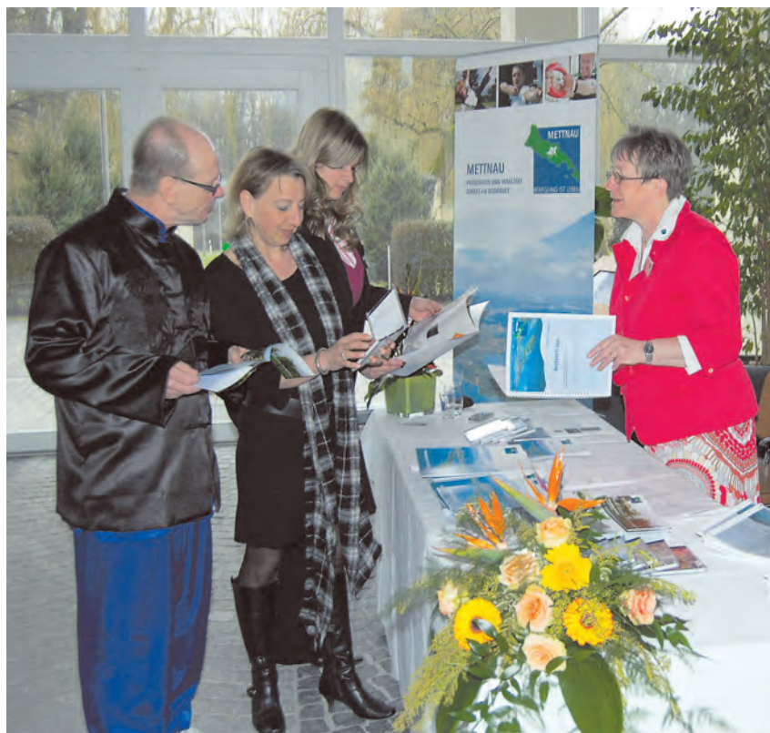
Als Ausrichter der Jahrestagung hat die Radolfzeller Mettnau-Kur kräftig auch für sich die Werbetrommel gerührt. Viele Referenten kamen und präsentierten damit auch den qualitativen Anspruch der Gesundheitseinrichtung vor Ort.