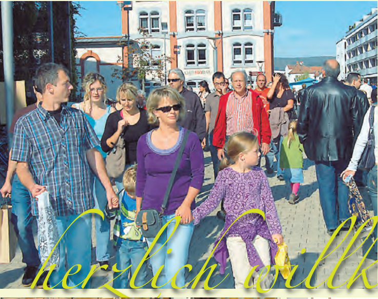
■ Radolfzell lädt zum Bummeln und Verweilen ein.

Auch folkloristische Auftritte sind geplant. Wie im vergangenen Jahr kommt die Alphornbläsergruppe Küng. Sie spielt an diesem Nachmittag an verschiedenen Orten in der Altstadt.