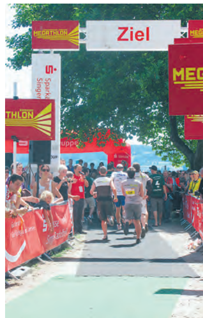
Im nächsten Jahr auf ein Neues: Der Megathlon im Radolfzeller Herzen ist bereits terminiert.