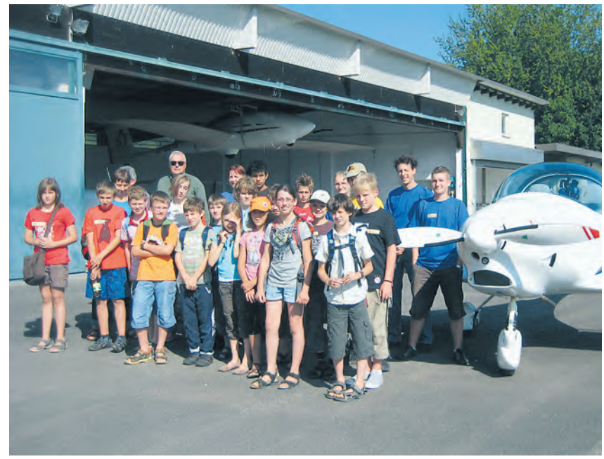
Wie schön fliegen ist, wissen jetzt die Kinder vom Lollipop-Kinderferienprogramm.