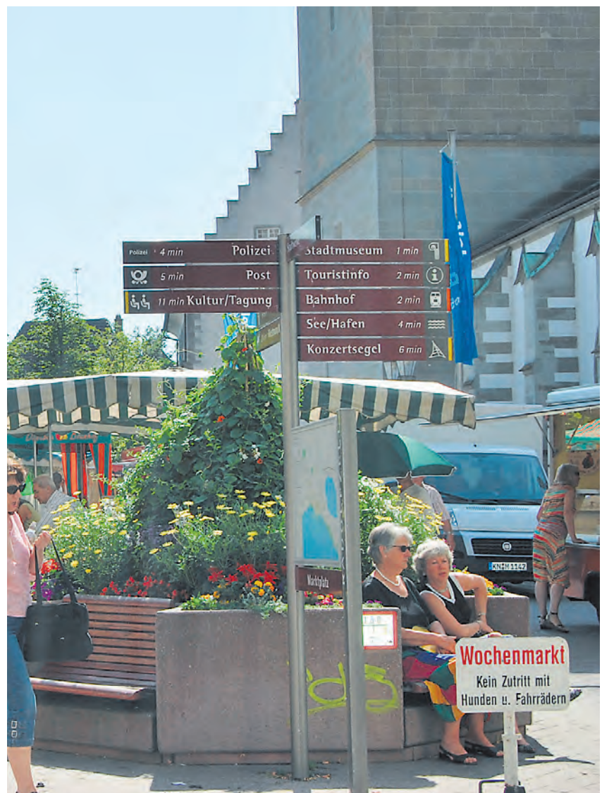
In Radolfzell geht es jetzt um die Wegweisung für die Zukunft. da müssen kräftigere Pflöcke in die Erde gerammt werden als hier bei den Markierungen am Münster.

Sauna, das Familienbad und es gehöre die Erreichbarkeit des Sees grundsätzlich dazu. Da geht es dann um die Unterführung und die Aufwertung des Ufers und der Altstadt. »Da bin ich sehr froh, dass wir viele Partner im Boot haben, der Einzelhandel zieht mit, die Hotellerie und Gastronomie. Und ich habe das subjektive Gefühl, dass die Stadt in diesem Jahr voller ist.« »Das müssen wir machen, denn es wird keine Chance mehr geben, einen großen produzierenden Betrieb nach Radolfzell zu holen,« sagt Dr. Schmidt. Und weiter: »Ich will hier keinen Massentourismus wie am Obersee, aber wir können hier einen nachhaltigen und sanften Tourismus an dem eher lieblichen Untersee machen.« »Unsere Mittel sind letztlich beschränkt,« sagt Dr. Schmidt zur Priorisierung in Radolfzell. Da müsse man sich im Gemeinderat auf ein Programm für die nächsten Jahre verständigen. Da komme nach dem Seezugang weiter die Stadtbibliothek. »Da werden alle Kosten auf den Tisch gelegt – und dann wird entschieden ob es geht oder nicht geht,« sagt der OB unter Hinweis auf die Milchwerk-Erweiterung.