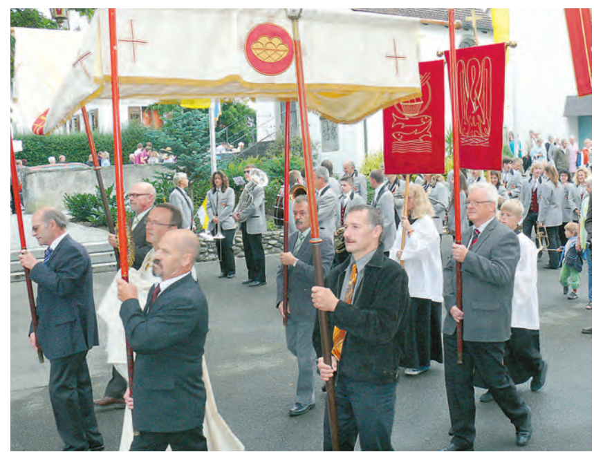
Prozession in Öhningen zum Patrozinium.

Der Dank der Pro Seniore geht an die Stadtwerke und die Sparkasse, durch deren Sponsoring dieser Wunsch erfüllt wurde.