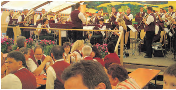
Beim Sommerfest in Mahlsprüen im Hegau wird feste gefest.