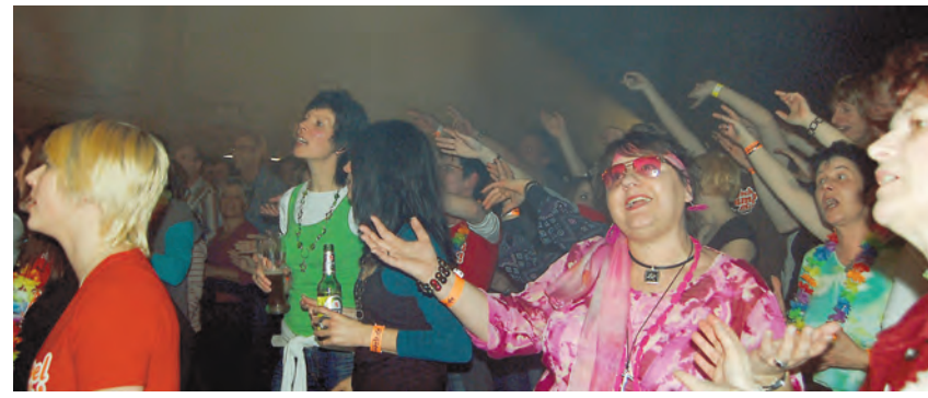
Bei der Funkenparty in der Turn- und Festhalle Zoznegg flogen die Funken - denn »Papi's Pumpels« heizten dem Publikum ein.