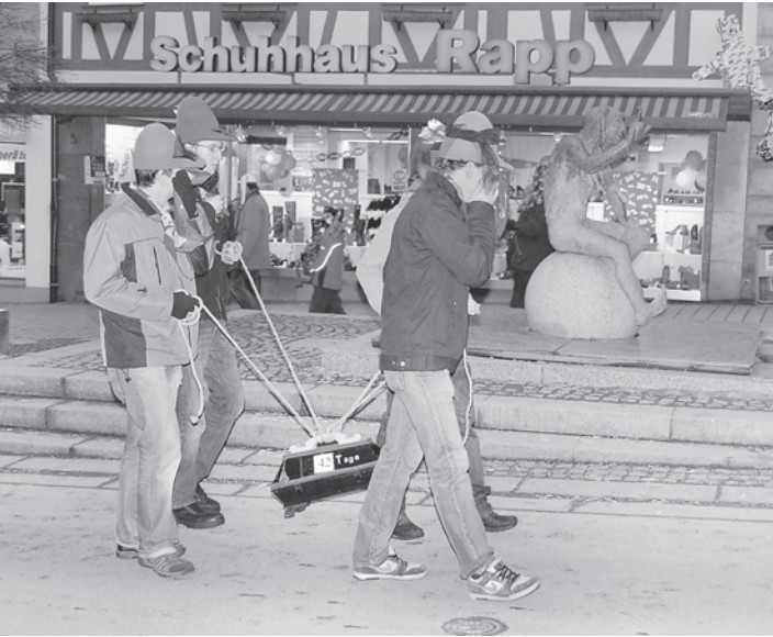
Zu Grabe getragen und ausgiebig beweint: Die Stockacher Fasnet 2010 ist Geschichte.