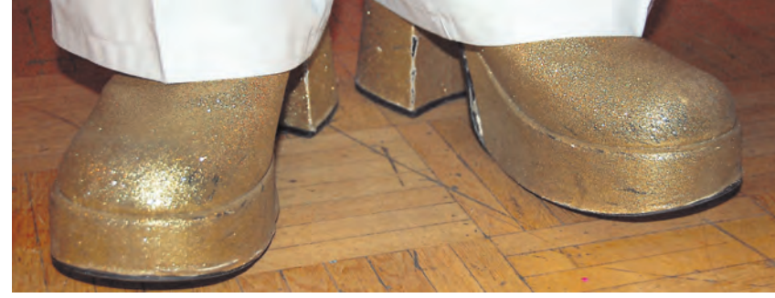
Goldies, but Oldies: Die Schuhe von Rainer Vollmer schimmern goldig, doch an manchen Stellen sind deutliche Gebrauchsspuren zu erkennen.