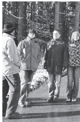
Der TV Jahn veranstaltet am 28. März einen Wandertag.