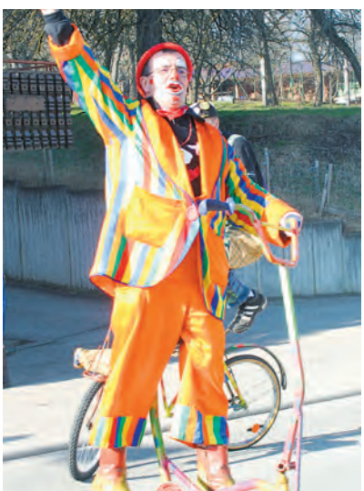
Drei Jahrzehnte feiert der Büßlinger Narrenverein Clown&Römer am Wochenende mit Römerball, Umzug und Kärreler-Rennen.

Großen, werden die »Clowns und Römer« am Wochenende erneut beweisen. Los geht's am Samstag, 5. März mit dem Jubiläums-Römerball ab 20 Uhr im Römertempel.