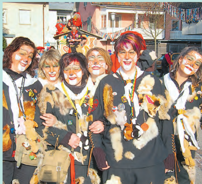
Sie hoffen auf einen ähnlich schönen Umzug wie im letzten Jahr: die Hexen und Katzengruppe aus Überlingen am Ried.