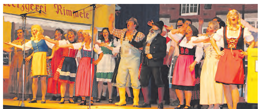
Der Pfadi Chor bei seinem Auftritt im »Pfadi-Stadl« in der Ortsmitte.