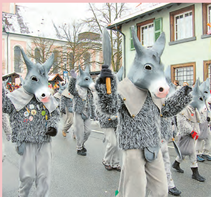
Die Eselgruppe hat ihren festen Platz im Narrenverein Pfiffikus.