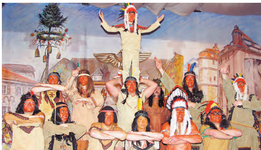
Akrobatisch zeigte sich das Männerballet der Narrenbolizei bei ihrer Version von »The spirit of the hawk«.

Gottmadingen (swb). Am Sonntag, 6. März, findet in der Lutherkirche Gottmadingen um 10.30 Uhr ein Gottesdienst in besonderer Form zum Thema Gesundheit statt. Interessierte erhalten dabei vor allem einen Einblick, was Krankenkassen aber auch die Bibel zum Thema Gesundheit zu sagen haben.