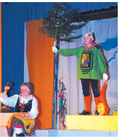
Am Dorfbrunnen in Bohlingen prangte der finstere Weihnachtsbaum.

Der »Sternen« wird nach Meinung der Bohlinger Narren bald ein Pflegeheim, das Thema Dioxin durfte in der Nummer »Landkauf« nicht fehlen. Einen gewagten Männertanz bekamen die Besucher des Narrenspiegels ebenso zu sehen wie einen lustigen Auftritt der Kinderturner.