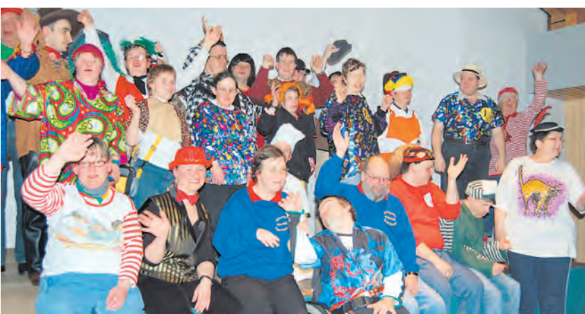
Viel Spaß hatten die Swimmys mit ihren Betreuern und Gästen auf ihrer Fastnachtsparty.