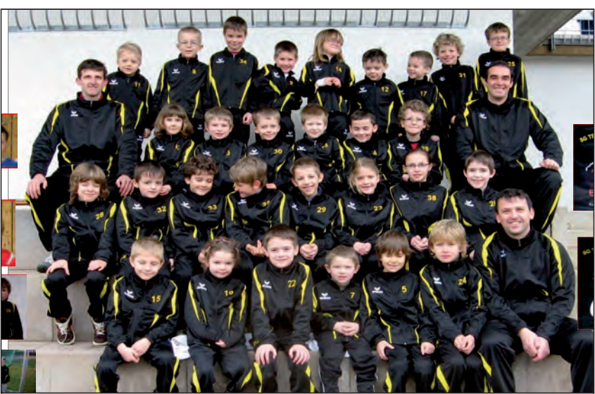
40 Bambinis und F-Junioren der SG Tengen-Watterdingen haben neue Trainingsanzüge bekommen – vier Sponsoren unterstützten die Nachwuchsspieler vom Randen, die nun auch nach außen wie ein einheitliches Team auftreten. Am 21. Mai können die Nachwuchsfußballer im Espelstadion Tengen beim Bambini- und F-Juniorenspieltag angefeuert werden.