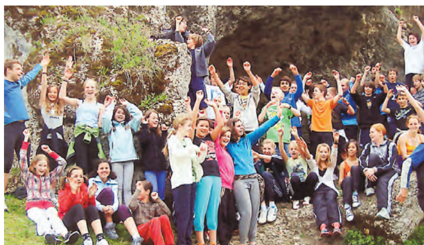
Sie machen sich fit für den Hegau Berge-Abenteuer am 8. Mai, die Laufgruppe des Engener Gymnasiums.

Die nächste Mahnwache ist am Montag, 2. Mai.