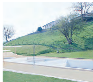
Eine Aufwertung plant die Stadtgemeinde Diessenhofen im Badebereich »Rodenbrunnen«.

Neu wird sich die Beckenlandschaft mit drei Badebereichen präsentieren. Die aktuellen Becken werden zu einem Lernschwimbereich und zu einem Plantschbereich umgebaut. Beide Bereiche sind fünf Meter breit und