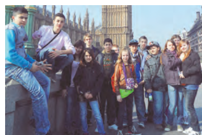
Schüler der Hebel-Werkrealschule aus Singen erkunden London.

Singen (swb). Sprachreisen für Schüler dienen in erster Linie der praktischen Spracherprobung im Alltag, denn wo lernt man am Besten die englische Sprache, als in England selbst. Dies hat sich die Johann-Peter-Hebel-Werkrealschule in Singen auf ihre Fahnen geschrieben und bereiste so bereits zum zweiten Mal die britische Hauptstadt London. 14 Schülerinnen und Schüler der Jahrgangsstufen 6 bis 9 hoben zusammen mit ihren Englischlehrern Chris-