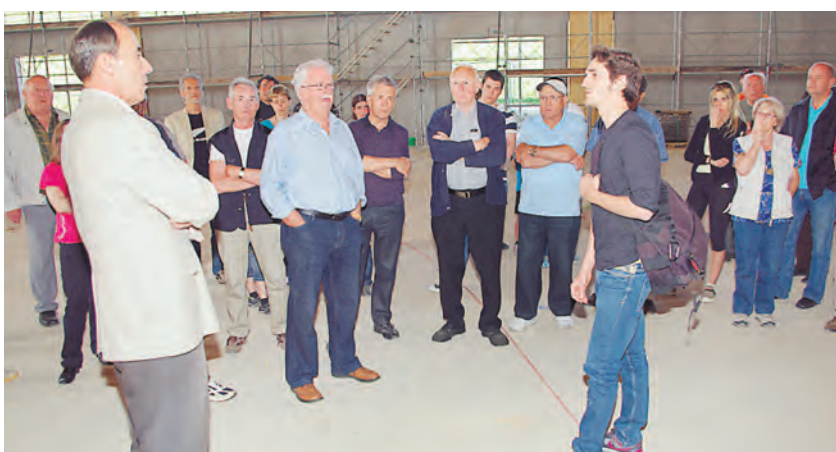
Viele Interessierte fanden sich zu einer Baustellenführung an der neuen Sporthalle Letten in Diessenhofen ein. Die Rohbauarbeiten sind nach acht Monaten Bauzeit abgeschlossen.