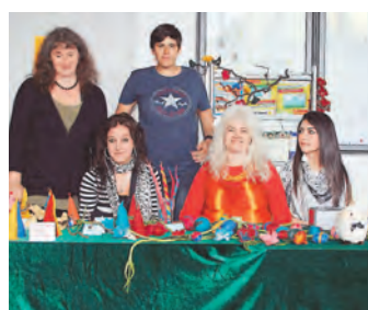
Die Ergebnisse eines Filzprojektes wurden zugunsten Japans verkauft.

Diese wurden dann in der Schule verkauft. Der Reinerlös