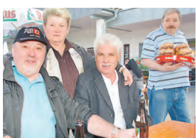
Auch Gäste aus Würzburg fühlten sich beim zweiten Frühlingsfest im Rheinauer in Gailingen sehr wohl.

Gailingen (of). Gute Stimmung herrschte beim zweiten Frühlingsfest im Rheinauer in Gailingen, zu dem das Café »Beans and more«, das Getränkefachgeschäft »Spritzkorken« und die Metzgerei Frick eingeladen hatten. Über den Mittag unterhielten die »Rauhenberg Musikanten« aus Gailingen die Gäste bestens und auch als das Fest sich bereits dem Ende näherte, strömten immer noch Besucher auf das Festgelände. Sogar Besucher aus der Region Würzburg, die sich in Gailingen aufhielten, waren zum Mitfeiern gekommen und fühlten sich »sawohl«. Erstmals wurde für Kinder eine Hüpfburg angeboten. Das Frühlingsfest im Rheinauer wird