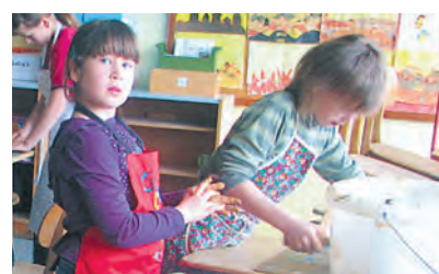
Neue Perspektiven des Lernens in der Grundschule Engen.

»Lebensräume - Lebensträume«, so lautete das Thema dieser Tage, an denen die 297 Kinder aus 13 Klassen teilnahmen. Dabei wurden die Kinder nicht wie üblich im Klassenverband unterrichtet, sondern fanden sich in 18 themenbezogenen klassenübergreifenden (Klasse 1 bis 4) Gruppen zusammen. Mit Themen wie: Der Traum vom Fliegen, Traumwelt Unterwasser, Japan, im Land der Gnome und Trolle, mit Bienen und den vier Elementen beschäftigten sich die Kinder, es wurden eigene Spielplätze geplant, das Traumzimmer gebastelt, neue Mode aus Müll und eine Kinderstadt aus Ton hergestellt. Aber auch der Lebensraum Schule kam in diesen Projekttagen nicht zu kurz. So nahmen sich zwei Projektgruppen des eigenen Schulhofs an, strichen das Spielhäuschen neu und legten Schleichwege durch die Büsche an.