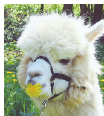
Ein noch kuscheliges Alpaka freut sich am Samstag, 30. April, auf Besucher.

Eigeltingen (sw). Sie sind kuschelig. Sie sind flauschig. Sie sind urig. Noch. Denn im Mai werden die Alpakas geschoren und wirken dann fast nackt. Doch beim Tag der offenen Tür am Samstag, 30. April, auf dem Alpaka-Hof in Eigeltingen-Guggenhausen zwischen Eigeltingen und Heudorf sind die