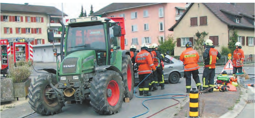
Hart gefordert waren die Thaynger Wehrleute bei einem eingekleiteten Auto im Rahmen ihrer Hauptübung.