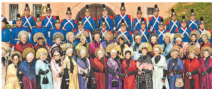
In der Zeit vom 23. September bis zum 8. Oktober besteht die Möglichkeit, die Ausstellung der Trachtenfrauen und der Bürgerwehr anlässlich derer beiden Jubiläen in der Sparkasse Engen zu besuchen.

Die Stadt Engen habe bei der Suche nach einem Grundstück geholfen und sei mit dem Preis entgegengekommen, die Mitarbeiter hätten sich mit vielen Ideen eingebracht, seitens der Banken und der Kirchen habe man ebenfalls viel Unterstützung erfahren.