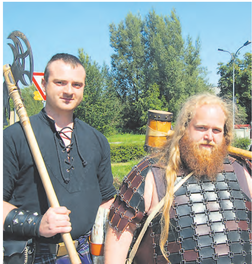
Das passende Gewand muss schon sein, wenn Landsknechte, Gaukler und Marketenderinnen sich zum Stelldichein treffen. Auch in Engen soll nächstes Frühjahr ein Mittelaltermarkt die Besucher anlocken.