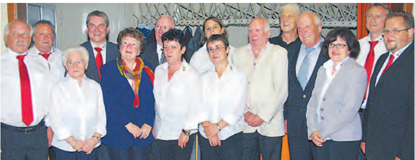
Viele Mitstreiter galt es zu ehren beim 50. Geburtstag des DRK Rielasigen am Freitag in der Roseneggchalle.