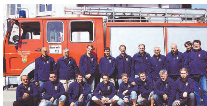
Die Binninger Feuerwehrmänner freuen sich über den jüngsten Zuwachs - dem Feuerwehrfahrzeug LF 16.