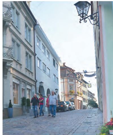
Mehr Leben in der Engener Altstadt: Am Sonntag, 9. Oktober öffnen Engens Geschäfte im Rahmen des Herbstfestes.

Damit hat es nur noch einen verkaufsoffenen Sonntag in Engen gegeben, weswegen sich die Einzel-