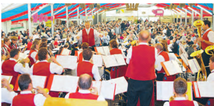
Gewaltig Stimmung machte der Musikverein Niedereschach am Sonntag mit mancher Polka und vielen Solisten beim Ehinger Herbstfest.

In stark alkoholgetränkter Luft kam es am Freitagabend, gegen 23.10 Uhr, vor dem Eingang ins Festzelt zu einer Auseinandersetzung, an der undefinierbar viele Jugendliche beteiligt waren und ein mit nahezu zwei Promille alkoholisiertes 20-Jähriger eine Schnittverletzung am Hals davon-