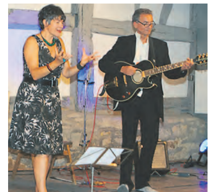
Die »Faltsch Wagoni« begeisterten die Steißlinger mit ihrem Temperament und Sprachwitz.