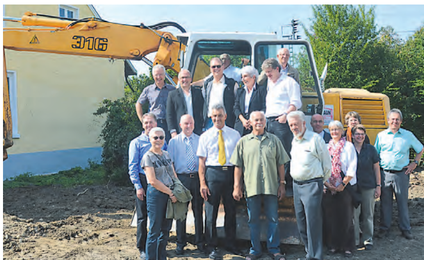
Dafür haben alle an einem Strang gezogen: Mitarbeiter, Banken, die Stadt. Die Caritas Singen und die Sozialstation Engen bauen ein Sozialzentrum. Im Herbst 2012 soll es fertig sein.

Engen (swb). Am Montag, 17. Oktober, findet um 19 Uhr im Feuerwehrhaus in Engen eine Bürgerversammlung statt. Es ist guter Brauch, dass die Bürger ihre Fragen und Wünsche vorher der Verwaltung mitteilen können. Gewünschte Themen können entweder über das Bürgertelefon unter 07733/502260, über das Internet unter rathaus@engen.de oder direkt an das Hauptamt unter 07733/502205, mitgeteilt werden. Hauptthemen des Abends werden die Energiepolitik und Information über den aktuellen Stand in Sachen Kreislösung Krankenhaus sein.