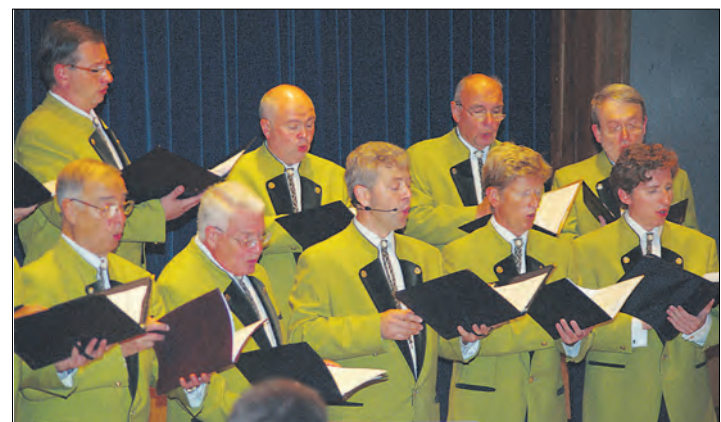
Ein besonderes Geschenk machte sich der Sängerbund Gottmadingen zu seinem 150. Geburtstag. Am Samstag kam der Montanara-Chor aus Stuttgart in die Eichendorffhalle, um dort die schönsten Stücke für Männerchöre aufzuführen. Über 450 Besucher aus der ganzen Region wollten sich Werke wie den »König von Thule« oder »Es löscht das Meer die Sonne aus« nicht entgehen lassen und wurden nicht enttäuscht. Denn der Montanara-Chor ist derzeit der einzige professionelle Männerchor in Deutschland!

Damit schiebt er etwaigen Ansiedlungswünschen von großen Speditionen oder Einzelhändlern klar einen Riegel vor.