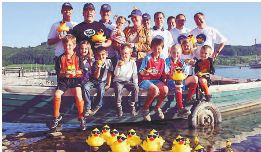
Ein Rennen mit Gummienten veranstaltet der FC Öhningen-Gaienhofen in der Wangener Bucht im Rahmen seines Seefests am 23. Juli. Der Erlös kommt den Höri-Kindergärten und der FC-Jugendabteilung zugute.

Weitere Infos finden sich im Internet unter www.fc-oehningen-gaienhofen.de .