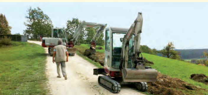
Die Bauarbeiten in Möggingen haben bereits begonnen.

Ein ganz wesentliches Thema für die Bürger in den vier Ortsteilen ist es, zukünftig auch schnelles Internet zu bekommen. Derzeit läuft dort Internet nur mit niedriger Datengeschwindigkeit, dies soll sich mit Hilfe der Stadtwerke im Jahr 2012 ändern.