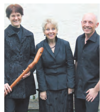
Das Trio »Entzücklika« tritt am 23. Oktober in der Pfarrkirche St. Nikolaus in Aach auf.