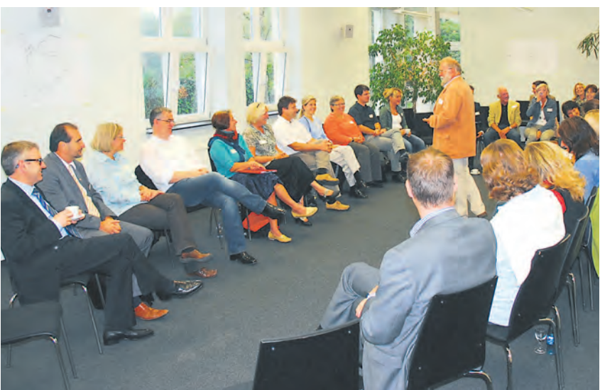
Dass es Sinn macht, Vertreter aus ganz unterschiedlichen gesellschaftlichen Bereichen miteinander ins Gespräch zu bringen, zeigte auch die diesjährige erfolgreiche Open-Space-Konferenz zum Thema Nachhaltigkeit im RIZ in Radolfzell.