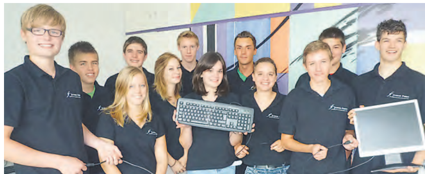
Sie sind bestens »vernetzt«: Die BSZ-Schüler der »Junior-Firma« freuen sich bereits auf Ihre Funktion als Dozenten im Rahmen der DV-Kurse am BSZ Stockach.

Im Rahmen der »Junior-Firma«, die am BSZ als eingetragener Verein verankert ist und als »Übungsfirma« praxisorientiertes Lernen ermöglicht, bieten die zwischen 16- und 17-jährigen »Jungunternehmer« Interessierten eine kostenfreie Möglichkeit, sich etwas mehr Durchblick im Dschungel