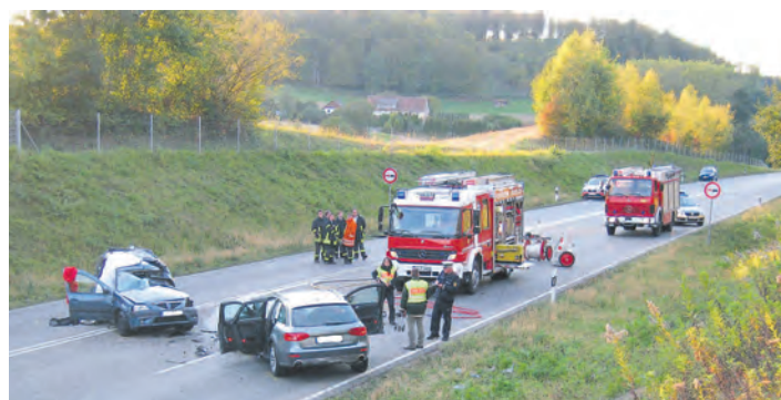
Zwei Todesopfer forderte ein schwerer Unfall bei Stockach.