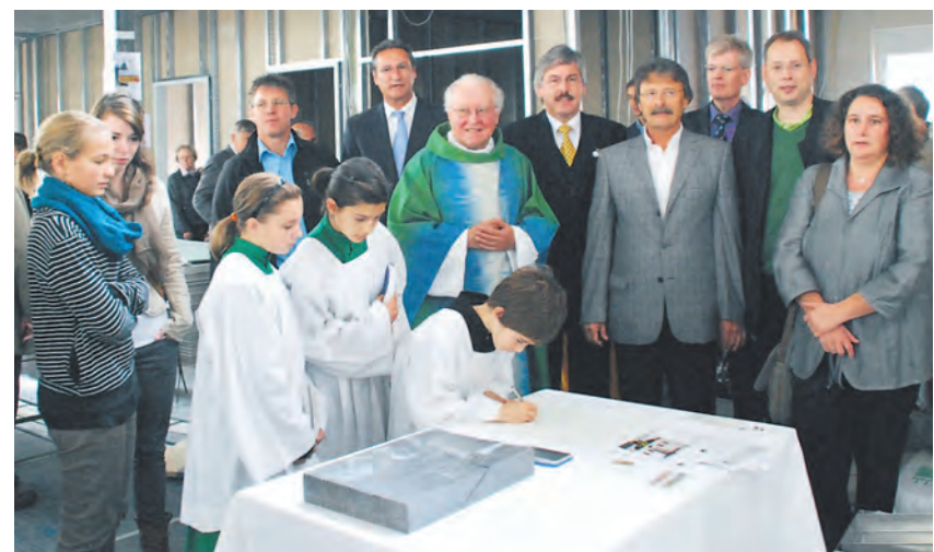
Einen Überblick über die Gestaltung des neuen Gemeindehauses konnten sich Interessierte nach dem Erntedankgottesdienst verschaffen.