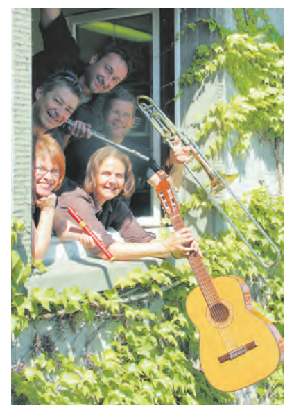
Ein Benefizkonzert geben die Radolfzeller Musikschullehrer am 16. Oktober.

Der Eintritt ist frei, um Spenden zugunsten des Freundes- und Förderkreises wird gebeten.