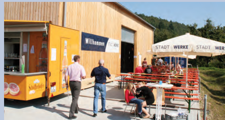
Der MV Güttingen sorgte für gute Unterhaltung.