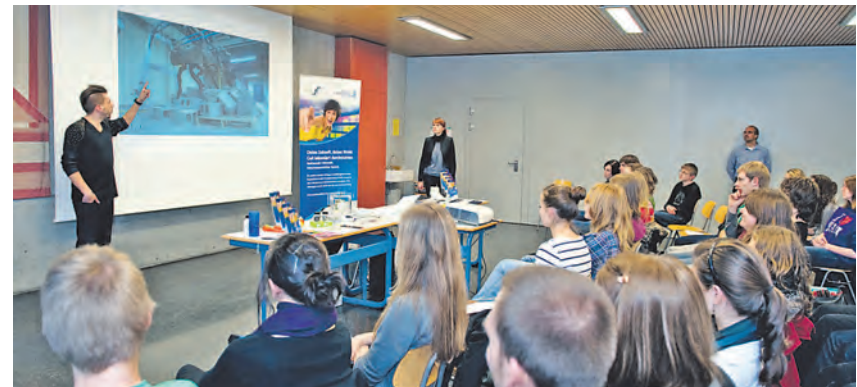
Bei »Coaching4Future« werfen Schüler einen Blick in die Zukunft verschiedener Branchen.

Wöchentlich etwa zwei Stunden arbeiten die »Junior-Firmen-Mitglieder« in ihren Abteilungen. Darüber hinaus komplettieren Messepräsentationen den Erfahrungsschatz dieses praxisorientierten Fachunterrichts. Mit einer Urkunde und einem entsprechenden Leistungsnachweis im Zeugnis werden die BSZ-Schüler für ihre »Business-Tätigkeit« belohnt. Die Teilnahme an den Kursen ist kostenfrei! Anmeldungen nimmt das BSZ bis zum 17.10. unter Telefon 07771/87040 entgegen.