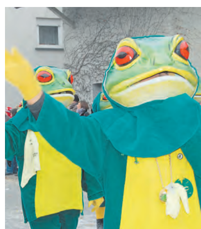
Die Froschzunft Hopetenzell wird 50 Jahre alt.

kerzunft aus Boll, die Burgwichtel aus Schwandorf, die Schwandorfer Burghexen, der Narrenverein Nellenburg aus Hindelwangen, die Kuhsattler aus Hohenfels, die Frauenholzer aus Gallmannsweil, Mahlspüren im Hegau, die Schilpenzunft Buchheim, die Waldgeisterzunft aus Kreenheinstetten, die Buchenbergerzunft aus Emmingen, die Hoamasa aus Vilsingen und die Thalia aus Mahlspüren im Tal.