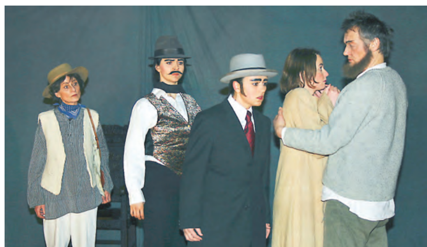
Eine gelungene Premiere von Dürrenmatts »Ein Engel kommt nach Babylon« präsentierte das Amateurtheater des Vereins »Zeller Kultur«

Weitere Aufführungen finden am 18., 19. und 20. Februar, jeweils um 20 Uhr, im Scheffelhof statt.