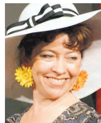
Die »Magdeburger Zwickmühle« zwickt wieder am 12. März in Stockach.

Stockach (swb). Die Dienstagswanderer des Schwarzwaldvereins Stockach treffen sich am Dienstag, 1. März, um 14.30 Uhr beim Vereinsheim am La Roche-Platz.