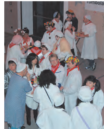
Bunte Stimmung, weiße Kleidung – beim Hemedglonkerball.

Geschmackserlebnis zu bieten oder es befindet sich ein Gewinnlos im leckeren Innern, das dann eingelöst werden kann. Doch auch der 151. Besucher und seine Nachfolger sind Gewinner, denn die Marketenderinnen versprechen, dass die Stimmung stimmt. Die Verantwortung dafür, dass der Unterhaltungswert ständig auf »Hoch« steht, haben musikalische Diamanten: »Rubin – die badische Boygroup vom Bodensee« legt los. Geballte Männerpower, fünf Mann stark, mit starken Hits im Gepäck. »Hemedglonker« dürfen alle, die mindestens 16 Jahre alt sind.