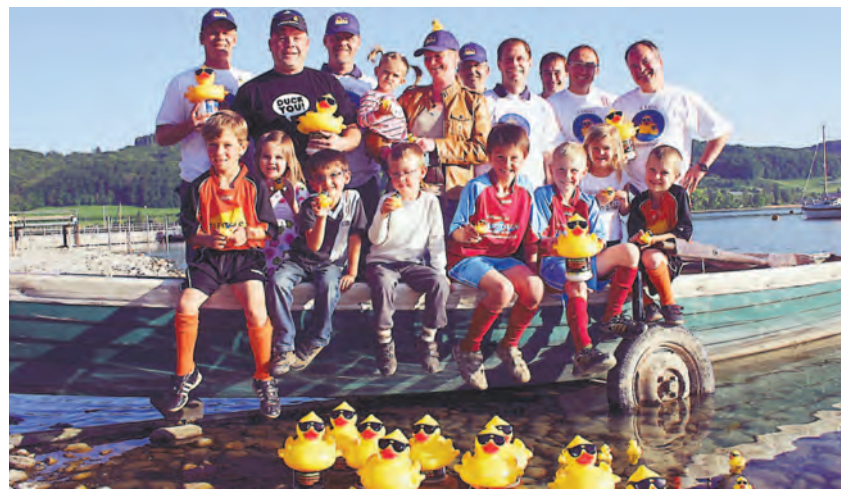
Ein Rennen mit Gummienten veranstaltet der FC Öhningen-Gaienhofen in der Wangener Bucht im Rahmen seines Seefests am 23. Juli. Der Erlös kommt den Höri-Kindergärten und der FC-Jugendabteilung zugute.

Weitere Infos finden sich im Internet unter www.fc-oehningen-gaienhofen.de .