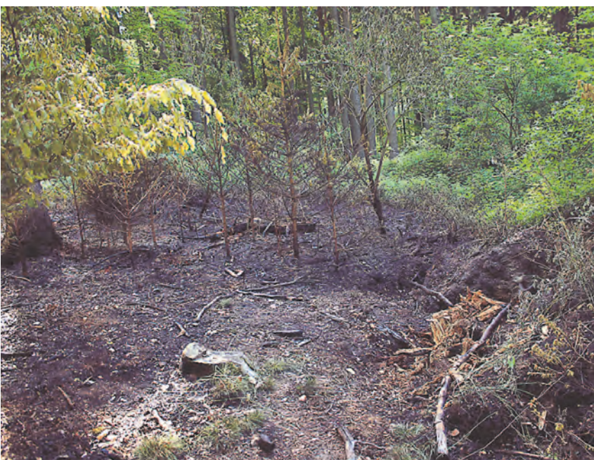
Die Feuerwehr warnt vor erhöhter Waldbrandgefahr. Sie musste am Sonntag zwei Mal ausrücken.