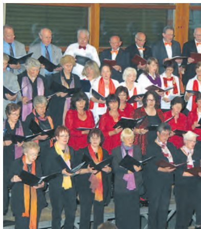
Viele Sängerinnen und Sänger werden am kommenden Sonntag nach Stockach ins Bürgerzentrum Adler-Post kommen, um in einem Chortreffen gemeinsam zu singen. Der Eintracht-Chor in Stockach feiert in diesem Jahr sein 175-jähriges Jubiläum