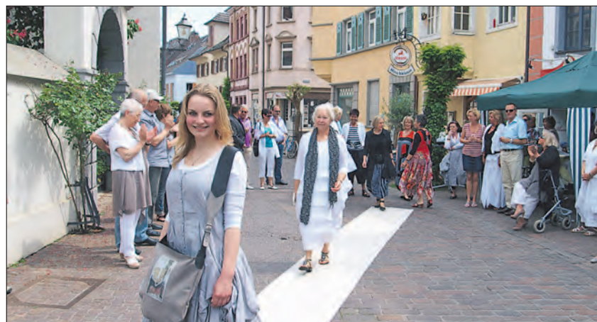
20-jähriges Bestehen feierte Mode Sonja in Radolfzell. Aus diesem Anlass gab es eine Modenschau im Freien, bei der Kundinnen unter dem Applaus der Gäste Kleidungsstücke vorführten.