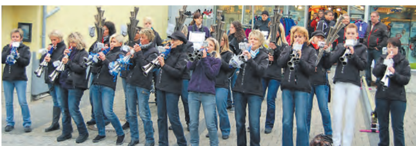
Der Sound stimmte: Die »Schalmeien Weibsen Stockach« (SchaWeSto) brachten die Stockacher Unterstadt während des verkaufsoffenen Sonntags zum Schwingen und Swingen. Diese Melodien machten alle Müden munter.