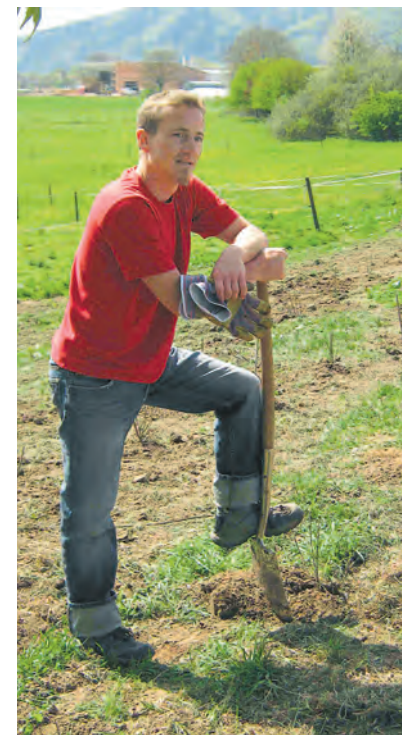
Ein grünes Band aus wertvollem Lebensraum soll sich durch Wahlwiesenschlängeln.

Abteilung Anästhesie und Schmerztherapie: Zu jeder vollen Stunde gibt es praktische Demonstrationen zur Vollnarkose im OP-Einleitungsraum, und zu jeder halben Stunde werden regionale Betäubungsverfahren in der OP-Schleuse gezeigt. Abteilung innere Medizin: ein interessanter Gesundheitscheck mit Blutdruck, Puls, Gewicht, Bodymaßindex, Sauerstoffsättigung, Temperatur und Blutzucker, Präsentation des Pflegeablaufs beim Frühdienst und die Möglichkeiten zur Schleimlösung in Zimmer 15 und im Aufnahmezimmer; Darmspiegelung im Röntgendurchleuchtungsraum im Erdgeschoss; Spiegelung der Bronchien im Endoskopieraum im Erdgeschoss; Kardiopulmonale Reanimation im Zimmer 16 im Obergeschoss.