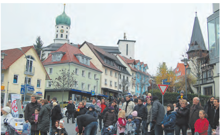
Der Himmel war trüb, die Laune heiter. Beim verkaufsoffenen Sonntag in Stockach konnten Besucher ein Shopping-Vergnügen unter dem Motto »Wir versüßen Ihren Einkauf ohne Hektik und Stress genießen.«