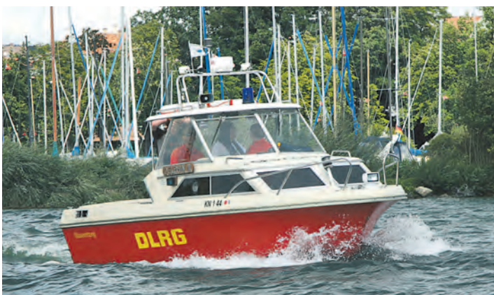
Die DLRG Radolfzell benötigt dringend ein neues, den Vorschriften entsprechendes Rettungsboot. Vor allem müssen Patienten in der Kabine befördert werden können.