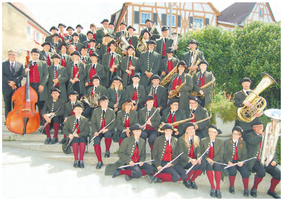
Taufrischer Jubilar: Die Stadtmusik Stockach feierte und feiert 2011 ihr 300-jähriges Jubiläum mit jugendlich-schwungvollen Auftritten.

Stockach (swb). Die nächste Gelegenheit zum Blutspenden ist am Donnerstag, 15. Dezember, von 14 bis 19.30 Uhr im Berufsschulzentrum in der Conradin-Kreutzer-Straße 1 in Stockach. Infos zum Blutspenden gibt es unter der Hotline 0800/ 1 19 49 11 und unter www.blutspende.de.