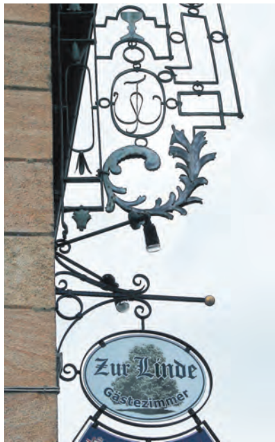
Die »Linde« in Büßlingen - eine Erfolgsgeschichte über eine lebendige, engagierte Dorfgemeinschaft.

Büßlingen (mu). Die Erfolgsgeschichte begann Ende des Jahres 2008, als sich drei Büßlinger Bürger in kleinem Kreis trafen, um über Visionen in ihrem Heimatdorf zu diskutieren. Kein reines Schlafdorf sollte es werden, der idyllische Flecken am Randen, sondern eine lebendige Gemeinde mit einer lebenswerten Zukunft. Ein Monat später gründeten zehn Männer und Frauen das Netzwerk Büßlingen, das die Ideen weiterentwickelte und die Bevölkerung in das Projekt mit einbezog. Nach einer Meinungsumfrage wurde dann im September 2010 der Bürgerverein Linde e.V. mit 69 Mitgliedern aus der Taufe gehoben, mit dem Ziel, in dem leerstehenden Traditions-Gasthaus »Linde« eine Begegnungsstätte für Jung und Alt einzurichten. Auch die Suche nach Fördergeldern war erfolgreich, so dass dem Kauf der »Linde« im Juni 2011 nichts mehr im Wege stand. Wenig später begannen die ausgiebigen Renovierungsarbeiten, größtenteils mit Eigenleistungen der rührigen Mitglieder. Die leisteten insgesamt 5.000 ehrenamtliche Arbeitsstunden - den Rest erledigten heimische Handwerker in bester Manier. An der Fastnacht dieses Jahres war