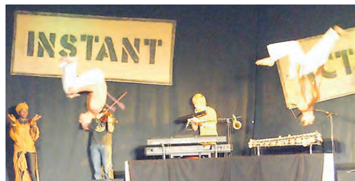
Zum 4. Mal kommt das Jugend-Kultur-Projekt »Instant Acts« am Donnerstag, 11. Oktober, ins Bildungszentrum nach Engen.