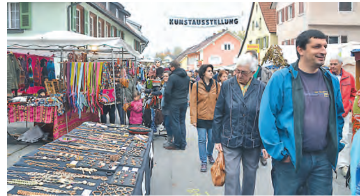
Großer Ansturm auf dem Kirchweihmarkt: 130 Stände gab es zu bestaunen.

Hallen noch etwas größer als in den Jahren zuvor. Auf dem Kirchweihmarkt hingegen konnten die Besucher an 130 Ständen nicht nur Käse aus Südtirol kaufen, vielmehr gab es vor allem Handwerkskunst, Schmuck, Krämerwaren und Textilien zu erstehen.