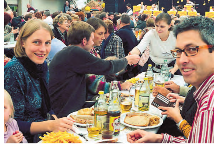
Bauern-Feinkost: Beim Wiechser Oktoberfest kam ausschließlich Selbstgeschlachtetes auf den Tisch.

Funden, die ihm der Kreisarchäologe in der Hombollstraße präsentierte. Besonders eindrucksvoll erwies sich ein Doppelgrab einer erwachsenen Person, die zusammen mit einem Kleinkind bestattet wurde. »Die Notbergung, die ohne Bauverzögerung innerhalb weniger Tage abgeschlossen werden konnte, hat uns sehr wertvolle Erkenntnisse zur frühen Ortsgeschichte von Hilzingen geliefert. Die Funde zeigen, dass hier schon während des 6. und 7. Jahrhunderts n. Chr. ein frühmittelalterlicher Friedhof bestand, der zu einer der Keimzellen des heutigen Hilzingen gehörte«, resümierte Hald nach Abschluss der Ausgrabung. Die Funde werden nun zur Restaurierung an die Denkmalpflege des Regierungspräsidiums Freiburg übergeben. Die Skelettfunde sollen von Spezialisten für Menschenknochen des Landesamtes für Denkmalpflege genauer analysiert werden.