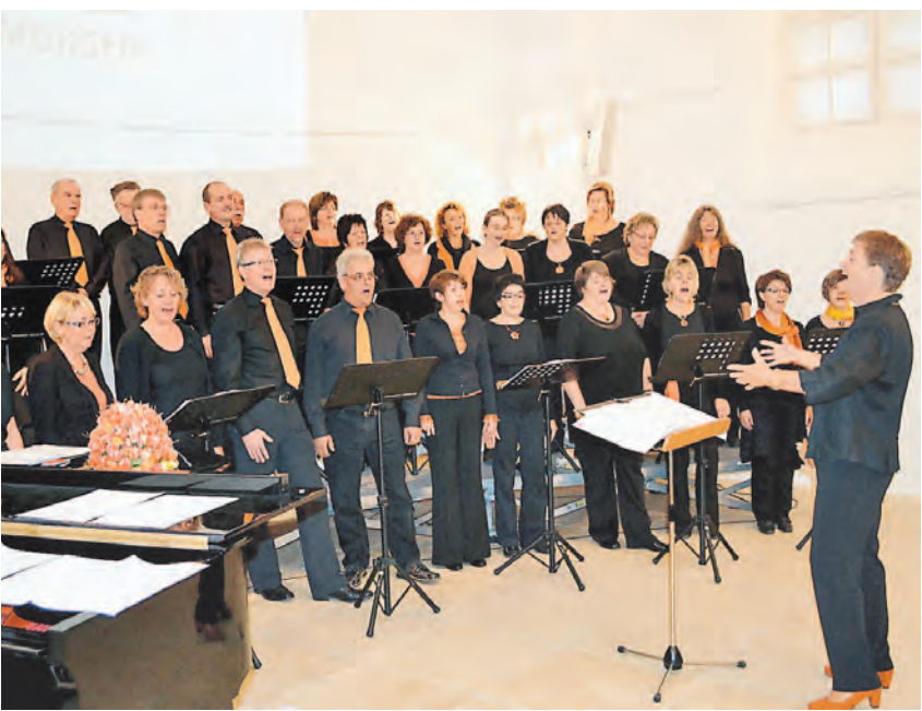
Mit zwei mitreißenden Konzerten feierte der gemischte Chor »Querbeet« am Wochenende seinen 10. Geburtstag.