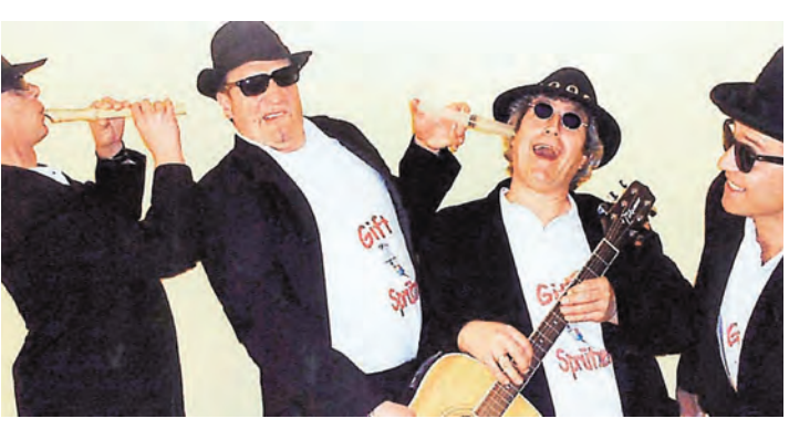
Die Bietinger Giftspritzer treten am 3. November in der Talwiesenhalle auf.