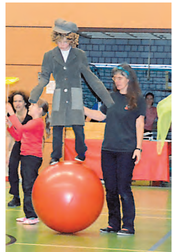
Kleine Künstler ganz groß: Der Circus Casanietto feiert Geburtstag.

der Fasnacht und beim Altstadtfest und Ostermarkt in Engen und am Weihnachtsmarkt wird eine Feuershow gezeigt. Außerdem wird im Rahmen des Kinderferienprogramms ein dreitägiger Mitmachzirkus in den Sommerferien angeboten. Der Circus Casanietto trainiert immer donnerstags von 16.30 bis 18 Uhr (Kinder) und 17.30 bis 19.30 Uhr (Jugendliche) im Bürgerhaus in Engen-Zimmerholz.