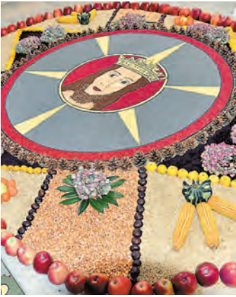
Jesus, gelegt aus Samen und Blüten.