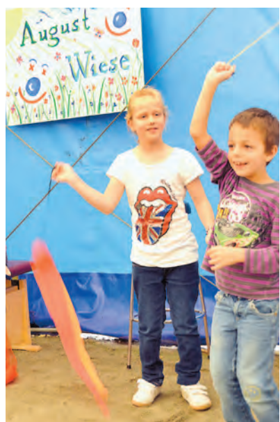
Die Augustwiese wurde während der Eröffnungsfeier mit Zirkusspiel ihrem Zweck übergeben.