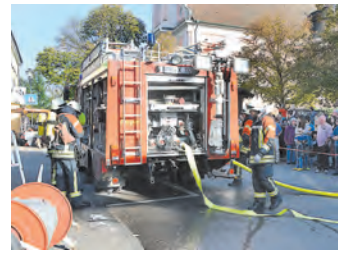
Die Besucher auf der Kirchweih staunten, während die Feuerwehrleute die Wasserschläuche ausrollten.

In der Hauptstraße 40 war ein Brand gemeldet worden. Da nah neben dem Wohnhaus ein weiteres Gebäude sowie eine Scheune gebaut sind, bestand die Gefahr, dass das Feuer übergreift. Zunächst erreichten