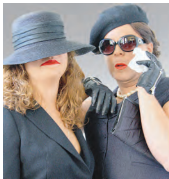
Spannendes Essen: Die Schauspieler legen sich für ihre Gäste beim Dinnerkrimi mit fulminanten Verkleidungen ins Zeug. swb-Bild: www.dinnerkrimi.ch .

Gut müde und zufrieden ging die Gruppe auseinander und war sich einig: »Das ruft nach Wiederholung!«. Bilder vom Familypilgern und alle Infos zu Aktionen im Dekanat gibts auf www.dekanat-hegau.de .