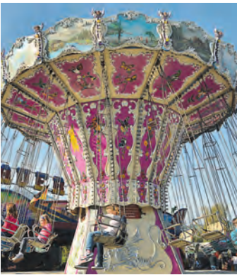
Im Karussell sausten die Besucher gen Himmel.