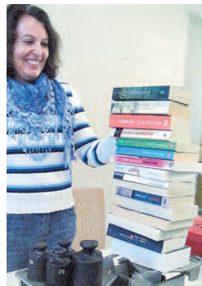
Mit viel Spaß bei der Arbeit: Bücher zu Pfunds-Preisen beim Büchermarkt in Engen.

Ski, Snowboards und schicke Winteroutfits – beim jährlichen, großen Brettlesmarkt des Skiclubs Engen am Samstag, 27. Oktober von 13.30 Uhr bis 14.30 Uhr im Foyer der Stadthalle Engen, Jahnstraße 32 finden Wintersportfans sicher das Richtige.