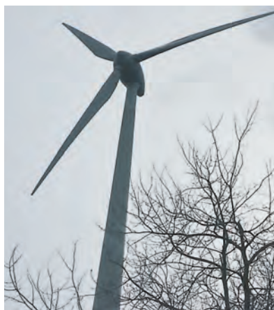
In Landschaftsschutzgebieten dürfen keine Windkraftanlagen erbaut werden.

Das Raumplanungsbüro HHP Hage + Hoppenstedt aus Rottenburg untersuchte für die Planungsgemeinschaft Engen, Aach, Mühlhausen-Ehingen, Tengen und Hilzingen auf deren Gemarkungen nach Konzentrationsflächen für Windkraftanlagen. Über die Fortschreibung der Flächennutzungspläne haben die Kommunen eine Lenkungsmöglichkeit bei der Ausweisung von geeigneten Standorten.