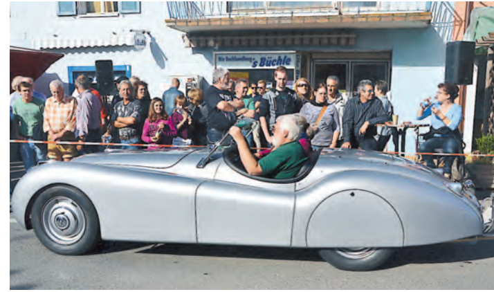
Blankgeputzt rollten die Oldies durch die Hilzinger Hauptstraße.