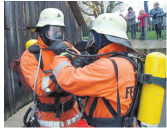
Mit Atemschutzmasken ausgestattet betreten die Brandkämpfer das Übungsobjekt.