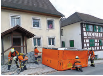
Eine Person musste mittels Sprungtuch befreit werden.