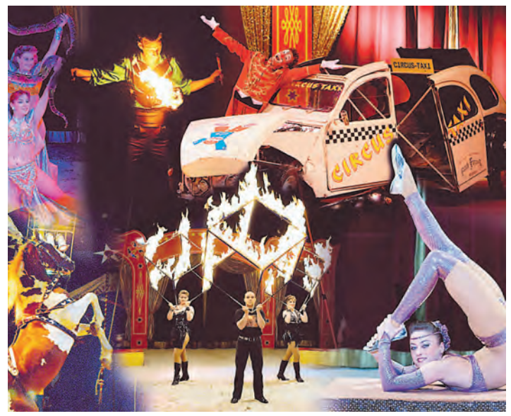
Ein Showprogramm mit internationalen Höhepunkten verspricht der Circus Montana, der ab 8. November in der Singener Südstadt Station macht.

Flair, phantastischen Tierdarbietungen, artistischen Spitzenleistungen in und über der Manege und einzigartiger Clownerie wartet auf die Besucher. So sorgen unter anderem auch Absolventen der staatlichen Artistenschule Berlin für niveauevolle Live-Unterhaltung für die ganze Familie. Ein besonderer Höhepunkt ist die fulminante »Black-Tiger-Fireshow«.