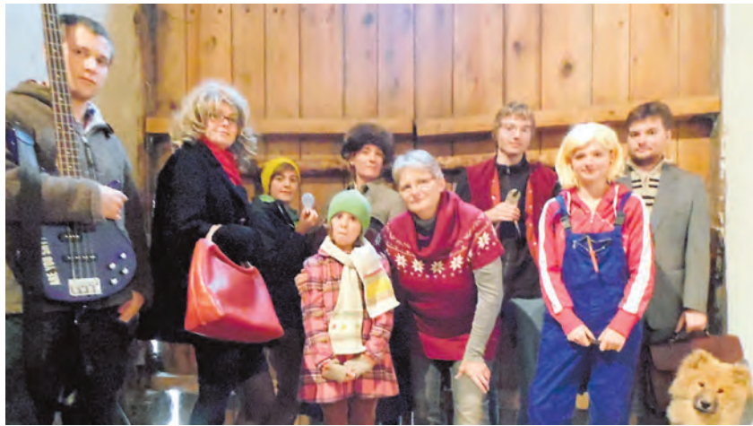
Schauspieler und Musiker bei den Proben: Studenten, Schüler, angehende Azubis sowie Abiturienten spielen in diesem Jahr beim Weihnachtsbilderbuch mit.