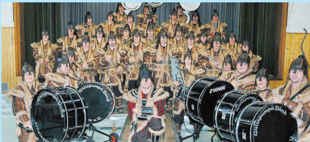
Ein letztes Mal werden die Mitglieder der »Gülläpumpä-Bänd« am Samstag in ihrem felligen Mongolen-Krieger-Häs auftreten. Denn bei der »Gülläparty deluxe« wird das neue Kostüm enthüllt.

Bars, sowie einen Raucherbereich. Die Veranstaltung beginnt um 20 Uhr. Die Halle ist ab 19 Uhr geöffnet. Karten gibt es im Vorverkauf für 7 Euro oder an der Abendkasse. Weitere Informationen unter: www.gpb-event.de .