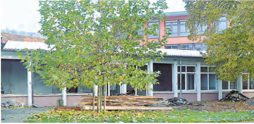
Der Abriss im St.-Martin-Kindergarten in Gottmadingen geht voran. Momentan wird das Gebäude entkernt.

Gottmadingen (lkr). Der Neubau des St. Martin-Kindergarten wird teurer als bei der Vertragsunterzeichnung angenommen. Insgesamt sind es etwas mehr als 20.000 Euro, die das neue Herzstück der modernen Kinderbetreuung in Gottmadingen mehr kosten soll. Diese Bilanz wurde im vergangenen Gemeinderat vorgestellt. Hinzu kommen weitere 40.000 Euro Kosten für das Provisorium im ehemaligen Gebäude der »BKK Fahr«, wo die Kinder in der Übergangszeit untergebracht sind. Doch diese Mehrkosten waren bereits im Mai absehbar, denn der Bodenbelag musste angepasst werden und zusätzlich sind mehr Kindergruppen zustande gekommen, als zuvor angenommen. Darüber hinaus gab es Kritik seitens der Gemeinderäte an der Dachgestaltung des Neubaus. Es ging um das Gründach, das aus Kostengründen in ein Kiesdach umgewandelt worden war. Kirsten Graf (SPD) fasste zusammen, dass jeder Bürger von der Ge-