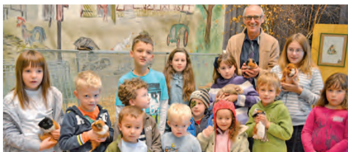
Die Stars der diesjährigen Lokalschau des Kleintierzüchtervereins in Gailingen waren »Meerschweinchen«.

Großer Besucherandrang bei Lokalschau der Kleintierzüchter