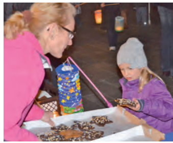
Nach dem Laternenumzug gab es für alle Kinder den Engener Stern.

Eine große Traube aus Eltern und Kindern versammelte sich gegen 17 Uhr auf dem Marktplatz, um mit Gesang einen Laternenumzug durch die Altstadt zu beginnen. Danach bevölkerten die Kleinen die Stadtbibliothek, in der sie beim Puppenspiel des Waldorfindergartens die Geschichte des Hirtenbü-