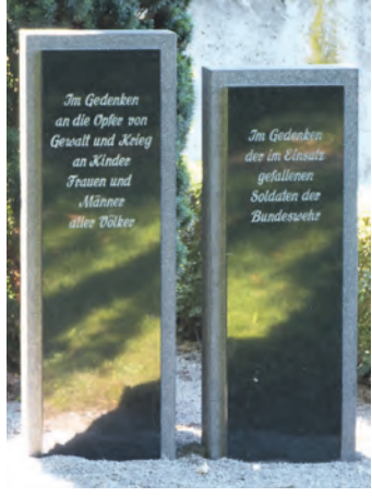
Mit den Stelen soll an die Opfer vergangener, aber auch derer Kriege, die noch wahren, gedacht werden.

Weiterdingen (swb). Mit dem Thema, ob die Volkstrauer ein Auslaufmodell ist, hat sich der Ortschaftsrat in Weiterdingen auseinandergesetzt. Nach einer eingehenden Diskussion wurde beschlossen, das Kriegerehren-