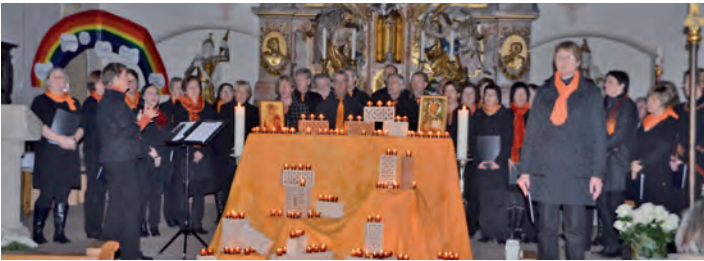
In der neu renovierten Stadtkirche ließ der Chor »Querbeet« mit besinnlichen Liedern den Abend ausklingen.

leins verfolgten. Musikalisches gab es vom Blockflötenensemble im Museum und dem Chor »Querbeet« in der neu renovierten Stadtkirche. Im alten Sudhaus konnte man sich vom »Schwarzwaldverein« mit Bier und Suppe stärken.