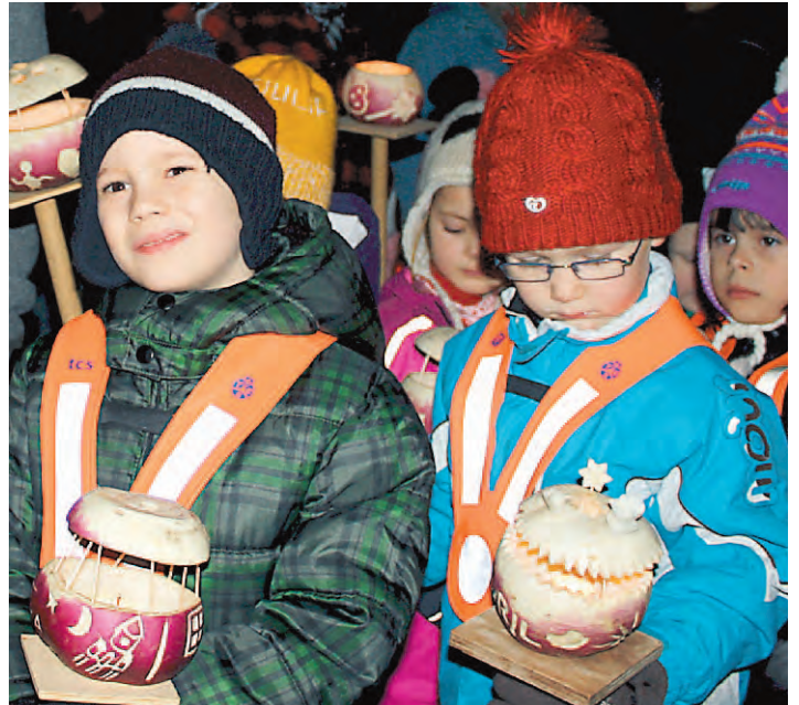
Das kalte Wetter konnte den Kindern den Spaß mit den Laternen nicht verderben.