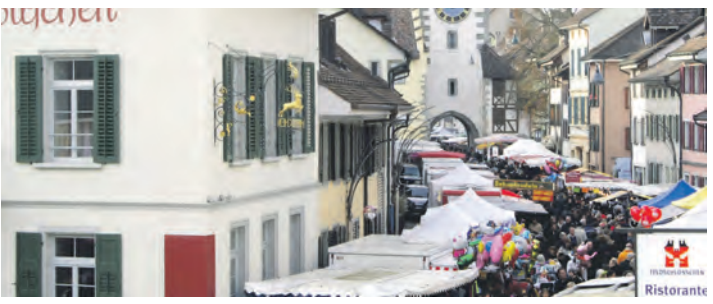
Ein richtig großes Marktgetümmel gab es in der Altstadt von Diessenhofen, als die Sonne sich am Sonntag zum Martinimarkt blicken ließ.