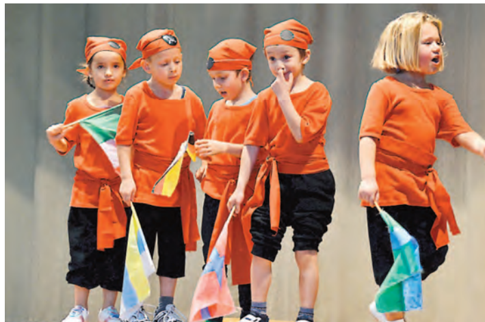
Kleine Piraten boten große Unterhaltung beim Jahresabschlussturnen der TG Welschingen.

Welschingen (mu). »Sport, Spiel, Spaß« - kein Zweifel: Bei der TG Welschingen bewegt sich was. Dies demonstrierte der rührige Sportverein unter Leitung des 1. Vorsitzenden Udo Mielke einmal mehr beim Jahresabschlussturnen in der Hohenhewenhalle. Mit einem bunten, unterhaltsamen Programm begeisterten die kleinen und größeren Turner ihr Publikum, das die Auftritte mit kräftigem Applaus honorierte. Ob die Kleinen der Eltern-Kind-Gruppen, die »Vorschul-Piraten« mit ihren Kunststücken oder die Gruselnummer der TG-Buben - um ihren Nachwuchs muss sich die TG Welschingen wahrlich keine Sorgen machen. Dies unterstrichen auch die Mädchen von »Dance&Fun« mit ihrer temperamentvollen Tanz-