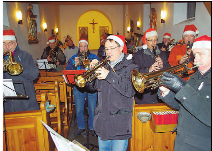
Ein reger Andrang herrschte auf dem Ebringer Weihnachtsmarkt am Mittwochabend, denn dort wurde wieder mit einem Auftritt der »Dramatischen Vier« und den »Original Aussteigern« (im Bild) in der Kirche für schöne Stimmung gesorgt. Der Renner an den Ständen waren natürlich wieder die Früchtebrote und Linzertorten der Frauengemeinschaft. Und in diesem Jahr besonders beliebt: gebastelte Lämmer aus Holz und Fell, die die Herzen der Kinder höher schlagen ließen. Mehr Bilder unter www.wochenblatt.net .

Schon seit einigen Jahren werden keine Gewinne mehr mit den Märkten gemacht. Ein Gewinnvortrag aus den Jahren 2008 und 2009 sei bereits mit dem Verlust aus dem Jahr 2011 aufgebraucht, eine Erhöhung der Standgebühren halte die Gemeindeverwaltung allerdings nicht für zielführend. Denn um die Kosten zu decken müssten die Preise für die Händler erheblich angehoben werden. »Eine Erhöhung dürfte nicht durchsetzbar sein«, sagte Bürgermeister Michael Klinger. Die Gebühren anderer Märkte in der Region, zum Beispiel des Schätzelemarkts, wären bei zusätzlich höherer Attraktivität dieser Märkte mit einer Erhöhung nicht mehr konkurrenzfähig. Lediglich beim Stromverbrauch solle eine Anpassung erfolgen. In Zukunft müssen Imbissbetreiber pro Stand 25 Euro bezahlen. Für sonstige Betreiber bleibt die Pauschale bei 15 Euro pro Stand.