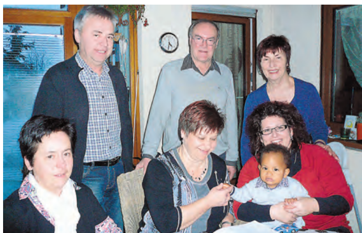
Die Verantwortlichen der »Brücke« freuen sich auf die Projekte im kommenden Jahr.

Gottmadingen (swb). Die erste Mannschaft der »Schachfreunde Gottmadingen« hat sich auch in der Landesliga im Spitzfeld behaupten können und sich mit einem Sieg auf den dritten Platz verbessert. Beim 5,5 zu 2,5 Punktesieg gegen die erste Mannschaft aus Engen stand es nach den ersten vier Partien lange Zeit 2 zu 2. Die letzten drei Partien blieben bis zum Schluss spannend. Die Runden im kommenden Jahr werden für die Schachfreunde entscheidend sein, denn dann geht es gegen die drei stärksten Konkurrenten aus Donau- eschingen, Brombach und Pfulendorf.