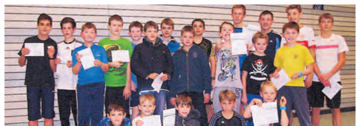
Die glücklichen Empfänger nehmen stolz ihre Urkunde entgegen.