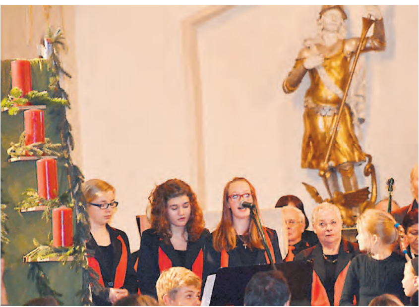
Die Vokalsolistinnen des Ensembles »Philia« beeindruckten beim Adventskonzert des Stadtchors Liederkrantz Engen.