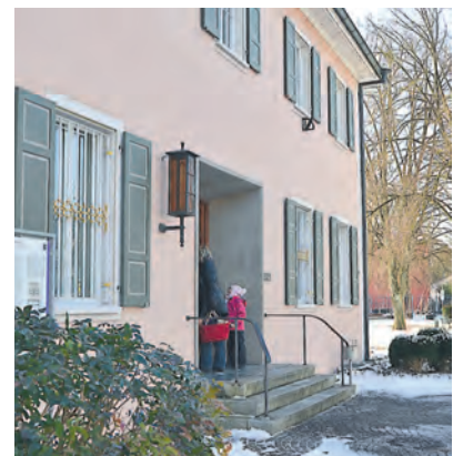
Altbau: Das ehemalige Rathaus soll nun barrierefrei hergerichtet werden.

Deshalb wurde das Architekten-Duo beauftragt eine kostengünstigere Planung vorzuschlagen, die im jüngsten Ausschuss vergangene Woche vorgestellt wurde. Der neue, reduzierte Plan, sieht eine preiswerte Rampe vor, die als Provisorium dienen soll.