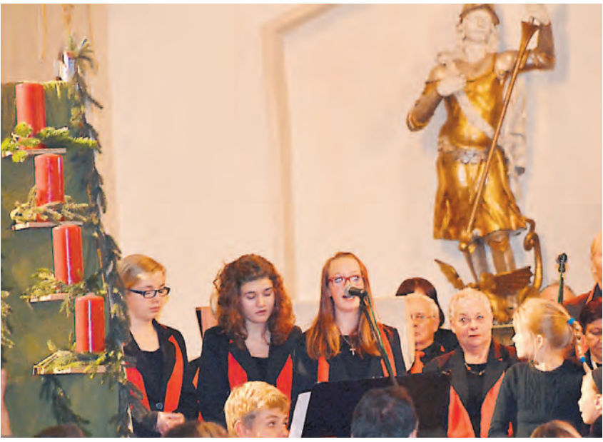
Die Vokalsolistinnen des Ensembles »Philia« beeindruckten beim Adventskonzert des Stadtchors Liederkrans Engen.