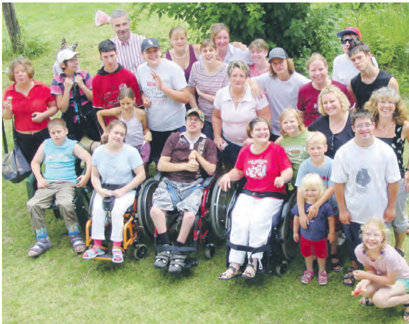
Die Mitglieder des »Querkecks« aus Radolfzell zeigen der Region schon seit 12 Jahren, wie gut eine Gemeinschaft tun kann.