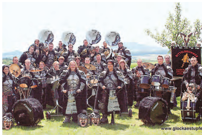
Zurzeit zählen die Bittelbrunner Glockästupfer 45 aktive, sowie 31 passive Mitglieder. Wie jedes Jahr sind die Guggen ab November auf die 5. Jahreszeit bestens eingestellt.

Engen-Bittelbrunn (swb). Auf zur Fasnachts-Warm-Up-Party in die Stadthalle Engen heißt es am Samstag, 12. Januar 2013, wenn die Guggenmusik Bittelbrunner Glockästupfer 1990 e.V. zu ihrem Halli Galli Guggenfäschcht einladen. Einlass ist ab 19 Uhr, Jugendliche unter 16 Jahre haben keinen Einlass. Die Glockästupfer haben ein abwechslungsreiches Programm mit bunten Guggenmusiken und Tanzeinlagen zusammengestellt. Dieses Mal werden die Guggenmusik »Schättere Dätscher« aus Engen, die »Schtägge Näschter« aus Honstetten, die »Krawazi Rambler« aus Villingen, die »Burgheuler« aus Tunningen sowie der »Gaszug« aus Randen den Abend mit ihren musikalischen Darbietungen bereichern. Aufgrund der positiven Resonanz aus dem letzten Jahr werden auch die Bittelbrunner Glockästupfer wieder mit dabei