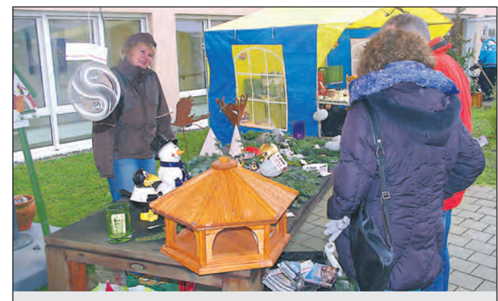
Singen zeigte am Sonntag mit dem keinen Adventsmarkt am Servicehaus Sonnenhalde Flagge in der Adventszeit. Nur war leider das Wetter den Veranstaltern nicht hold. Die Besucher, die auf den Markt kamen, zeigten sich begeistert über die Auswahl und das Angebot von Kunsthandwerk und Spezialitäten.