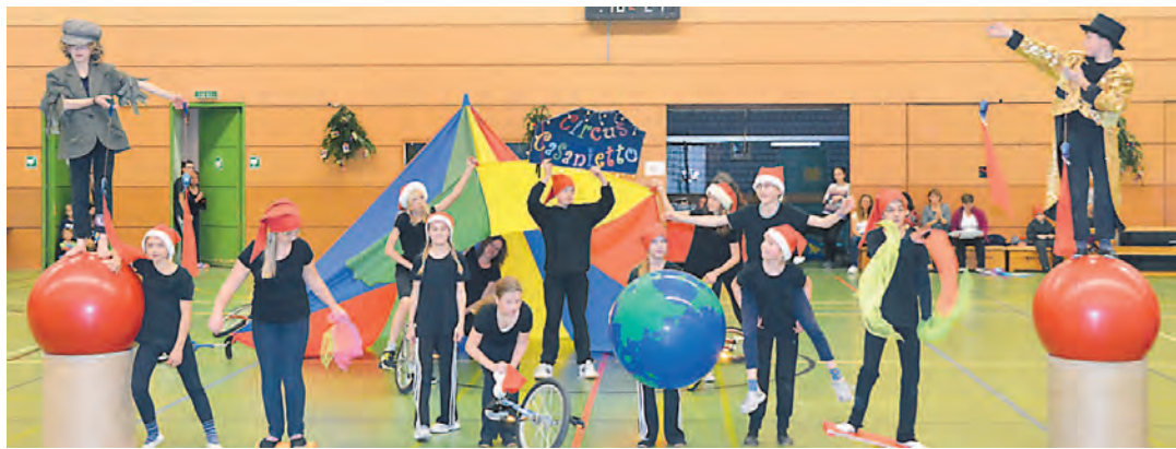
Bunt und fröhlich: Der Circus Casanietto zeigte seine Balance-Kunststücke beim Jahresabschlussturnen des TV Engen.

Vor den Augen zahlreicher Eltern, Großeltern und Gästen zeigten die verschiedenen Gruppen des TV Engen zu flotter Musik Ausschnitte ihres Könnens. Ob die Gerätewettkampfgruppe, das Bubenturnen oder der Mädchensport, die Kleinsten mit ihren Eltern oder die Gymnastik- und Tanzgruppe - die Übungsleiter/innen hatten mit ihren Schützlingen phantasievolle Darbietungen