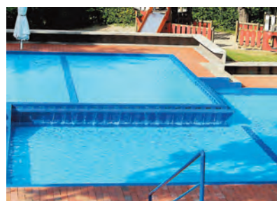
Stilles Wasser: Die Becken des Höhenfreibads sollen in der kommenden Saison nicht mehr gefüllt werden.

Gottmadingen (lkr). Kurzfristig hatte das Bürgermeisteramt in Gottmadingen am Freitagvormittag der vergangenen Woche eine Pressekonferenz einberaumt. In der Ankündigung hieß es schnörkellos: Höhenfreibad - Saison 2013. In der Konferenz dann platzte die Bombe. Das Gottmadinger Freibad wird im kommenden Jahr geschlossen bleiben. Aufgrund von erheblichen Wasserverlusten und einzelner Wasserrohrbrüchen, habe das Bad in der vergangenen Saison bis zu 20.000 Kubikmeter Wasser verloren. Durch Risse und Schäden geht aber nicht nur das Wasser verloren, sondern mit diesem dringen auch Stoffe, wie beispielsweise ein Zusatz, der die Veralgung der Becken verhindert, in das Erdreich ein. »Als Betreiber des Bades kann die Gemeinde mit diesem Wissen in der nächsten Saison keine weiteren Wasserverluste tolerieren«, sagte Bürgermeister Michael Klinger. Für Hermann Püthe, Vorsitzenden des Höhenfreibad-Fördervereins, kam die Nachricht überraschend: »Das war für uns ein Nackenschlag. Die tägliche Nutzung des Bades, auf