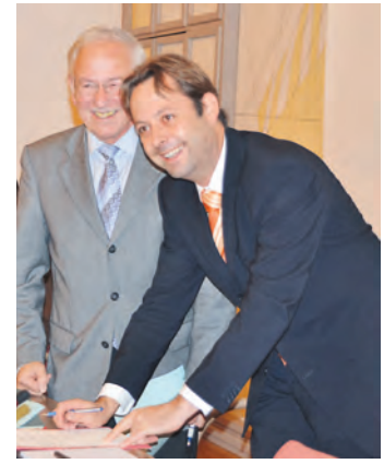
Im Amt bestätigt

4,5 Millionen Euro hat die neue Büsinger Mehrzweckhalle gekostet, die nach einem Brand komplett neu gebaut werden musste. Zwei Jahre haben Planung und Bauphase gedauert. Jetzt steht das Glanzstück mit Namen »Exklavenhalle« und herrlicher Aussicht über die Region.