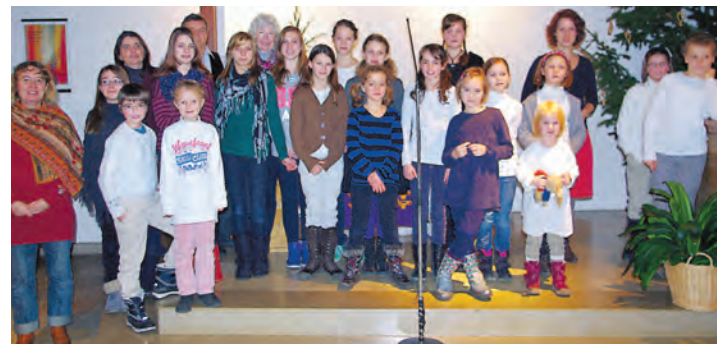
Die Schauspieler des Krippenspiels in der Rielasinger Johanneskirche bekamen für ihren Auftritt viel Lob und Applaus.