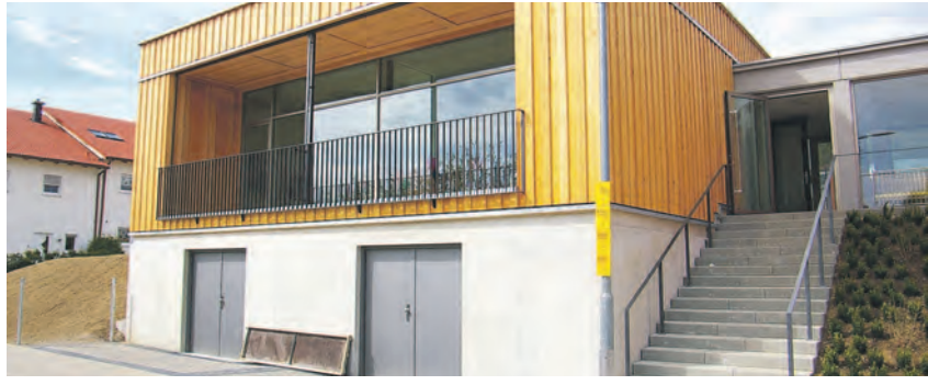
Vor zwei Jahren wurde der Anbau des Kindergartens »Im Taschen« eingeweiht. Der Rest der Betreuungseinrichtung ist mehr als zehn Jahre alt.

Doch die Pfeiler sind immer noch nass«, beschrieb Kopp. Auch langfristig durchgeführte Feuchtigkeitsmessungen ergaben, dass weder Winter, noch Sommer eine Rolle beim Wasser an den Pfeilern spielen. Der Vertreter des Bauamts warf die ganze Thematik