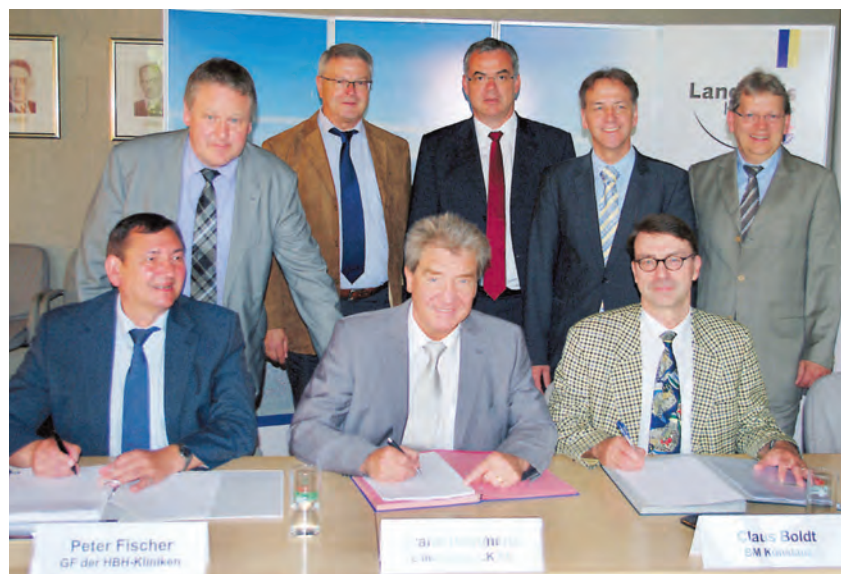
Einen Tag nach dem gescheiterten Bürgerentscheid gegen die Klinikfusion wurde im Juli in Konstanz der Vertrag für die Kreis-Klinikholding unterschrieben, der die Gesundheitsversorgung der Region nachhaltig sichern soll.