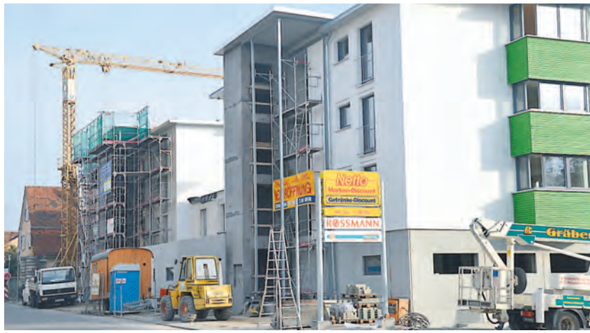
Kräftig gebaut wird derzeit in Engens Breite Straße. Neben Geschäften entstehen auch Eigentums- und Mietwohnungen, die sehr gefragt sind.