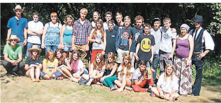
Die Freizeit der Kolpingsfamilie Stockach war ein voller Erfolg.