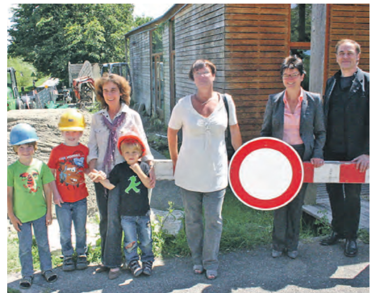
Das Zeugnis der Stadt Radolfzell in Sachen Kinderbetreuung fällt durchwachsen aus. Vor allem eine fehlende Fachberaterstelle wurde bemängelt. Anders sieht es hingegen beim Angebot aus: Hier stehen die Stadt und ihre Ortsteile gut da. Dazu zählt auch die Sanierung im Böhlinger Kindergarten.