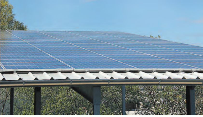
Ähnlich hätte der Solarpark in Böhningen aussehen können, doch die Stadtwerke Radolfzell legten am Mittwoch ihr Veto ein. Die Wirtschaftlichkeit der Anlage konnte nicht gewährleistet werden.