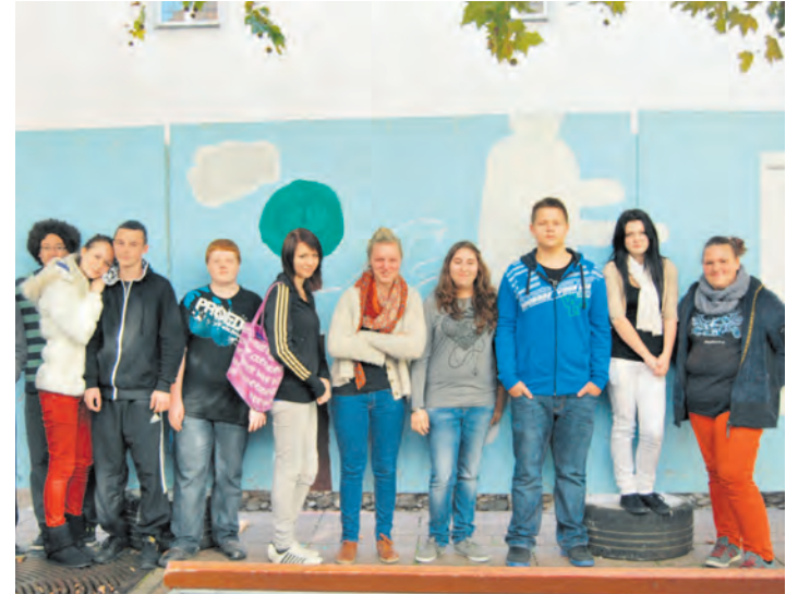
Die Neuntklässler der Hauptschule der Ratoldusschule stehen ihren jüngeren Mitschülern in Sachen Kunst in nichts nach: Auch sie beteiligten sich am neuen Bauzaun.