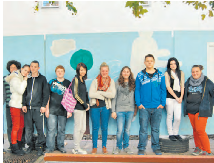
Die Neuntklässler der Hauptschule der Ratoldusschule stehen ihren jüngeren Mitschülern in Sachen Kunst in nichts nach: Auch sie beteiligten sich am neuen Bauzaun.