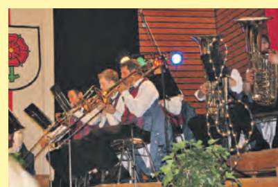
Ein musikalisches Highlight bot der MV Güttingen beim jährlichen Osterkonzert, unterstützt durch die Stadtwerke Radolfzell.

Als Radolfzeller Unternehmen nehmen die Stadtwerke Radolfzell ihre Verantwortung ernst. Mit dem Engagement für Radolfzell und ihren Bürgerinnen und Bürgern - den Kunden der Stadtwerke - werden verschiedene Projekte in der Stadt unterstützt. Ein wichtiges Anliegen war dabei immer die Unterstützung von Vereinen oder Institutionen durch Sachmittel, Dienstleistungen oder finanzielle Mittel. Sponsoring beruht auf dem Prinzip der gegenseitigen Partnerschaft. Im Jahr 2012 haben die Stadtwerke Radolfzell eine Vielzahl von Vereinen und Projekten im sportlichen, kulturellen und sozialen Bereich unterstützt: