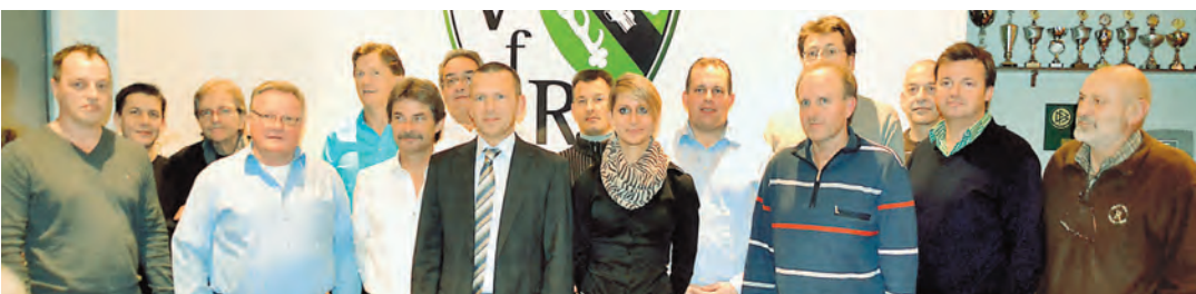
Der VfR Stockach gab sich teilweise eine neue Führungsriege.