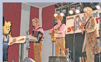
Super Partystimmung in der vollen Mindelseehalle beim Auftritt von Alpenstarkstrom.

ner Kletterwand oder Kistenklettern. Wer nicht klettern wollte, konnte sein Glück bei dem Preisausschreiben und einem Dreh am beliebten Glücksrad versuchen.