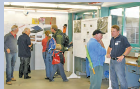
Viele interessante Gespräche führten die Besucher mit den Mitarbeitern der Stadtwerke Radolfzell.

Einen Blick hinter die Kulissen konnten die Besucher der Stadtwerke Radolfzell Ende September bei dem „Tag der offenen Tür“ werfen. Viele Besucher trotzten dem regnerischen Wetter und besichtigten die Leitstelle und Werkstätten der Strom-, Gas- und Wassermonteur. Mit viel Engagement wurden die Geräte und täglichen Arbeitsabläufe bei den Stadtwerken Radolfzell vorgestellt. Besonders beliebt war der Hubsteiger, von dem aus man in 18 Meter Höhe den Ausblick über Radolfzell genießen konnte. Auch für die kleinen Besucher bot sich ein buntes Programm von Kinderschminken, ei-