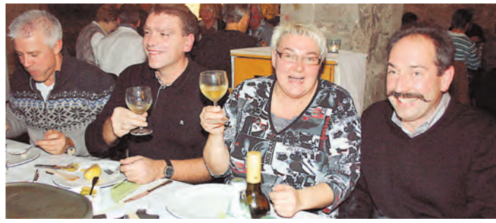
Zu einem Treffen in geselliger Runde kamen am Samstag über 60 Interessierte in Öhningen zusammen, um die Gründung eines Weinbauvereins vorzubereiten.