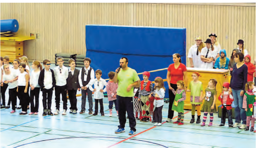
Das ganze Spektrum an Nachwuchsturnern gab es bei der Turnschau des TV Radolfzell zu sehen.