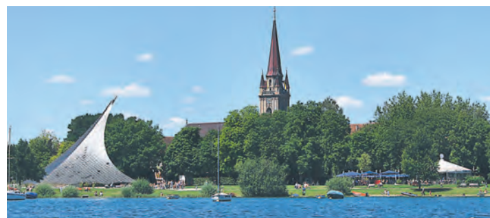
Noch in diesem Jahr entsteht ein öffentlicher Grillplatz. Für 2013 ist der Baubeginn eines Wasserspielplatzes im Bereich Wäschbruck geplant.

Touristische Angebote, Erschließung, Freianlagen, Natur und See, Veranstaltungen und Kultur, Soziales, Kinder – dies waren die Themen, die bei der Planungswerkstatt Seepromenade mit Vorschlägen, Ideen und Konzepten gefüllt wurden. Doch so vielfältig und kreativ die Eingaben von den Bürgern, den Fachleuten, in diesem einen Punkt war man sich einig: Die Seepromenade soll ein Be-