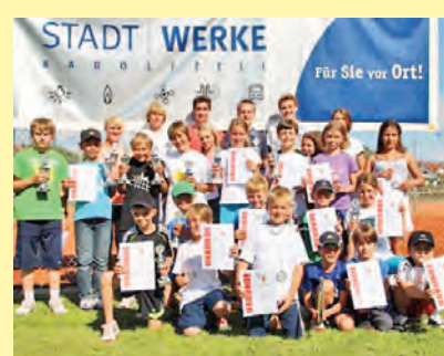
Die Stadtwerke sponserten wieder das Jugendturnier der Abteilung Tennis vom SV Markelfingen.