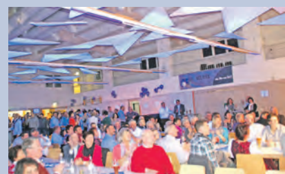
Schnelles Internet in den vier Ortsteilen Güttingen, Liggeringen, Möggingen und Stahringen war Anlass zum Feiern. Vorbei sind die Zeiten von Surfen im Internet im Schnecken tempo. Die Glasfaserverkabelung (Breitbandversorgung) für „Schnelles Internet“ wurde erfolgreich verlegt. Inzwischen surfen bereits über 100 Kunden in den vier Ortsteilen mit Lichtgeschwindigkeit durchs World Wide Web. 80 weitere folgen in den nächsten Wochen. Dies war Grund genug in der Mindelseehalle mit der Partyband „Alpenstarkstrom“ einen geselligen und lustigen Abend mit zahlreichen Gästen zu verbringen.