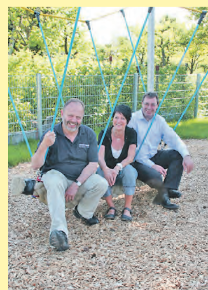
Für eine sanfte Landung sorgen die Holzhackenschnitzel der Stadtwerke Radolfzell auf dem neuen Spielplatz des Kindergartens Liggeringen