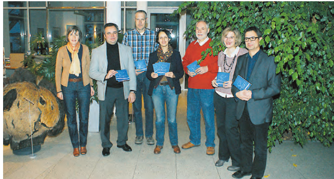
Die an der Erstellung der Broschüre »Letzte Wege« Beteiligten freuen sich über ihre gelungene Arbeit.

Zu einer Adventsfeier lädt der Tierschutzverein seine Mitglieder ein auf So., 2.12., 14-18 Uhr, ins Tierheim Singen. Um 15 Uhr hat Sankt Nikolaus im Begegnungsraum sein Kommen mit vielen Geschenken angekündigt.