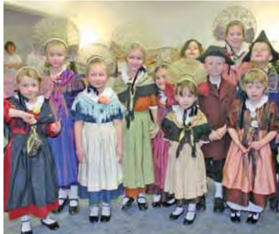
Beste Werbung für die Stadt machte die Trachtengruppe »Alt-Radolfzell« in der Mettnau-Kur. Besonders die Kindergruppe begeisterte die Zuschauer mit schönen Tänzen.

bedauert sie es, dass kein einziger Tanz aus der Region überliefert ist. Etwa dreimal im Jahr treten nun die sympathischen Kulturbotschafter in der Mettnau-Kur auf und machen beste Werbung für die Stadt. So begeisterten 14 Männer und Frauen sowie 12 Kinder, begleitet von einem famosen Ensemble des Akkordeon-Orchesters, am vergangenen Freitag in der Werner-Messmer-Klinik die zahlreichen Gäste.