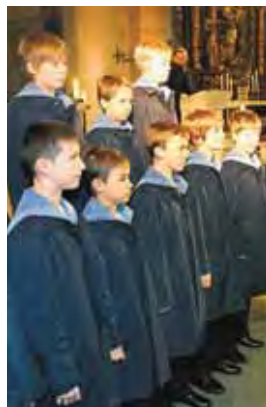
Ein begeisterndes Weihnachtskonzert präsentierten die Wiener Sängerknaben im Münster.

Cagnin: Die singenden Matrosen im Alter von zehn bis 14 Jahren bewiesen unglaublich intensive Musikalität. A-capella-Gesänge sind im Übrigen eine Spezialität des gebürtigen Italiens, was man deutlich merkte. Zudem verstand es Cagnun stets, das Publikum durch Gesten und Worte mit einzubinden.