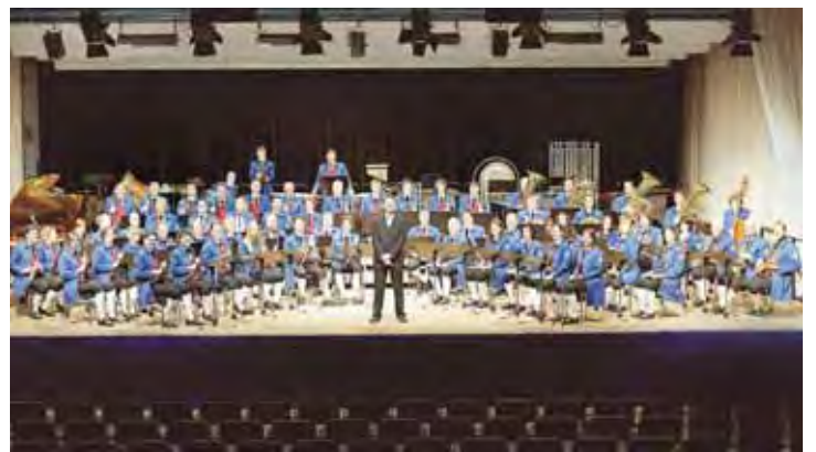
Die Stadtkapelle verspricht auch beim diesjährigen Adventskonzert feierliche und moderne Sakralmusik passend zur vorweihnachtlichen Jahreszeit.