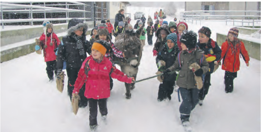
Große Freude hatten die Schulklassen auf dem Hofgut Brauenberg.