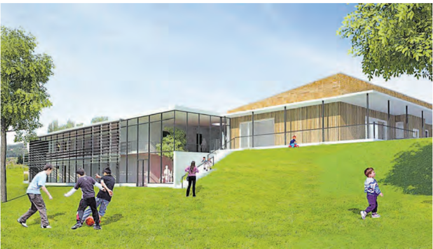
...planen die Experten vom Büro »Oehme« mit einer »Haus-in-Haus-Variante«, die die Sanierung des Schulgebäudes vorsieht.