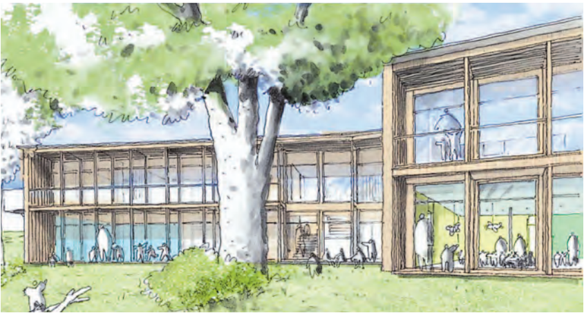
Während das Büro »Mangold und Thoma« dem Kinderhaus Möggingen eine grünesw-Bild: Mangold und Thoma