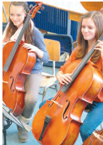
Bereits seit 50 Jahren laden die Schülerinnen und Schüler des Friedrich-Hecker-Gymnasiums zum Weihnachtskonzert.

Hecker-Gymnasium lädt zum 50. Weihnachtskonzert