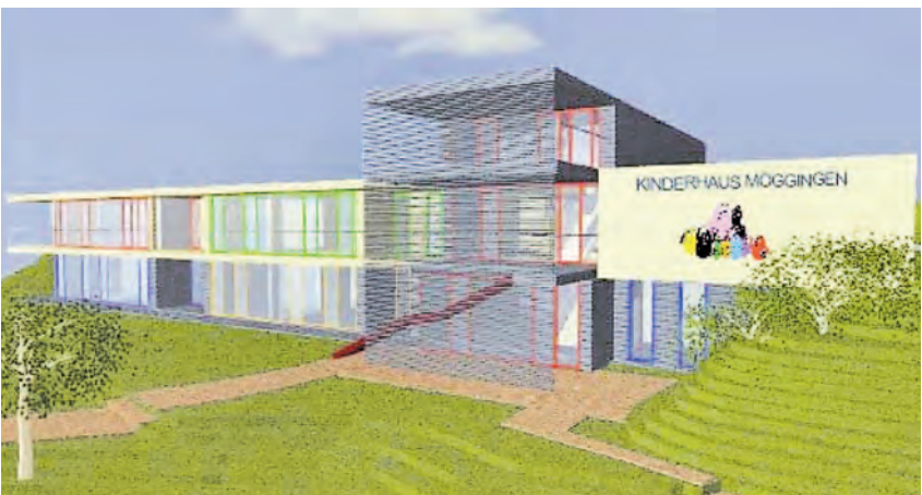
Eine weitere Möglichkeit stellte das Büro »Frei« vor. Es ist das Einzige, das den Abriss von Kindergarten und Schule vorsieht.