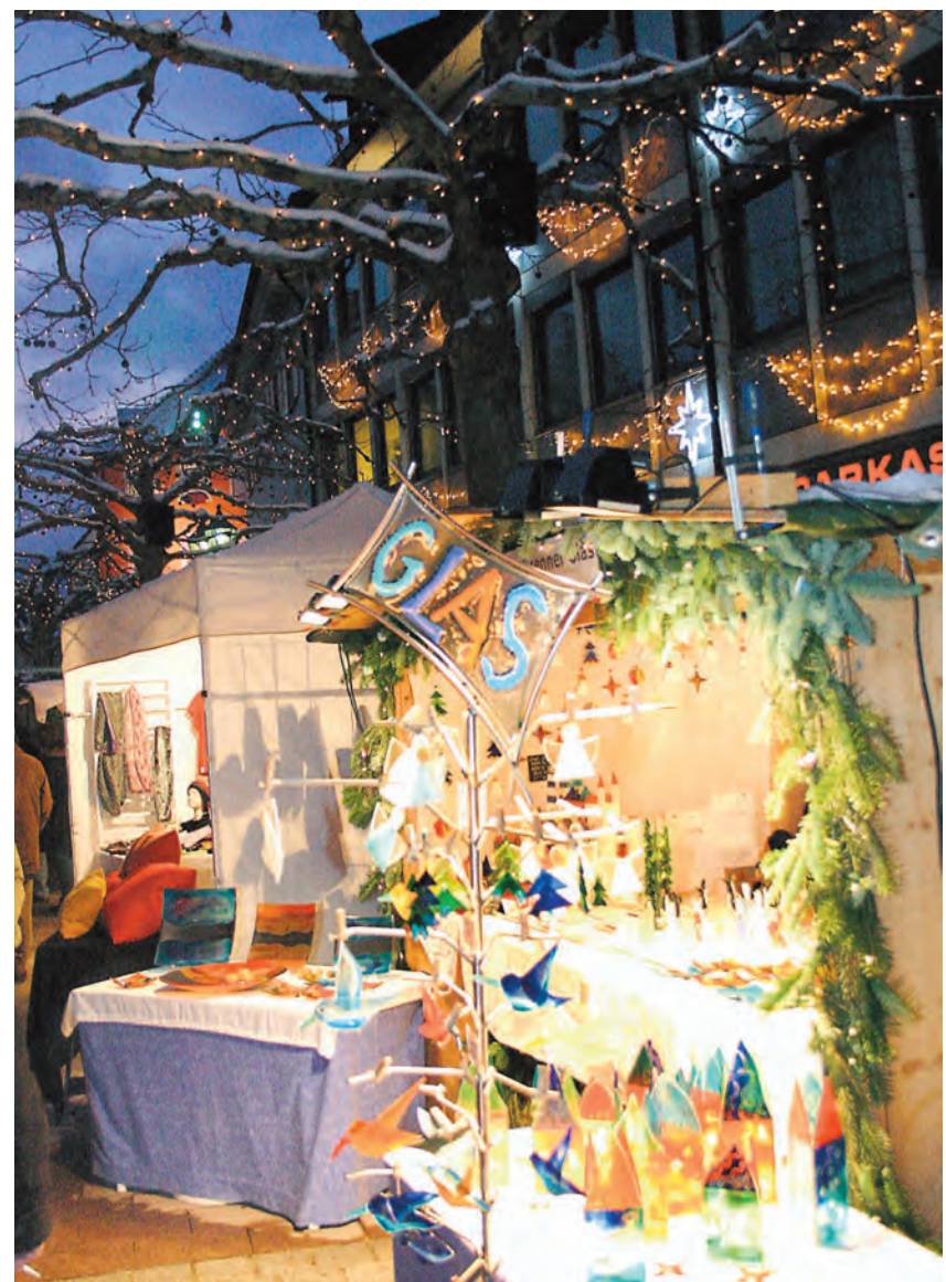
Der Christkindlesmarkt in Radolfzell trumpfte erneut mit hochwertigen Angeboten und vorweihnachtlichem Flair.