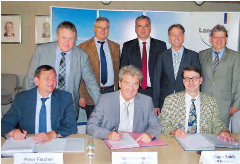
Einen Tag nach dem gescheiterten Bürgerentscheid gegen die Klinikfusion wurde im Juli in Konstanz der Vertrag für die Kreis-Klinikholding unterschrieben, der die Gesundheitsversorgung der Region nachhaltig sichern soll.