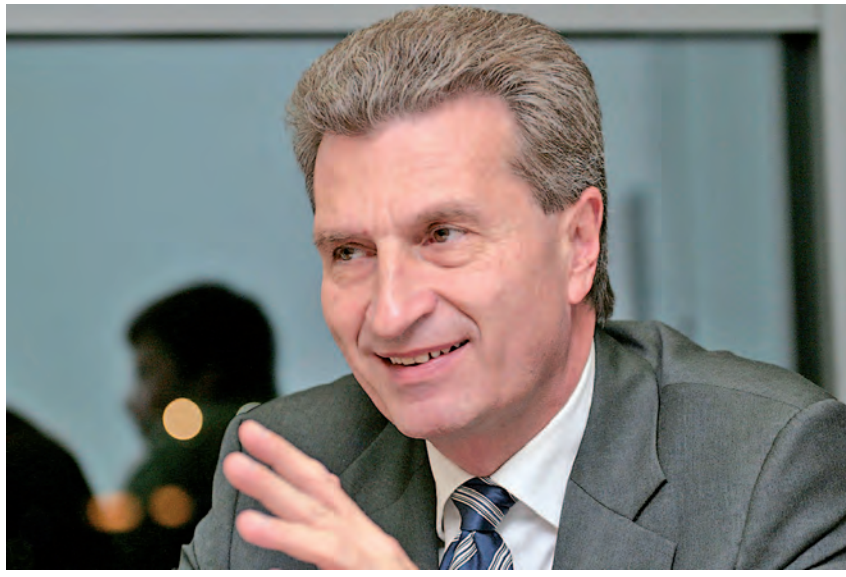
Er ist in diesem Jahr der prominenteste Redner bei den 37. Naturschutztagen in Radolfzell: EU-Kommissar Günther Oettinger.

Am Freitag, 4. Januar, steht in diesem Jahr an prominenter Stelle das Thema »Energiewende« auf der Agenda. Um 12 Uhr spricht EU-Kommissar Günther Oettinger über Ener-