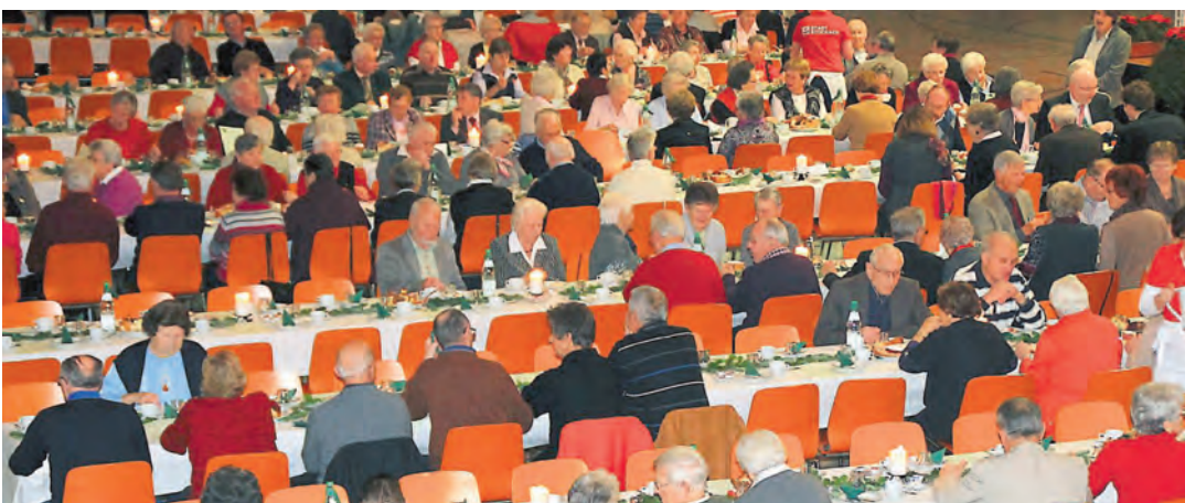
Zahlreiche Senioren erlebten unterhaltsame Stunden in der Jahnhalle.