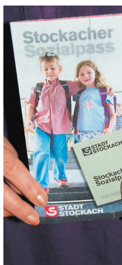
Der Nutzerkreis des Stockacher Sozialpasses wird ab April 2013 erweitert.

Sie alle, so Rainer Stolz, können die Leistungen des Sozialpasses in Anspruch nehmen, ohne ein schlechtes Gewissen zu haben. Bisher haben sich aber von aktuell etwa 680 Berechtigten nur 132 einen gültigen Sozialpass ausstellen lassen. Darum soll diese besondere Serviceleistung nach dem Willen von Stadt und Gemeinderat künftig noch besser be-