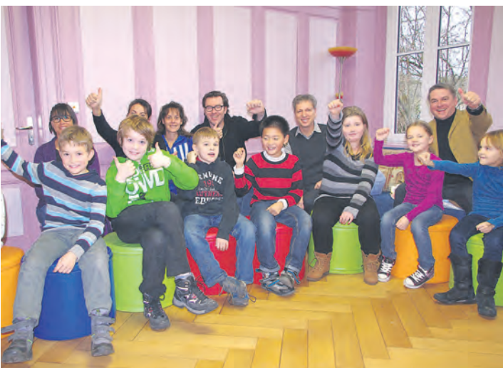
Die Schüler der Nachmittagsbetreuung der Rielasinger Schiefelschule freuen sich über neue Sitzkissen, die dank einer Spende der MZV Dienstleistungs GmbH des Müllabfuhr Zweckverbands Hegau, im Jugendtreff Juca 60 angeschafft werden konnten, wo die Betreuung auch stattfindet.