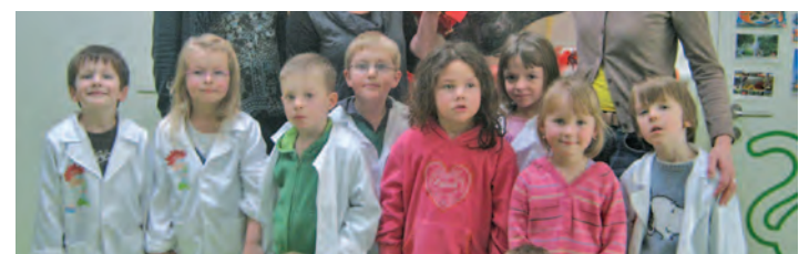
Der Kindergarten »Löwenzahn« in Eigeltingen wurde als erste Einrichtung im Raum Stockach als »Haus der kleinen Forscher« zertifiziert.

sie im Kindergartenalltag um, und sie starteten die Aktion »Die vier Elemente - Teil 1: Erde«, mit der sich die Einrichtung für die Zertifizierung beworben hatte. So kamen kleine Forscher ganz groß raus. »Die gemeinnützige Stiftung »Haus der kleinen Forscher« engagiert sich mit einer bundesweiten Initiative für die Bildung von Kindern im Kita- und Grundschulalter in den Bereichen Naturwissenschaften, Mathematik und Technik«, erklärt der Presstext. Unter diesem Dach hat sich das Netzwerk »Stockach +5« gebildet, das seit Herbst 2009 Fortbildungen ermöglicht. Finanziert wird die Initiative auch mit Hilfe der ETO-nahen Christa- und Hermann-Laur-Stiftung. Die Zertifizierung bescheinigt, dass Forschern und Experimentieren in der jeweiligen Einrichtung zum Alltag der Kinder gehören und die Erzieherinnen regelmäßig für diesen Zweck fortgebildet werden. Um die Zertifizierung kann sich jede Kita bewerben, die Teil eines lokalen Netzwerks der Stiftung »Haus der kleinen Forscher« ist.