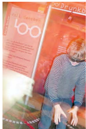
Im Rahmen eines Mitmachparcours wird über die Gefahren von Tabak- und Alkoholkonsum hingewiesen.

Stockach (swb). Auf Initiative der Stadtjugendpflege Stockach wird am Donnerstag, 11., und Freitag, 12. April, im Bürgerhaus »Adler Post« in der Hauptstraße der »KlarSicht«-MitmachParcours aufgebaut. Die