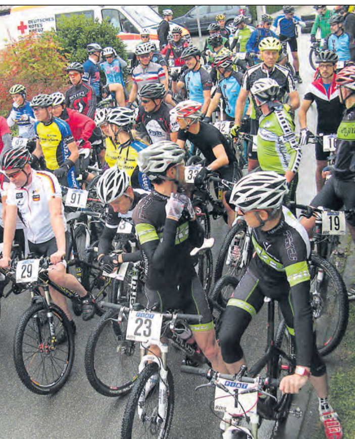
Am Sonntag fand das Mountainbikerennen des RMSV Nenzingen zum 15. Mal statt und war mit knapp 80 Startern ein voller Erfolg. Die Sieger der Rennen unter www.wochenblatt.net . Die Ergebnisse aller Rennen auf www.rmsv-nenzingen.de .

zertante Akkordeonmusik zu begeistern. Beispielsweise die 22 Sänger des Eigeltinger Männerchores, die sogar a capella zeigten, dass sie noch gut in Schuss sind. Oder die 15 gestandenen Schweizer Mannsbilder von »MARABU«, die sich stimmungsgewaltig, treffsicher, dynamisch gekonnt, sowie mit natürlichem Humor und unverkrampftem Kontakt mit dem Publikum zu den ungekrönten Königen der Sängerherzen