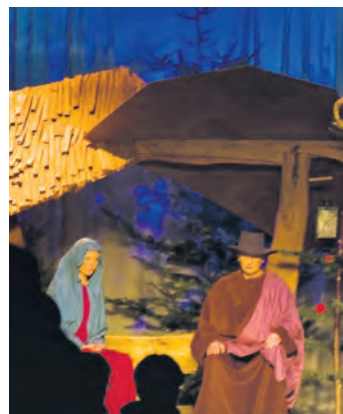
Im Pestalozzi-Kinderdorf in Wahlwies wird die Weihnachtsgeschichte als Mundartstück aufgeführt.

Stockach (swb). Sie ist uralt und doch immer wieder neu – die Geschichte von der Geburt des Jesusknaben im Stall. Das Geschehen an Heiligabend bringt ein Ensemble des Pestalozzi-Kinder- und -Jugenddorfs auf die Bühne. Gezeigt wird das Oberuferer Christgeburtsspiel am Donnerstag, 19. Dezember,