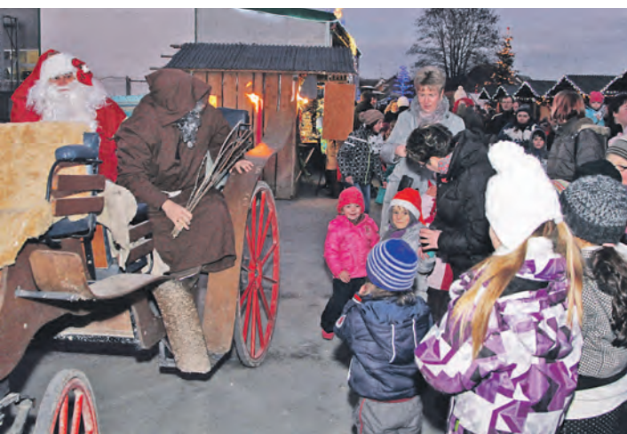
Er war der willkommene Ehrgast in Eigeltingen: Santa Claus schaute beim Weihnachtsmarkt vorbei und erfreute damit große und kleine Besucher.