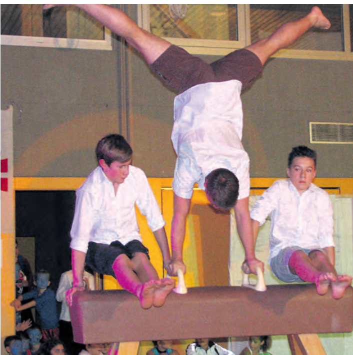
Und sie stellten sich sogar auf den Kopf, um ihr Publikum zu unterhalten: Die Turnschau des TV Jahn war ein voller Erfolg.