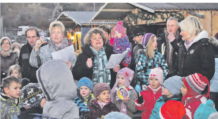
Die Kinder und Erzieherinnen des Kindergartens »Löwenzahn« aus Eigeltingen unterhielten die Besucher des Weihnachtsmarktes Eigeltingen mit gekonnter Live-Musik.