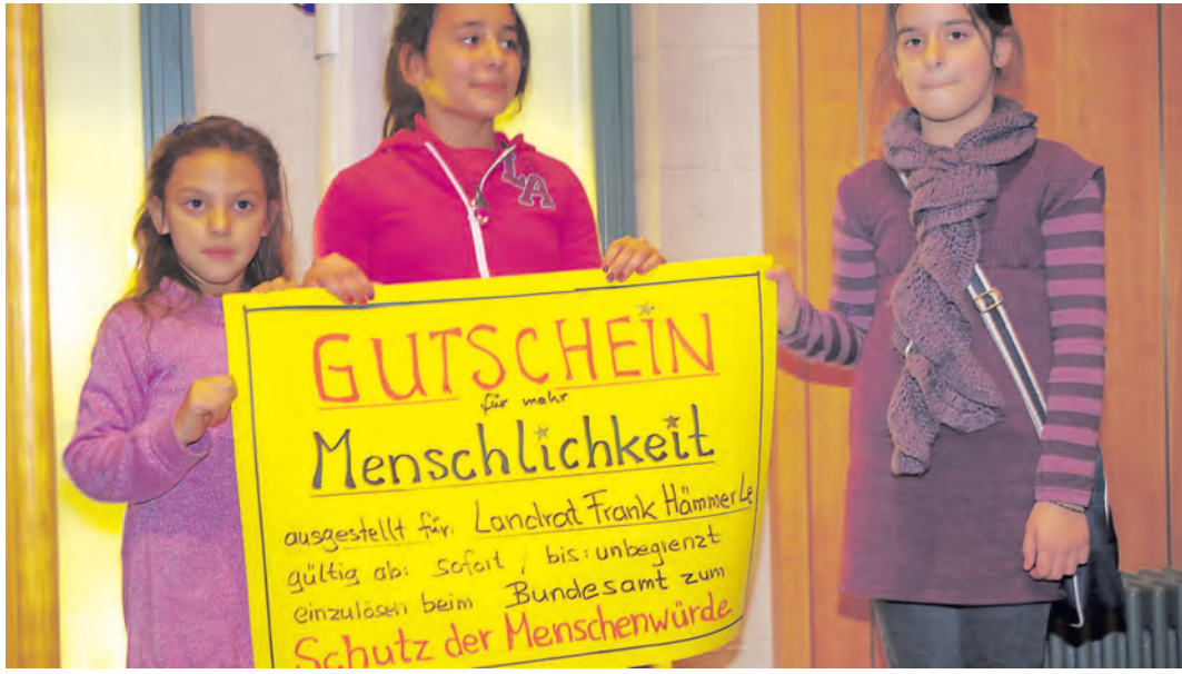
Kinder drücken ihre Enttäuschung über den Landrat mit einem Geschenk aus.

Doch dazu gibt es eine andere Seite. Am Montag stürmten an die 200 Flüchtlinge und Asylbewerber den Saal des Kreistags, um auf ihre Lage aufmerksam zu machen. Das sind Menschen, für die unser Land ein Ziel der Hoffnung war. Wir können uns schließlich oft kaum vorstellen, aus welchen Zuständen diese Menschen geflohen sind und welche Ängste, aber auch Hoffnungen sie dazu bewegen. Viele der Hoffnungen von Flüchtlingen werden von unserer Bürokratie aber zunächst nicht erfüllt in einem langen Verfahren bis zur möglichen Anerkennung als Asylant. Der Auftritt hat spürbar gemacht, wie schnell Hoffnung einen bitteren Beigeschmack