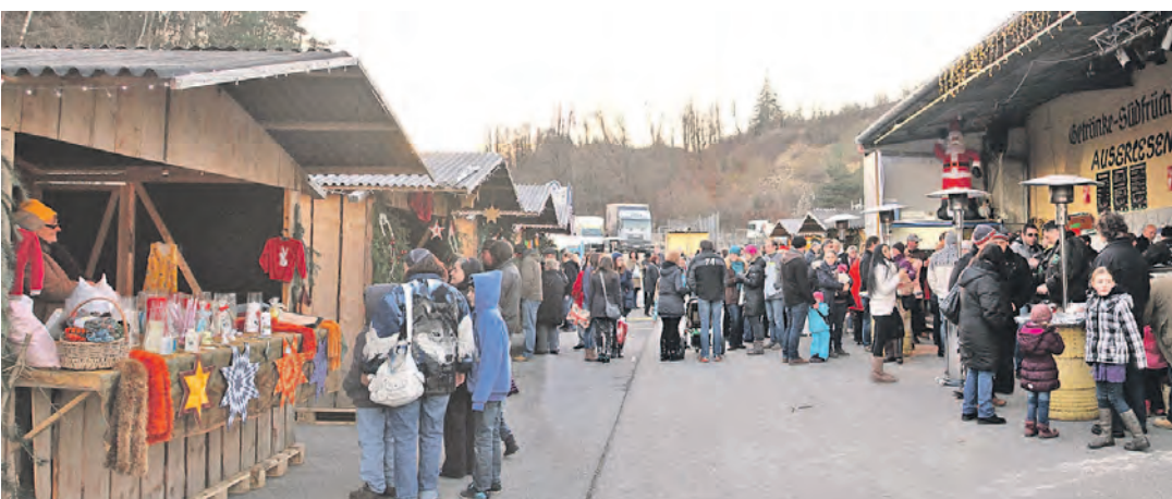
Das war eine gelungene Einstimmung auf Weihnachten: Auf dem Gelände von »Getränke Baumann« in Eigeltingen wurde eine zauberhafte Budenstadt aufgebaut. Die Besucher konnten sich an den Ständen umschauen und sich unter den zahlreichen Waren das Passende aussuchen.