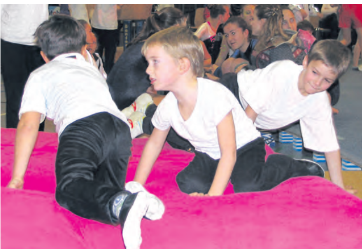
Der TV Jahn Zizenhausen bewies, dass er eine gute Kinder- und Jugendarbeit betreibt.

In dieser gelungenen Verbindung von Sehen und Hören, von Bewegung und Aktion im Rhythmus liegt der Erfolg der Turnschau in Zizenhausen. Und natürlich in der Demonstration des körperlichen Bewusstseins, das schon die Kleinsten der Mittwochsguppe darstellten. Überhaupt zeigte sich in der Turnschau ein ganz junger Turnverein, der sichtlich viel Arbeit und Engagement in die Kinder- und Jugendarbeit steckt. Und dafür durften sich insbesondere die Trainer und Betreuer im Schlussapplaus räkeln. Der Verein hatte in seiner Ankündigung nicht zu viel versprochen – es war »ein buntes, abwechslungsreiches Programm« von vielen für viele.