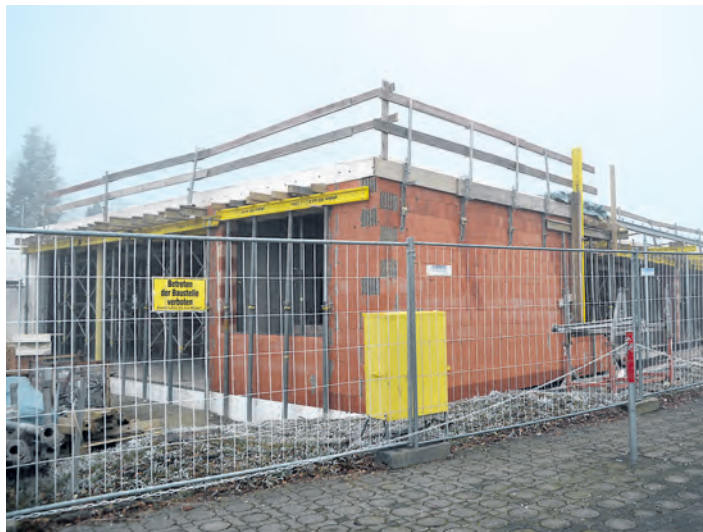
In Hohenfels-Liggersdorf werden ein Anbau an den Kindergarten und ein neues Schulgebäude errichtet.

Walter Benkler: Durch den Anbau entsteht eine zweite Krippengruppe für zehn Kinder von eins bis drei Jahren. Insgesamt stehen uns damit 20 Krippenplätze für Kinder im Alter von