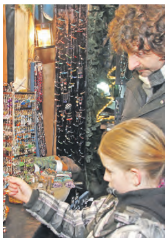
Wer etwas ganz Besonderes für den Gabentisch suchte, wurde in Eigeltingen fündig.