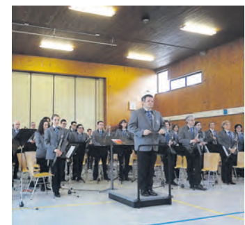
»Mit sehr gutem Erfolg« wurde die Stadtkapelle bewertet.