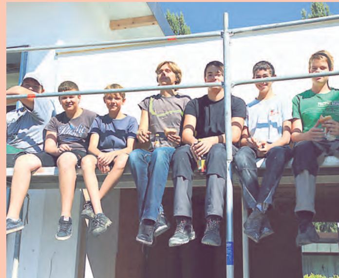
Über die Hälfte der DLRG-Mitglieder sind Jugendliche. Sie profitieren von dem Neubau am stärksten.

amtlichen 25 Einsätze im Jahr zu absolvieren. Notfälle im und am Wasser führen sie rund um den Bodensee. Auch sind sie an Badesseen, Bächen und Weihern von Stockach bis nach Tuttlingen im Einsatz.