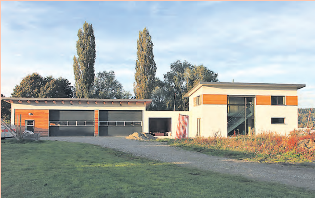
Am Muttertag weihet die DLRG Bodman-Ludwigshafen ihre neue Wasserrettungswache (rechter Gebäudeteil) ein. Die Fahrzeughalle (li.) steht schon seit gut zwei Jahren.

Pünktlich zur Eröffnung der Wachstation am Muttertag am 12. Mai weihet die DLRG Bodman-Ludwigshafen ihre neue Wasserrettungswache im Rahmen eines kleinen Festes ein. Bereits vor gut zwei Jahren ist beim Strandbad Bodman im ersten Bauabschnitt eine Fahrzeughalle mit einem Raum für die Taucherausrüstung entstanden. Insgesamt 500.000 Euro hat das Projekt gekostet. Die Hälfte davon hat das Land Baden-Württemberg finanziert. Auch die Gemeinde und die Stiftung Was-