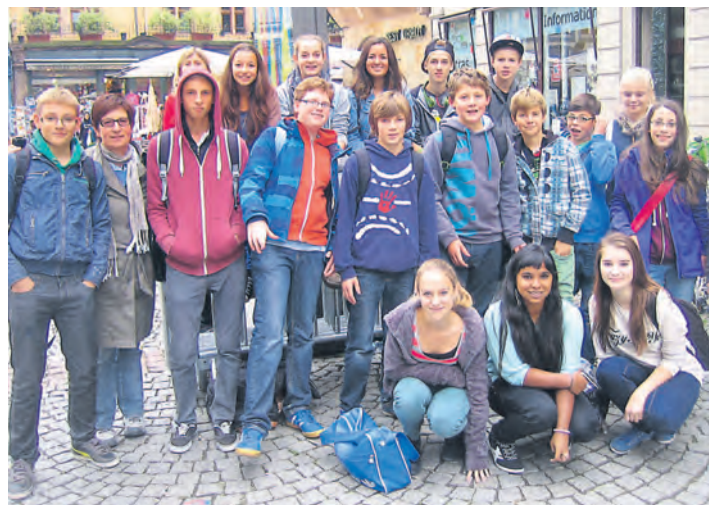
Die Klasse 8f vor dem »Office de tourisme«.

Radolfzell (swb). Im Oktober steuerten die Klassen 10b und 8f der Gerhard-Thielcke-Real-schule ein gemeinsames Ziel an: Straßburg. Vor Ort gab es dann ein unterschiedliches Programm. Die Klasse 8f erlebte einen besonderen Französisch-Unterricht der besonderen Art und setzte sich mit Fragen wie »Was heißt noch mal Stadtplan auf Französisch?« auseinander. Nach einer kurzen Orientierungsphase startete die Klasse in Kleingruppen zur Stadt-Rallye, bei der es galt, Gebäude und Besonderheiten Straßburgs aufzuspüren. Dabei durften natürlich auch Passanten helfen. Zur gleichen Zeit besuchte die Klasse 10b das EU-Parlament, welches im EWG-Unterricht bereits thematisiert wurde. Dabei