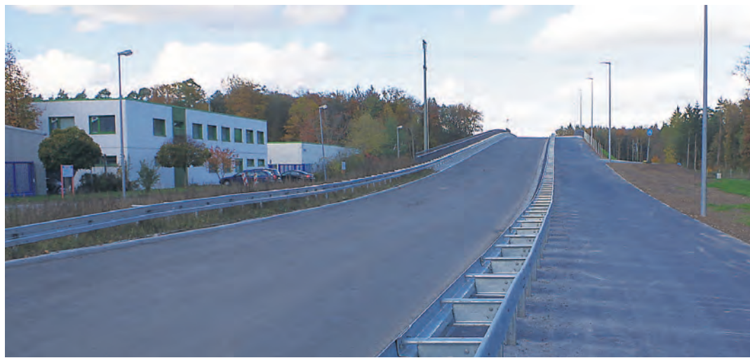
Die neue Mittelspange Nord in Singen wenige Tage vor ihrer Eröffnung: Nach 60 Jahren Planungen und zweieinhalb Jahren Bauarbeiten kann nun am Freitag die offizielle Freigabe der Brücke über die Bahnlinie in Singens Süden erfolgen.

Singen (of). Am Freitag ist es nun endlich soweit. Um 11 Uhr kann offiziell das Band zur Freigabe der neuen »Mittelspange Nord« von OB Bernd Häusler durchschnitten werden, nachdem seit Montag schon die ersten Fahrzeuge das neue Straßenstück passieren dürfen. Die neue Trasse mit Brücke über die Bahnlinie hat mit allen begleitenden Maßnahmen einschließlich eines neuen Kreisels an der Bundesstraße 34 insgesamt 6,9 Millionen Euro gekostet. Die Mittelspange soll in Zukunft für die bessere Verbindung zwischen dem Singener Industriegebiet und dem neu gewachsenen Gewerbegebiet Hardmühl Nord wie dem EKZ sorgen, wo bisher die Bahnlinie nach Radolfzell für eine Trennung gesorgt hatte, die weiträumig umfahren werden musste. Das WOCHENBLATT präsentiert heute die neue Verbindung und den Singener Martinimarkt in der City mit dem gemeinsamen verkaufsoffenen Sonntag von City und Singens Süden.