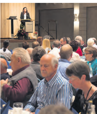
Einen Nachmittag verbrachten 200 Allweiler-Pensionäre im Milchwerk.

Radolfzell (swb). Das Bürgerbüro mit Einwohnermelde- und Passamt ist am Mittwoch, 13. November 2013, wegen einer Fortbildung der Mitarbeiterinnen und Mitarbeiter geschlossen.