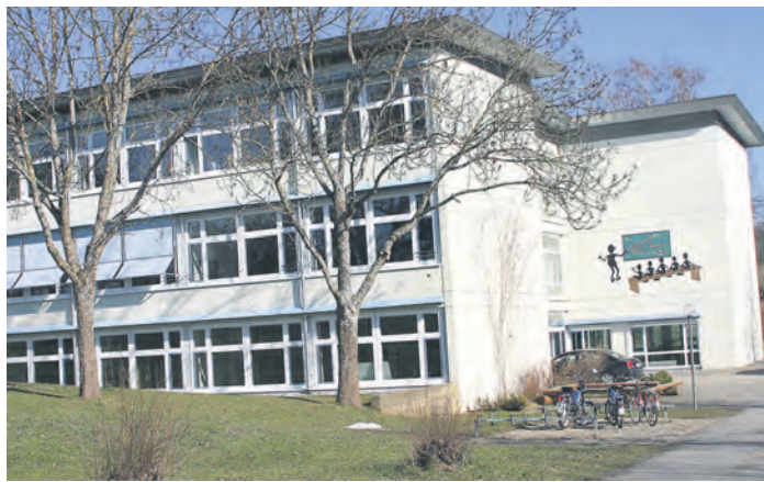
Um das Fortbestehen dieses Gebäude kämpfen Schulangestellte und Schulträger gemeinsam.

Tengen (Ikr). Die Anmeldetermine für die Schulen, Kindergärten und Kindertagesstätten der Region sind vor den Pfingstferien über die Bühne gegangen. Allorts wird, um den Gesetzesanspruch der Bundesregierung einer Betreuung für Unterdreijährige zu gewährleisten, kräftig an- und umgebaut. Stichtag ist der 1. August. Bis dahin, das hat das Familienministerium errechnet, wollen 30 Prozent der Eltern von Kleinkindern von ihrem Recht Gebrauch machen. Die Stadt Tengen wird diesem Anspruch bis August nicht gerecht werden können – es fehlen Plätze. In der jüngsten Gemeinderatssitzung wurde nun eine Standortanalyse zum Ausbau der Kindertagesstätte vom Architekten Benno Wetzstein vorgelegt. Drei Standorte wurden diskutiert. Einerseits könne das jetzige Gebäude umgebaut werden und mit einem Anbau versehen werden. Andererseits könne auf dem Bolzplatz nahe der Randenhalle ein Neubau erstellt werden. Ebenso wäre