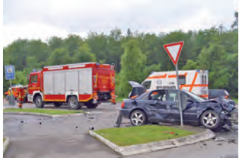
Beide Fahrzeuge sind Totalschäden.