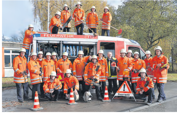
Glückliche Gesichter bei den Feuerwehrmännern, sie freuen sich über ein neues Fahrzeug.