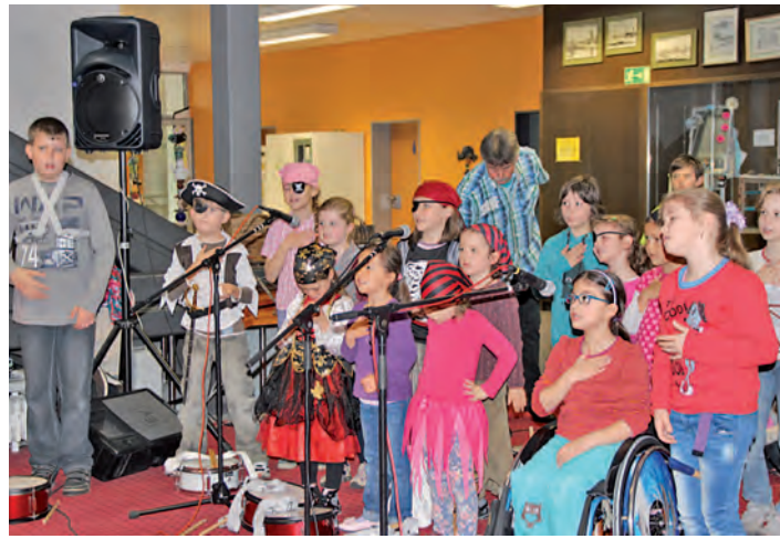
Gute Laune nach Noten verbreiteten die Schülerinnen und Schüler der Jugendmusikschule westlicher Hegau. sub-Bild: pr

sich um neue Regelungen im Abwasserbereich. Der Gemeinderat stellte sich mit dem Antrag für eine Anschlussgebühr bei künftigen Neubauten der Abstimmung und verlor diese mit 41 gegen 17 Stimmen. Eine Mehrheit fand die Regelung, dass bei künftigen Neubauten Dachwässer, wenn die in die Meteo-Abwasserleitung eingespeist werden, mit einer Gebühr belegt werden. Hier stimmten 45 mit Ja gegen 13 Nein. Die Regelung tritt rückwirkend zum 1. Januar 2013 in Kraft. 79 Stimmberechtigte waren gekommen.