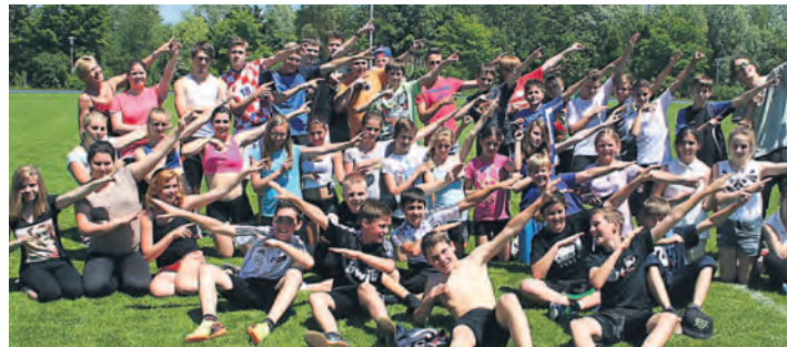
Mach mir den Bolt: Die Schüler aus Gottmadingen konnten gute Ergebnisse erzielen.

(Jahrgang 1996–99) konnten sehr gute Ergebnisse erreichen. Leider waren sie die einzige Mannschaft in dieser Altersklasse. Der Sprung ins Landesfinale ist auch hier sehr schwierig, sie können aber damit rechnen, dass sie unter den 15 besten Mannschaften des Landes rangieren. Die erfolgreichsten Punkte-