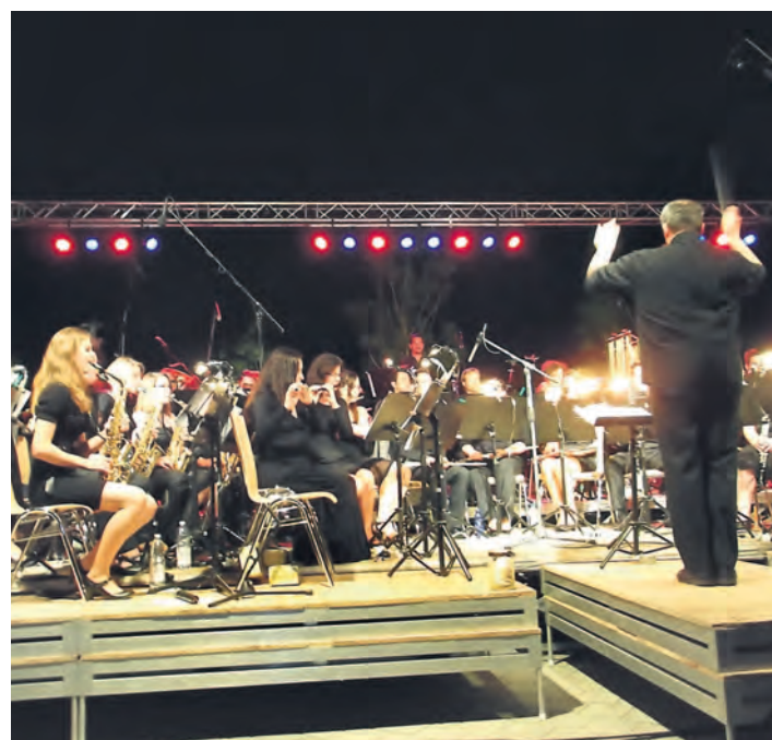
Für den zweiten Teil des Konzertes hatte sich die Stadtmusik ein Festtagsgewand angezogen. Später wurden im Publikum Wunderkerzen verteilt.

es ein wunderschöner Abend geworden. Weitere Veranstaltungen unter: www.stadtmusik-engen.de.