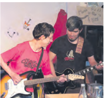
Musiker mit und ohne Handicap.

Die Glücksspirale unterstützt vielfältige gemeinnützige Organisationen und Projekte in Baden-Württemberg. Darunter auch die Heimsonderschule »Haus am Mühlebach«. Auch mit Hilfe dieser Förderung kann das Musikfestival »Sound am Bach«, das für und mit behinderten Jugendlichen gestaltet wird, ermöglicht werden. Junge Künstler mit und ohne Handicap treten dort in den unterschiedlichsten Musikrichtungen auf. Zum ersten Mal wird das Festival auf dem Schulgelände veranstaltet. Auf der Bühne werden neben den Rappern Assa und Alesko unter anderem die »Rainbow Band«, »Encanto« und »Make a Therapie« stehen. Doch auch Theater und Tanzvorführungen werden zu sehen sein.