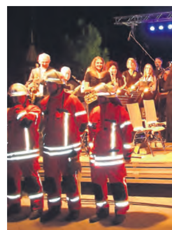
Bei »Backdraft« rauschte die Feuerwehr an.

von Johnny English, »Jurassic Park« und anderen Hits weiter. Das Musikstück »Backdraft« bildete den Abschluss und setzte der spektakulären Veranstaltung die Krone auf. Denn passend zum Film kam tatsächlich ein großes Feuerwehrauto mit Blaulicht und Martinshorn um die Ecke gefahren, dem Engener Feuerwehrmänner entstiegen und Wasserfontänen versprühten. Dank der vielen Helfer ist