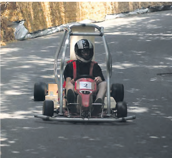
D'Gass ab: Das ist das Motto des Seifenkistenrennens in Bittelbrunn.