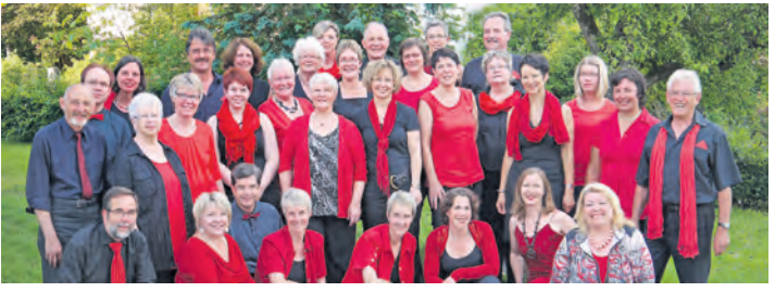
Alles dreht sich um die Liebe beim Remisekonzert des Belcanto-Chors aus Hilzingen.