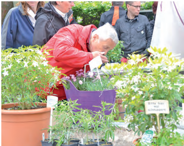
Eine Kostprobe: Beim diesjährigen Kräuter- und Genussmarkt am Samstag auf dem Untertorplatz war riechen, schmecken und probieren ausdrücklich erwünscht.

Wie »scharf« die Radolfzeller auf die Kraft aus der Natur sind, erkannte man schon am Vormittag. Zahlreich strömten die Kräuterfans auf den Untertorplatz, um sich Tipps fürs Mittagessen zu holen oder sich über beruhigende und heilende Wirkung der Kräuter zu informieren. Denn auf dem Kräuter- und Genussmarkt finden sich neben der klassischen Petersilie und Liebstöckel auch etliche Variationen wie Zitronenthymian und Thaibasilikum. Für ein weiteres Geschmackserlebnis sorgten die Küchenklassiker Minze, Basilikum und Petersilie. Neben den traditionellen Kräutern, die auf keinem Kräutermarkt fehlen dürfen, fanden Besucher aber auch Produkte aus Ziegengyros, Liköre, Tees und viele andere Köstlichkeiten aus den Gärten aus dem WOCHENBLATT-Land. Und diese Mischung aus Traditionellem