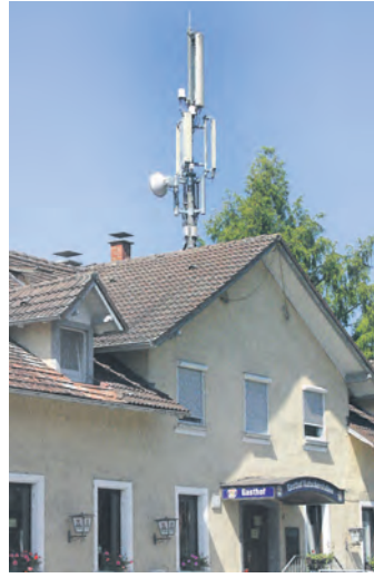
Die »BI« gibt in Sachen Mobilfunkmast in Markelfingen nicht auf. Derzeit steht eine Antenne auf der Gaststätte »Kutscherstuben«.

»Kommune und »BI« mussten erkennen, dass sie rechtlich einen sehr begrenzten Handlungsspielraum gegen das Auf-