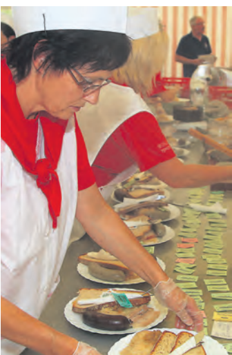
Nicht nur gute Musik, auch die Schlachtplatte und andere lukullische Genüsse lockten zum Herbstfest nach Honstetten.