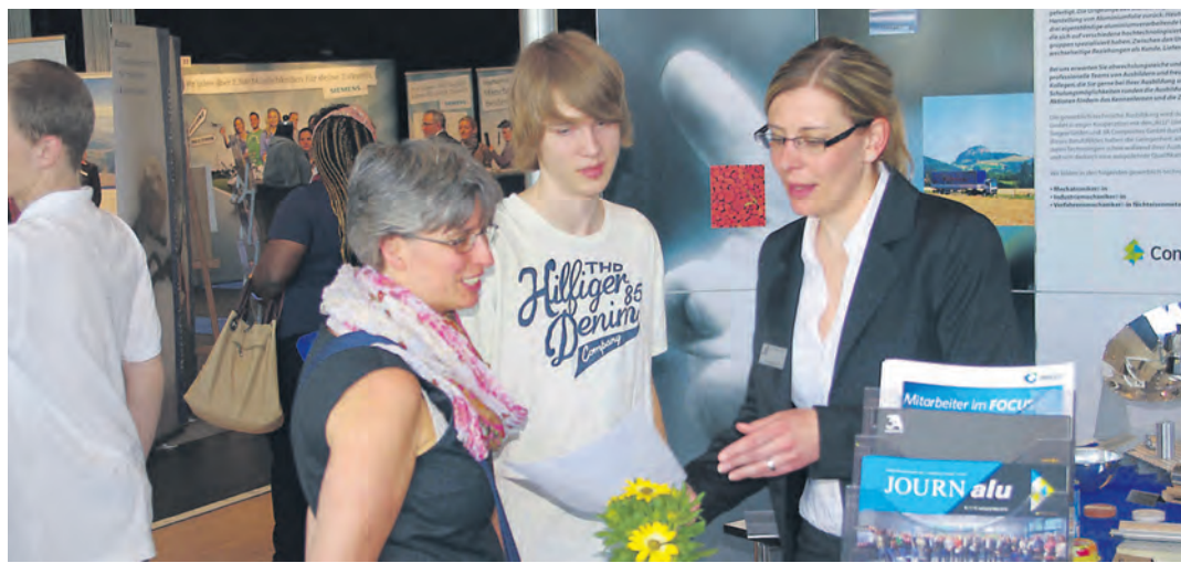
Die Weichenstellung in Richtung Berufsleben ist ein komplexer Prozess für alle Jugendlichen. Dabei werden Schülerinnen und Schülern viele Hilfestellungen gegeben, wie zum Beispiel Berufsmessen

Die Diskrepanz von Lehrstellenangebot und Nachfrage hat sich deutlich zu Gunsten der Auszubildenden verschoben. Dennoch bedeutet dies nicht zwangsläufig, dass jeder Jugendliche eine Lehrstelle annehmen kann und schon gar nicht in seinem Traumberuf. Besonders augenfällig zeigte sich dies bei der Lehrstellenbörse im Radolfzeller Milchwerk am 11. September. Die etwa 100 Jugendlichen, die gekommen waren, weil sie in diesem Jahr noch keine Ausbil-