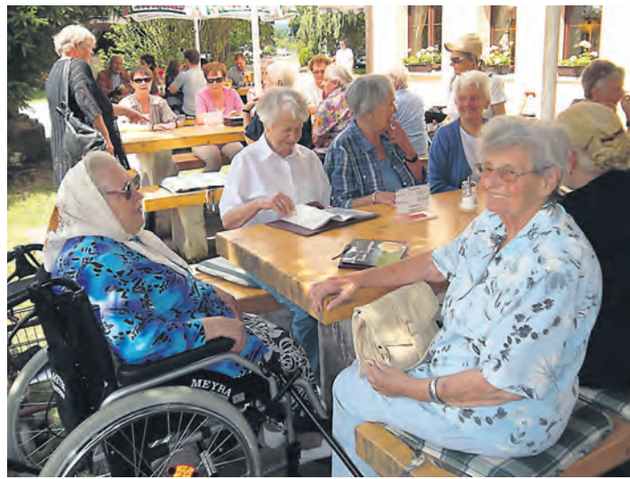
Schöne Stunden im Wild- und Freizeitpark Allensbach erlebte die Seniorengruppe »Lebensfreude« aus Böhringen.