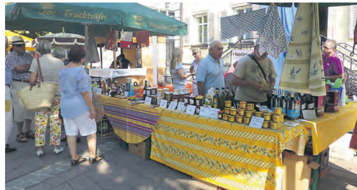
Auch beim diesjährigen Altstadtfest präsentierten die Gäste aus Istres ihre Köstlichkeiten aus der Heimat.

Französische Spezialitäten beim Altstadtfest