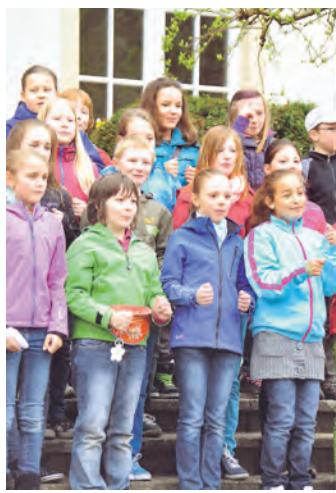
Die Kinder der Hebelschule hatten singend Spaß.