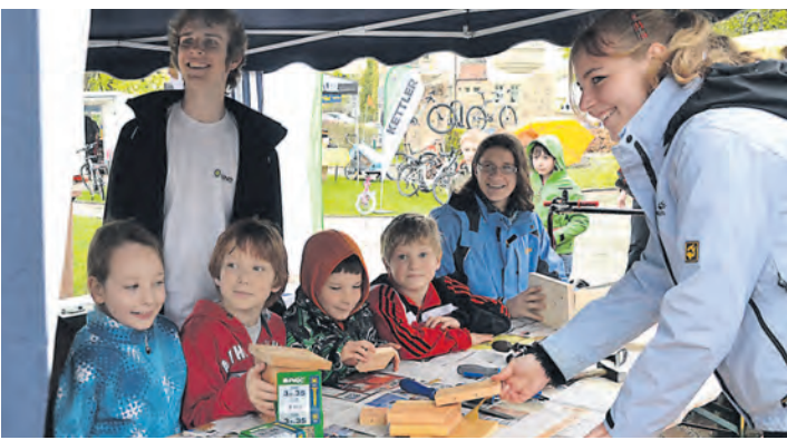
Nistkastenbau: Beim »BUND« konnten Kinder eine Heimat für die Vögel im Garten bauen.