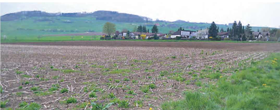
Ein weites Feld: Hier soll zum Schuljahr 2014/2015 der Neubau fertiggestellt sein.