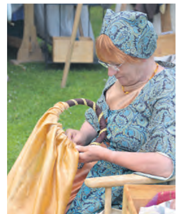
Mittelalterliche Nähkunst wird gezeigt.

Bardin« oder die Feuerspucker »Funkenflug« auf dem Gelände unterwegs. Abends finden Musik- oder Theaterveranstaltungen statt.