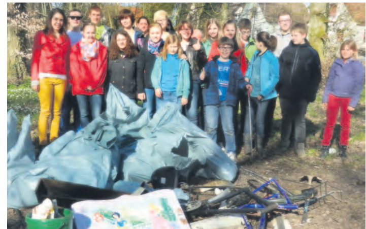
Der musikalische Nachwuchs des Musikverein Rielasingen-Arlen war fleißig und sammelte den Müll im Schnaidholz ein. Jetzt kann das Waldfest kommen.

sauberes Naherholungsgebiet ist und bleibt. Schon heute möchte der Verein zum diesjährigen Waldfest vom 14. Juni bis 17. Juni (Ausweichtermin ist eine Woche später) einladen.