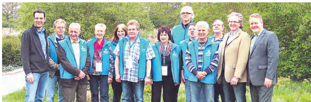
Manch einer hat die neuen Sicherheitsbotschafter schon selbst gesehen, nun wurde das Projekt am Dienstag durch OB Oliver Ehret und dem Leiter der Singener Kriminalprävention sowie die Förderer offiziell vorgestellt.

Neben den schon bestehenden Projekten wie den Busbegleitern, die überwiegend in den Stadtbussen unterwegs sind und den Nachtwanderern, die wiederum in den Abend- und Nachtstunden präsent sind, ist dieses Projekt ein Weiteres, um das subjektive Sicherheitsgefühl der Bürgerinnen und Bür-