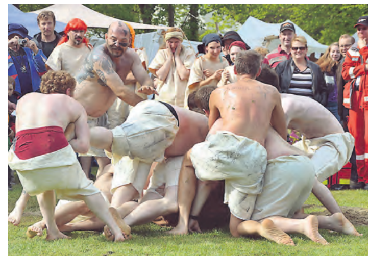
Wilde Männer beim Brucheball: Zwei Mannschaften kämpfen darum den Sack ins Tor zu bekommen.

In diesem Jahr soll es einige Neuerungen geben, um das Marktgeschehen lebendig zu halten. Doch auch altbekannte Teilnehmer werden ihre mittelalterlichen Zelte aufschlagen. Obwohl die Aussteller des Mittelalterfestes aus dem ganzen Bundesgebiet anreisen, haben sich in diesem Jahr fünf Engener und neun weitere Teilnehmer aus der näheren Umgebung angemeldet. Sie wollen an dem Wochenende getreu dem Veranstaltungsmotto »Geschichte machen«. Als besonderes Highlight soll es 2013 ein Ritterturnier für Kinder geben. Beim Schwertkampf und mit der Lanze können sich die Kinder an drei Tagen untereinander in mittelalterlichen Disziplinen messen. Auf Holzpferden reiten die Kinder zum Tjostieren in den Zweikampf. Ein Sagen umwobener »heilige Gral« wurde in diesem Jahr neu