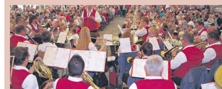
Mit seiner rustikalen Küche liegt das Herbstfest in Ehingen voll im Trend. Besonders an den Sonntagen ist zur Blasmusik der ganze Hegau zu Gast.

In Ehingen werden schon die Tage gezählt, denn am Freitag, 20. September, 20 Uhr, fällt mit dem Bieranstich der offizielle Startschuss für das große Schlachtfest mit Musik, das auch zu den großen Anlässen im Hegau zählt. Die »Hirschbuben« werden das Publikum an diesem Abend wohl erstmals auf den Tischen tanzen lassen, das inzwischen