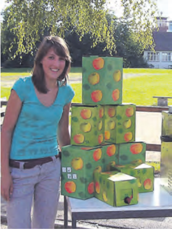
Eine Mitarbeiterin des BUND mit dem Pasteurisergerät und dem »Bag in Box System« zum bequemen Abfüllen des Apfelsafts.