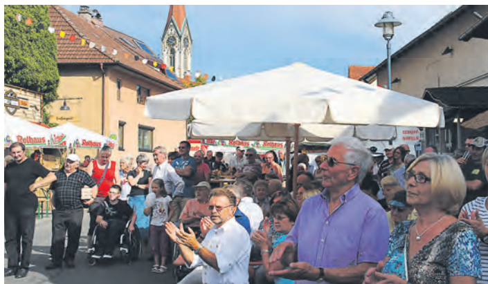
Das traditionelle Gailingener Dorffest ist mittlerweile weit über die Gemeindegrenzen hinaus für seine Kulinarik bekannt.

Gailingen (hz). Pünktlich um 16 Uhr eröffneten am Samstag, 7. September, drei Böllerschüsse am Hochrhein das traditionelle Gailingener Dorffest. Längst hat sich dieser Anlass im Veranstaltungskalender der Gemeinde fest etabliert und ist aus dem Gemeindeleben der Grenzkomune nicht mehr wegzudenken. Bereits zum 20. Mal jährte sich die Erfolgsgeschichte und das Fest ist weit über die eigene Gemarkung hinaus bekannt. Zur Feier organisierte das Dorffest-Komitee ein buntes und attraktives Rahmenprogramm mit Live-Musik für Jung und Alt und vielen Attraktionen insbesondere für Familien mit Kindern. So schlenderten tausende Besucher durch die Festmeile im Herzen der Gemeinde. Sie freuten sich über die Stände der Mitwirkenden, das Dargebotene auf den