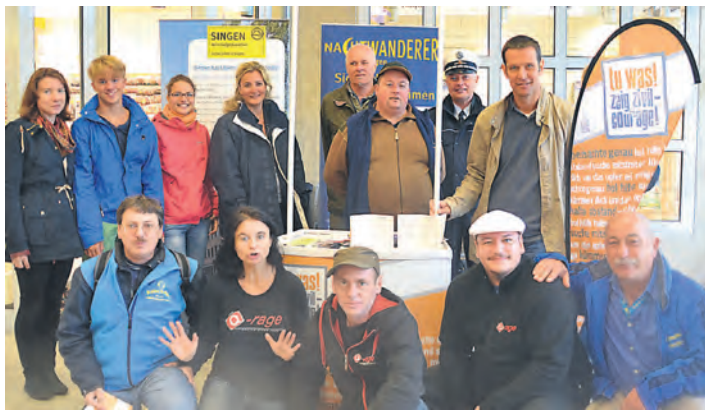
Zahlreiche Unterstützer hatte der Aktionstag in und vor dem Singener Bahnhof.