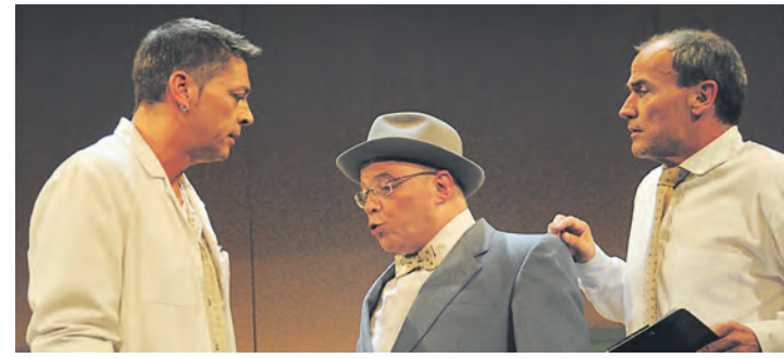
Der lebenswürdige und freundliche Mister Elwood P Dowd (m.) entwarf mit seinem unsichtbaren Freund Krankenpfleger Wilson (r.) und Stationsarzt Dr. Sanderson (l.).