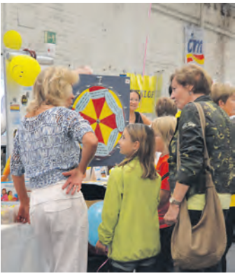
Liebevoll waren die Tische dekoriert.