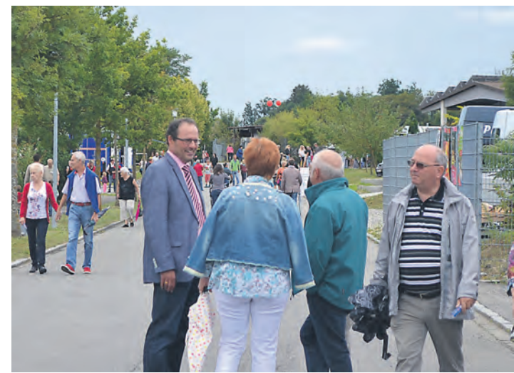
Bummeln und Spazieren: Während des Gewerbefests gab es einen verkaufsoffenen Sonntag.