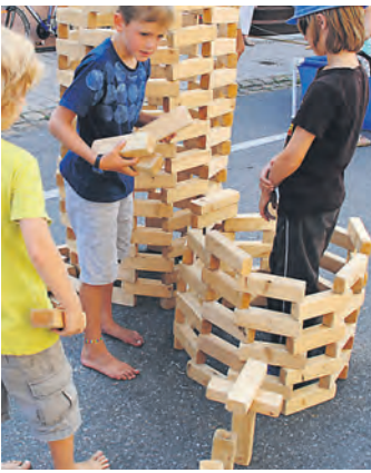
Ein Kinderspiel: Die kleinen Besucher wurden von den Vereinen gefordert.

Gailingen (hz). Pünktlich um 16 Uhr eröffneten am Samstag, 7. September, drei Böllerschüsse am Hochrhein das traditionelle Gailingener Dorffest. Längst hat sich dieser Anlass im Veranstaltungskalender der Gemeinde fest etabliert und ist aus dem Gemeindeleben der Grenzkomune nicht mehr wegzudenken. Bereits zum 20. Mal jährte sich die Erfolgsgeschichte und das Fest ist weit über die eigene Gemarkung hinaus bekannt. Zur Feier organisierte das Dorffest-Komitee ein buntes und attraktives Rahmenprogramm mit Live-Musik für Jung und Alt und vielen Attraktionen insbesondere für Familien mit Kindern. So schlenderten tausende Besucher durch die Festmeile im Herzen der Gemeinde. Sie freuten sich über die Stände der Mitwirkenden, das Dargebotene auf den