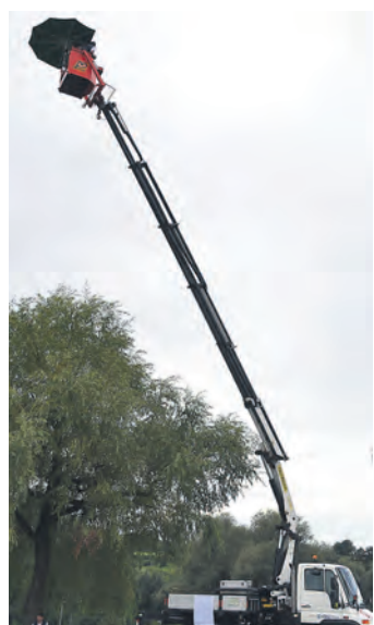
Weitsicht gab es aus dem Hubarbeitskorb der Stadtwerke.