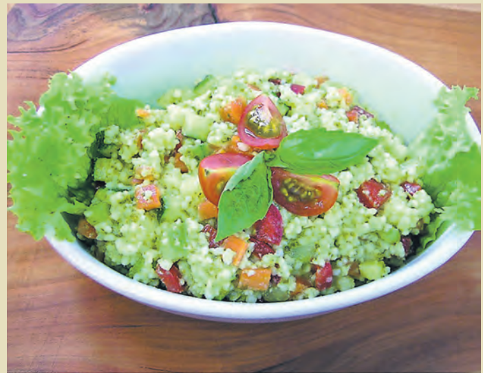
Gericht: Neben den Produkten werden auf der Seite www.feines-aus-dem-hegau.de regelmäßig Rezepte veröffentlicht.