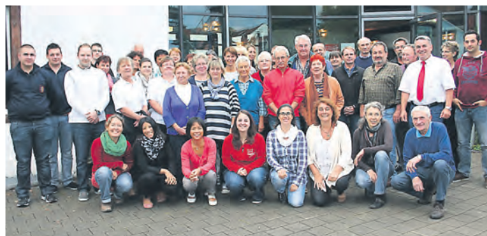
Für die vielen Helfer des 23. Rielasinger Ferienprogramms gab es ein schönes Abschlussfest im Kulturpunkt Arlen.

Rielasingen-Worblingen (swb/of). Auch nach dem diesjährigen erfolgreich durchgeführten Sommerferienprogramm der Gemeinde, welches zum 23. Mal stattgefunden hat, sind alle Veranstalter zu einem Abschlusstreffen inklusive Imbiss in den Kulturpunkt-Arlen eingeladen worden. Dies galt als Dankeschön der Gemeindeverwaltung für das Engagement aller Vereine, Verbände, Gewerbetreibenden und Privatpersonen für die schönen und auch lehrreichen Freizeitangebote. Alle Kinder, Jugendlichen und auch die teilnehmenden Eltern hatten viel Freude an den Angeboten. Wieder einmal dauerte das Ferienprogramm die gesamten sechs Ferienwochen. Es gab 72 Programmpunkte und