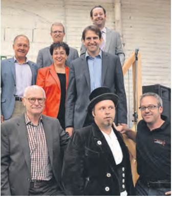
Auch die Politprominenz war zu Gast.