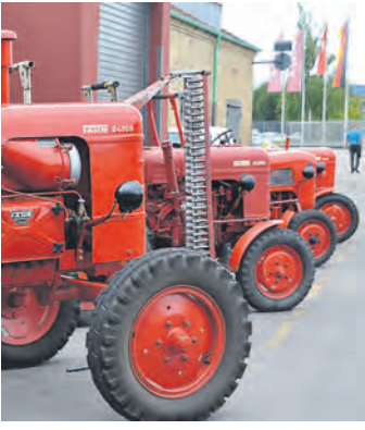
Die Fahr-Oldtimer kamen zum Ursprung zurück