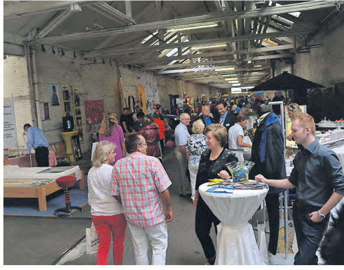
Zahlreiche Gäste kamen in den Schmiedegang auf dem ehemaligen Fabrikgelände.

Bereits zur offiziellen Eröffnung der Messe schoben sich zahlreiche Besucher durch den Gang, lauschten der Fröhschoppen-Musik oder beteiligten sich an den dargebotenen Attraktionen.