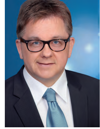
Landtagspräsident Guido Wolf kommt auf Einladung von Bundestagskandidat Andreas Jung zu einem Diskussionsabend ins »Narrizella«-Zunfthaus nach Radolfzell.

Die Bambinis werden um 16.15 Uhr auf die Laufstrecke gelassen. Die jüngsten Teilnehmer müssen dabei eine Strecke von 400 Metern zurücklegen. Diese Entfernung gleich dreimal zurücklegen müssen die Schüler, die beim Grundschullauf um 16.30 Uhr starten. Als absolutes Highlight wird auch in diesem Jahr der Elitelauf gehandelt. Der unter Hochspannung erwartete Elitelauf startet um 17.15 Uhr vor dem Hauptlauf. Hierzu werden Spitzensportler eingeladen. Die Firmenteamts inklusive den Schülerteams starten dann im Anschluss an den Elitelauf um 18.15 Uhr. Mehr Infos gibt es unter www.bodensee-firmenlauf.de . Nachmeldungen sind bis 90 Minuten vor dem jeweiligen Lauf möglich.