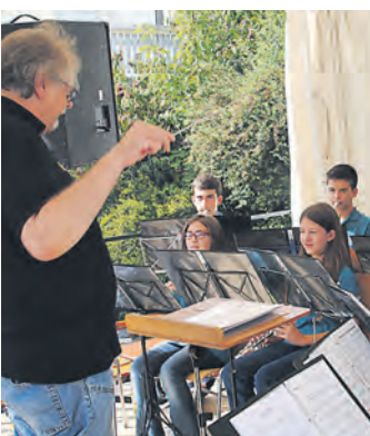
Musikalische Unterhaltung gab es auf der Bühne.