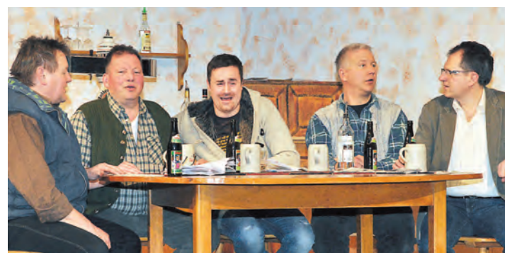
Die Theatergruppe Mühligen zeigt zweimal an Ostern das Stück »Der Cäsar und die BeautyFarm«.