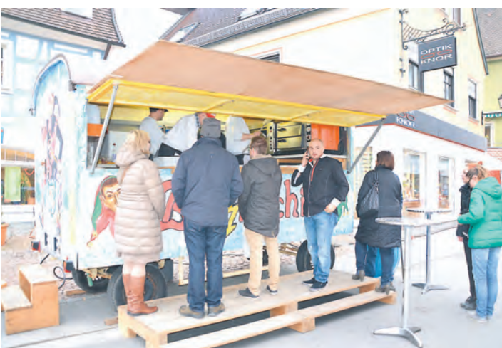
Ein Klassiker, bei dem Genießern das Wasser im Munde zusammenläuft - die Dünnele der Laufnarren.