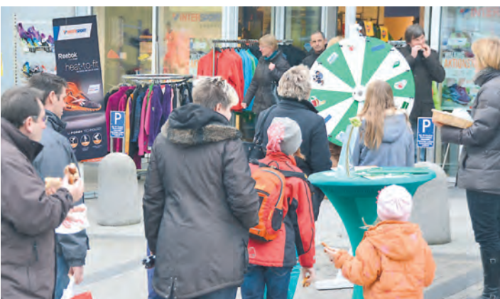
Mancher versuchte sein Glück beim Glücksrad.