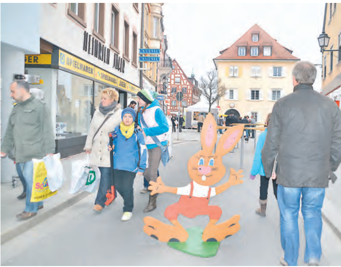
Geschäfte in Ober- und Unterstadt sowie in Stockachs Außenbezirken luden zum Besuch des verkaufsoffenen Sonntags ein. Von 13 bis 18 Uhr standen die Ladentüren offen.