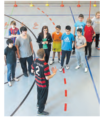
Spieler des SV Freiburg waren im Dienst des Netzwerks »B.Free« am Freitag bei den Suchtpräventionstagen in der Radolfzeller Teggingerschule.