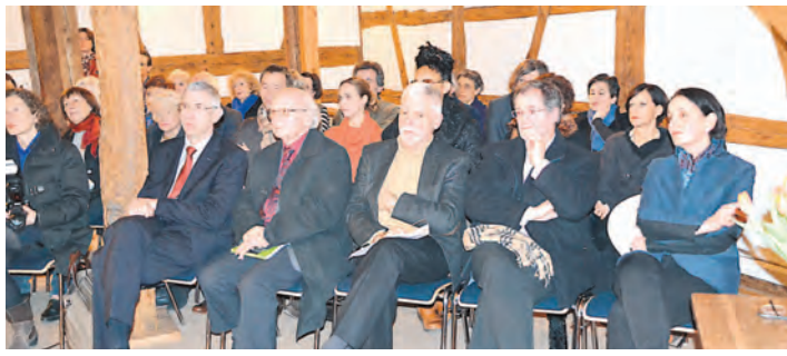
Beinahe aus allen Nähten platzte das Hermann-Hesse-Höri-Museum zum Saisonauftakt 2013. Seit Freitag ist die Ausstellung »Wettlauf mit dem Schatten. Der Fall des Dichters Wilhelm von Scholz« zu sehen.