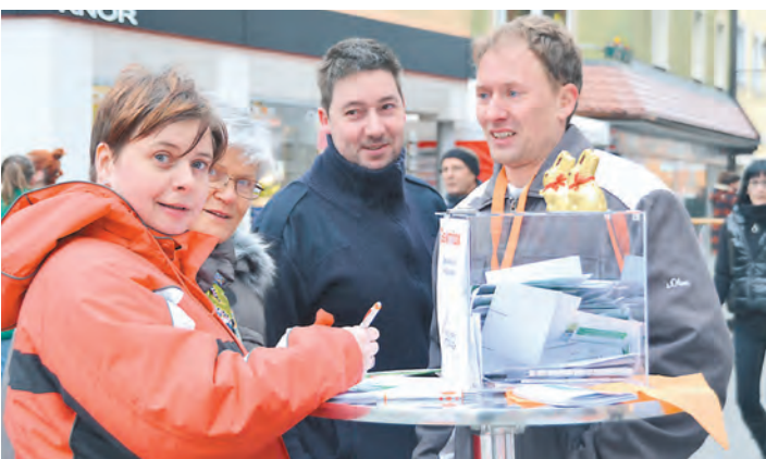
Auch die Stadtwerke waren beim verkaufsoffenen Sonntag dabei.