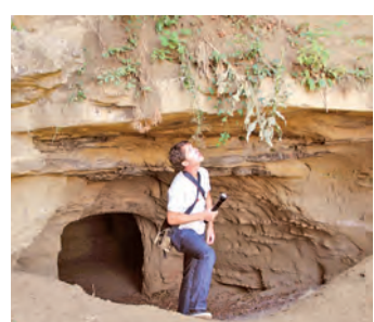
Die Heidenhöhlen sind ein beliebtes Wanderziel. Sie sind nun wieder komplett zugänglich, nachdem die Fledermäuse ihren Winterschlaf beendet haben.

Stockach (swb). Fledermäuse haben sich die Zizenhausener Heidenhöhlen als Winterquartier ausgesucht. Um einen ungestörten Winterschlaf für die geschützten Tiere zu sichern, wurde im Oktober der Eingang zu den Höhlen durch Gitter versperrt. Mit dem Ende des langen Winters sind die Fledermäuse nun aus ihren Quartieren ausgezogen und die Höhlen sind wieder frei zugänglich. Die Tourist-Info im Kulturzentrum bietet in einer neuen Wanderbroschüre eine Wanderroute unter anderem zu den Heidenhöhlen an. Die Broschüre mit Wegbe-