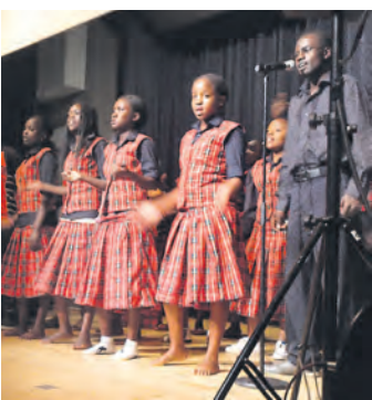
»Sounds of Hope« begeisterte in Stockach.