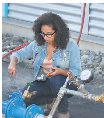
Technisch so fit wie Jungs: Mädchen am Girls Day.

Stockach (swb). 19 junge Mädchen der 6. bis 8. Klasse besuchten die Stadtwerke Stockach und informierten sich über Berufe, die sonst eher Jungs interessieren. Anlass war die bundesweite Aktion »Girl's Day - Mädchen-Zukunftstag«, an dem sich die Stadtwerke Stockach bereits zum vierten Mal beteiligt haben. Dass Mädchen technisch ebenso fit sind wie Jungs, stellten die Schülerinnen in der Praxis klar. Sie zeigten ihr Können beim Schweißen von Wasserrohren ebenso wie beim Verdrahten von Stromleitungen.