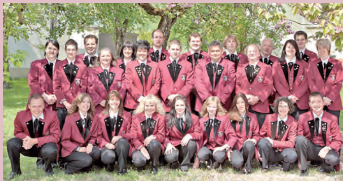
Herzlich willkommen heißt der Musikverein Heudorf seine Gäste zum traditionellen Maifest.

Los geht's am Feiertag Christi Himmelfahrt mit dem Vatertags-treffen, einem beliebten Ziel für Wanderer und Spaziergänger. Ab 11 Uhr geben dort Musikvereine aus Hausen ob Verena, Schwenningen/Heuberg und Emmingen den Ton an und sorgen für beste Stimmung. Rockig geht es am Freitag, 10. Mai weiter, wenn die Partyband »Edelrock« bei der heißen Partynacht