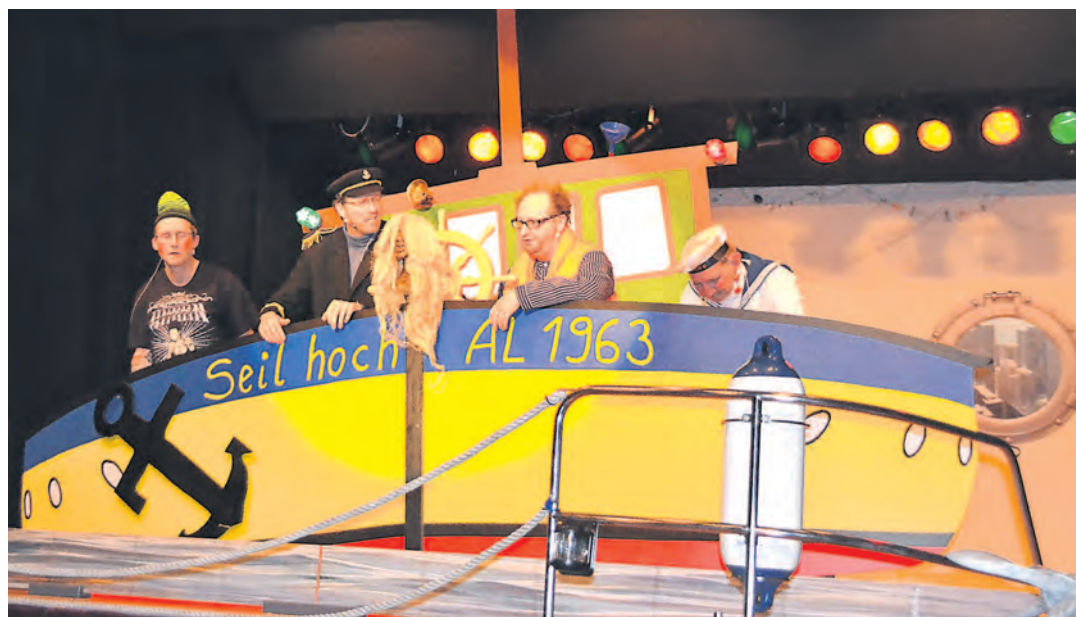
Erste Klasse: Die Laufnarren ließen einige flüssige Bemerkungen vom Stapel.

»Nellenburg-Gymnasium« bei beiden Veranstaltungen vertreten gewesen. Die jüngeren Schüler der Jahrgänge 2002 und 2003 belegten beim Bezirksentscheid den ersten Platz.