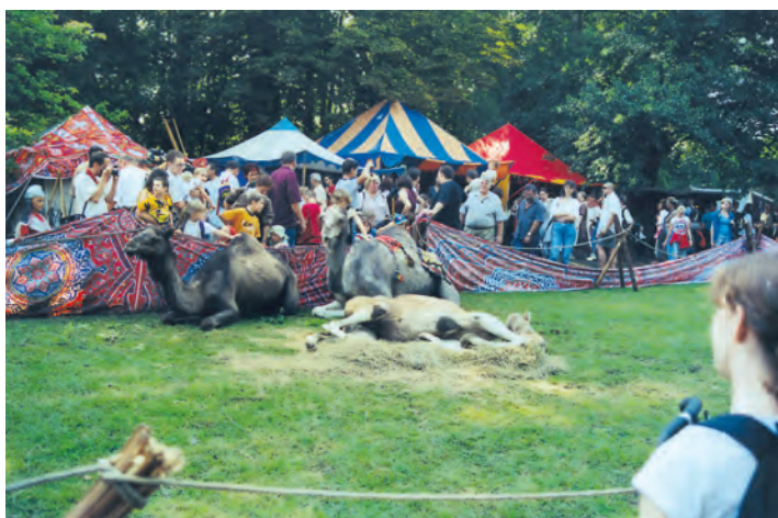
Eigeltingen feiert sein 1.250-jähriges Bestehen: Das ganze Jahr über wird zum Gemeindejubiläum viel geboten. Höhepunkt ist das Festwochenende am 28. und 29. Juni mit einem Mittelaltermarkt und vielen anderen Attraktionen.