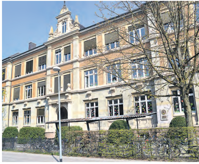
Könnte frühestens im Schuljahr 2016/17 eine Gemeinschaftsschule werden: die Teggingerschule in Radolfzell.