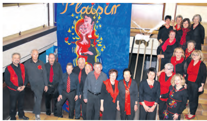
Unter dem Motto »Plaisir d'Amour« präsentiert sich der Eintracht-Chor unter neuer Leitung.

Weitere Mitwirkende beim Konzertabend sind das jugendliche Gesangsduo »the simple us« mit drei Eigenkompositionen, sowie der Interpretation bekannter Welthits. Einen unterhaltsamen Auftritt haben auch die »Danzknöpf«, die Kindertrachtentanzgruppe des