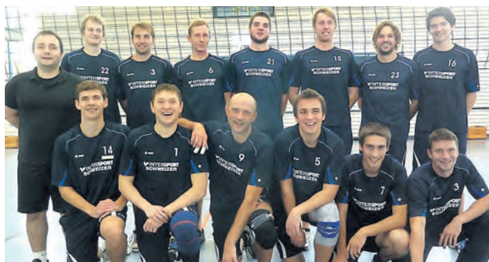
Die Unterseevolleys aus Radolfzell steigen nach einer hervorragenden Saison in die Oberliga auf.

Radolfzeller Volleyballer krönen hervorragende Saison