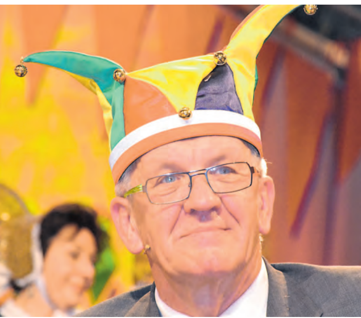
Ministerpräsident Winfried Kretschmann lässt es sich nicht nehmen, zum Schweizer Feiertag am 27. Juni nach Stockach zu kommen, um seine Weinschuld zu übergeben und den Fassanstich im Festzelt vorzunehmen.