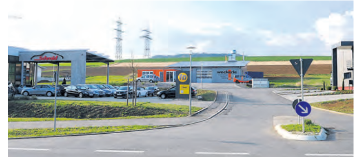
Offene Türen im Watterdinger Gewerbegebiet.

nen Harleys und US-Car Oldtimer bewundert werden, feine Drinks werden in einem typischen Londoner Doppeldecker-Bus serviert und Kinder können ihre eigenen T-Shirts gestalten. Fürs Wohl der Gäste sorgt die SG Tengen-Watterdingen. Den Reigen schließt das Bauunternehmen Peter Wesle mit einem zünftigen Frühshoppen und dem Musikverein Zimmerholz ab 11.30 Uhr; bereits ab 10 Uhr kümmert sich der Musikverein Watterdingen um das Wohl der Besucher. Als besondere Attraktion fliegen Air-Emotions