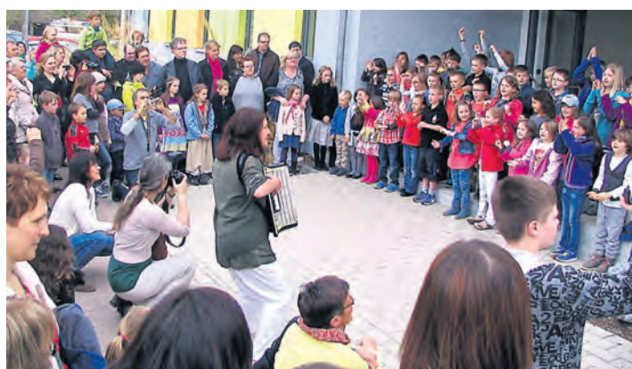
Viel Andrang herrschte am Samstag beim Schulfest in Eigeltingen.

im Foyer in grandioser Vielfalt ihre schulischen Betätigungen. Das Programm führt über Vorführungen und Präsentationen zu Mitmachangeboten über Einblicke in die Lernräume hin zu Ausstellungen. 27 Punkte stehen auf dem Programm, viele finden zeitgleich statt und diese gewaltige Vielfalt fordert den Besuchern ein ordentliches Zeitmanagement ab. Singen, Tanzen, Musizieren, Theater spielen, Basketballturnier, Krafttraining, Essen und Trinken, Technik bestaunen, Kunstwerke aus Keramik, aus Pappe, farbenfrohe Bilder nach Hundertwasser, Design bestaunen, Schminken, Werkeln, Bewegen oder bei der Produktion