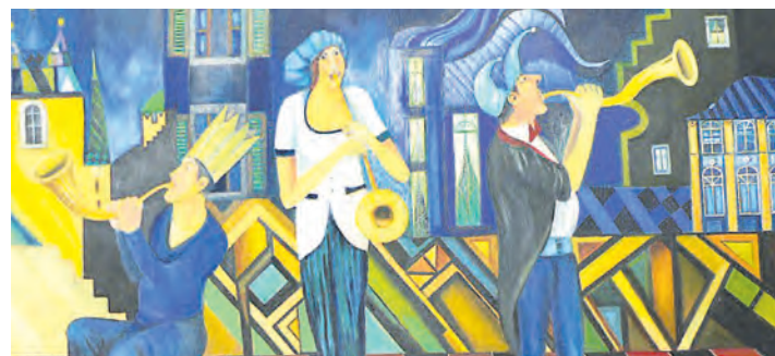
Humor, Gesellschaftskritik und Seelenlandschaften paaren sich bei Boleslav Kvapil zu sensiblen Kunstwerken.

Stockach (swb). Bärlauchpesto, Waldmeisteregelee und Kräuterbowl. Auf einem Wildkräuterspaziergang am Samstag, 12. April ab 15 Uhr mit dem UmweltZentrum Stockach und der VHS gibt es Infos zu Pflanzen der Region und deren Verwertungsmöglichkeiten, eine Verköstigung von aus Wildkräutern zubereiteten Delikatessen und jede Menge Rezepte hierzu. Anmeldung zu dem Wildkräuterspaziergang beim UmweltZentrum Stockach unter 07771/4999 oder info@uz-stockach.de.