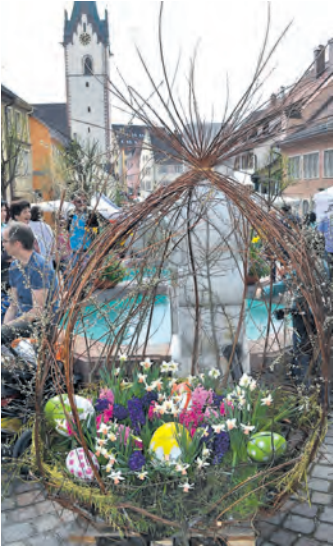
Auch die Engener Brunnen waren österlich geschmückt.