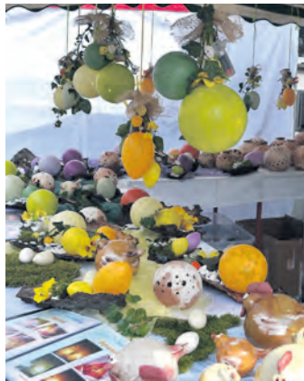
Osterdekoration in allen Varianten gab es zu bewundern.