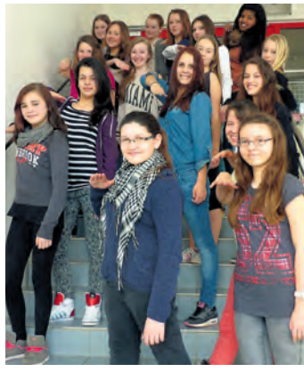
Die Schülergruppe des Tanztheaterprojektes der Realschule Stockach hoffen auf viele Besucher bei der Premiere von »Ich 2.0«.