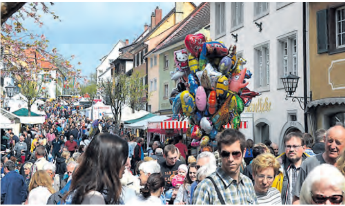
Dicht gedrängt bummelten die Besucher über den Ostermarkt mit seinem bunten Angebot.