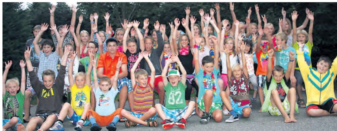
Viel Spaß hatten die Teilnehmer bei der Kinderfreizeit 2013. In diesem Jahr fährt der KLJB-Nenzingen mit den Kindern in den Schwarzwald.

»Raithaslach«: So., 10.15 Uhr hl. Messe mit Palmweihe.