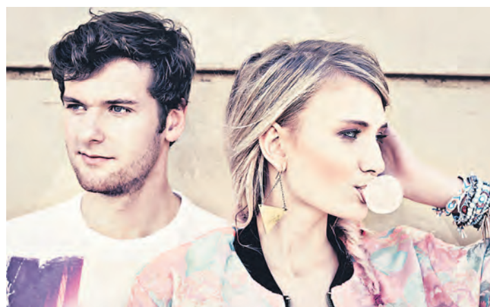
Erstmals beim Schweizer Feiertag mit dabei - Glasperlenspiel.