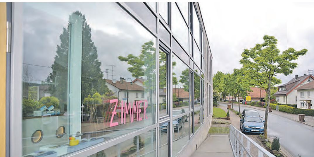
Edel, einladend, freundlich - das Hotel »Anker« in Bodman.