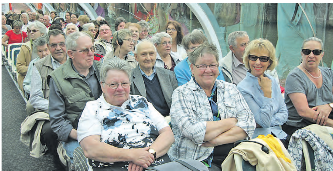
Das Elsass war das Ziel eines Tagesausflugs des VdK-Ortsgruppen Stockach und Eigeltingen.