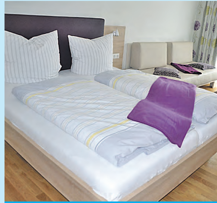
Ein gehobener Komfort zeichnet die Zimmer im Hotel »Anker« aus.

Das Hotel »Anker« ist nach seinem Umbau kein Gastronomiebetrieb mehr, dennoch werden Hotelgäste kulinarisch verwöhnt. Ein reichhaltiges Frühstücksbuffet und auf Wunsch abends ein eingeschränkter gastronomischer Service gehören zum Angebot. Doch auch wer kein Hotelgast ist, kann im »Anker« vorbeischaun. Während der Öffnungszeiten der Rezeption wird im Loungebereich ein eingeschränkter Gastrobetrieb mit Getränken und Snacks angeboten.