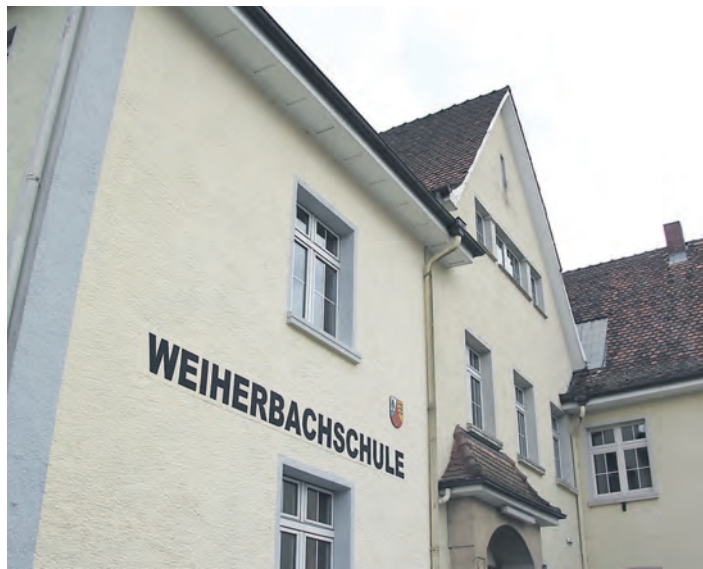
Die Weiherbachschule möchte zur Gemeinschaftsschule werden.

In Mühlingen hat sich eine Lobby zugunsten der Gemeinschaftsschule gebildet. Unter der Überschrift »Unsere Schule soll im Dorf bleiben« setzt sich eine Gruppe aus Eltern und engagierten Bürgern für die Schaffung dieses Schultyps ein, zu denen auch Doris Eichkorn gehört. Sie führt verschiedene Argumente ins Feld: Eine Gemeinschaftsschule stehe bei den Eltern hoch im Kurs, das würden die hohen Anmeldezahlen in Eigeltingen und Steißlingen beweisen. Durch die Schaffung dieses Schultyps könnten die Schülerzahlen gesteigert und damit der Erhalt der Weiherbachschule gesichert werden. Das sei wichtig, denn