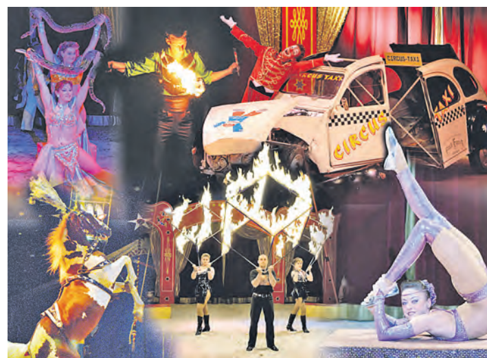
Ein buntes Programm-Feuerwerk möchte der »Circus Montana« bieten, der von Freitag, 15., bis Sonntag, 17. August, in Stockach gastiert.