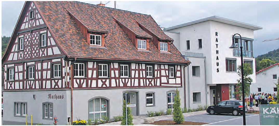
Im erweiterten Rathaus von Eigeltingen wurden verschiedene Entscheidungen getroffen.

Orsingen-Nenzingen (sw). Zusätzliche Informationen in Bezug auf den möglichen Bau einer Biogasanlage in Orsingen-Nenzingen möchte Gemeinderat Roland Riegger (CDU) haben. Wie er in der jüngsten Sitzung des Gremiums von Orsingen-Nenzingen anmerkte, solle das Thema in der nächsten Sitzung am Dienstag, 16. September, nach der Sommerpause auf der Tagesordnung stehen, und er könne nur dann eine Entscheidung treffen, wenn er über Dinge wie Flächenbedarf, Auswirkung auf die anderen Landwirte oder Verkehrsfluss aufgeklärt werden würde. Würden diese Informationen fehlen, würde er eine Vertagung beantragen. Das sei ihm schon klar, erwiderte Bürgermeister Bernhard Volk. Daher arbeite die Verwaltung gerade an einem Vorentwurf. Dafür seien aber noch einige Dinge zu klären. Darum sei der Punkt »Biogasanlage« auch nicht in der Sitzung vor der Sommerpause aufgerufen worden.