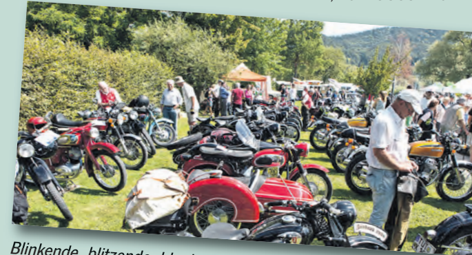
Blinkende, blitzende, blank geputzte Oldtimer auf zwei, drei und vier Rädern treffen sich in Ludwigshafen zum knatternden Rendez-vous.

An beiden Tagen: Ausstellung, Bestaunen und Begutachten der Fahrzeuge, Flanieren und Genießen in den Uferanlagen, jede Menge »Benzingespräche«.