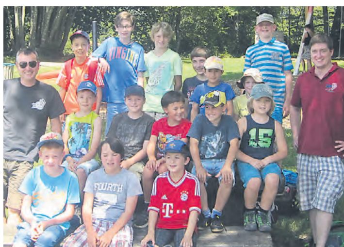
Die »Junghänsele« erlebten einen spannenden Tag auf dem Walderlebnispfad in Kolbingen.