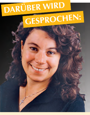
DARÜBER WIRD GESPROCHEN:

Seelenkenntnis Ach, was sind wir doch für kleine, kluge Hobby-Psychologen! Neulich an der Supermarkt-Kasse, da kamen diese Fähigkeiten mal wieder voll zum Tragen. Die Frau vorne in der Schlange, die Unmengen von Katzenfutter und ein Fertiggericht auf das Fließband gelegt hat, die ist eine Single-Frau – enttäuscht von Männern, ganz der Karriere verschrieben. Ach ja, und der Herr da. Der lässt es gerne krachen. Sekt, Wein und Prosecco-Flaschen in Unmengen. Schmeißt wohl gern eine Party. Oder zwei. Oder drei. Und da ist ja wieder so einer, der den Wagen bis oben hin voll beladen hat. XXL-Shopping. Typisch Familienvater mit zahlreicher Kinderschar. Ja, zeige mir deinen Einkauf, und ich sage dir, wer du bist. Man muss sich nur auskennen in der Welt. Plötzlich ein Schrei: »Mami!«. Vier Kinder und ein Ehemann laufen auf die Single-Frau zu. War wohl daneben. Draußen auf dem Parkplatz die nächste Enttäuschung. Der Party-Mann steigt in ein Auto ein, das die Aufschrift einer Gaststätte trägt. Von wegen feiern. Der muss arbeiten. Und der Mann mit der Mega-Familie zwängt sich in einen Single-Smart. Ja. Gut. Okay. Lassen wir das mit der Hobby-Psychologie lieber. Simone Weiß s.weiss@wochenblatt.net