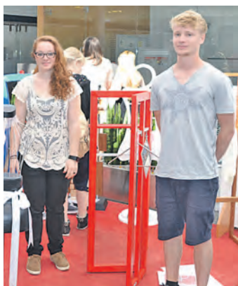
Die erfolgreichen Absolventen des zweijährigen Berufskollegs für Produktdesign am BSZ präsentierten jüngst ihre Abschlussarbeiten in der Sparkasse in Radolfzell.

Radolfzell (gü). »Stumme Diener« im Schalterraum: In der Zweigstelle der Sparkasse Singen-Radolfzell in der Hörstraße präsentierten jüngst die erfolgreichen Absolventen des zweijährigen Berufskollegs für Produktdesign am Berufsschulzentrum Radolfzell ihre Abschlussarbeiten. Und dass die jungen Nachwuchs-Designer, die sich nach bestandener Prüfung staatlich geprüfte Assistenten für Produktdesign nennen dürfen und ihre Fachhochschulreife in der Tasche haben, kreative Köpfe sind, bewiesen sie eindrucksvoll in ihren Werkstücken: Neben der praktischen Funktion, einem Platz für Hose, Hemd, Bluse, Krawatte und Co. mussten die Arbeiten ästhetisch wirkungsvoll sein, Originalität besitzen und aus mindestens 80 Prozent Holzanteile bestehen. Angeleitet wurden die Jugendlichen im gestalterischen Bereich von der Architektin Claudia Auer und bei der Realisierung von Schreinermeister Karl-Heinz Bruggner. »Das Projekt wurde anfangs von den Schülern mit