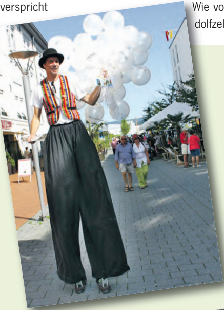
Am Samstag, 6. September, lockt das Altstadtfest von 9 bis 22 Uhr wieder in die Radolfzeller Innenstadt. Egal ob Groß...