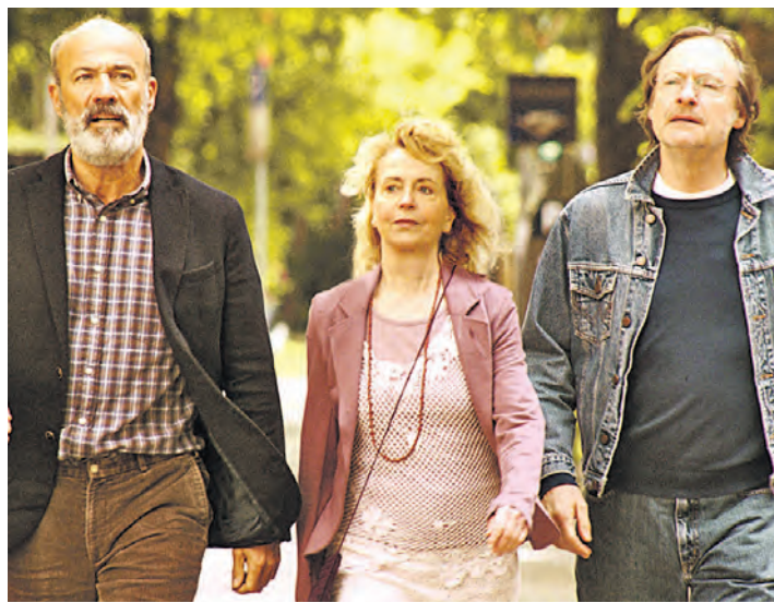
Studenten von damals treffen auf Studenten von heute: Wer ist bei wohl spießiger? In »Wir sind die Neuen« wird das geklärt.

Stockach (swb). Sie sind wieder unterwegs: Die Wandergruppe des TV Jahn Zizenhausen ist bei dem IVV-Wandertag in Titi-see-Neustadt am Sonntag, 14. September, mit dabei. Startzeiten sind von 8 bis 12 Uhr.