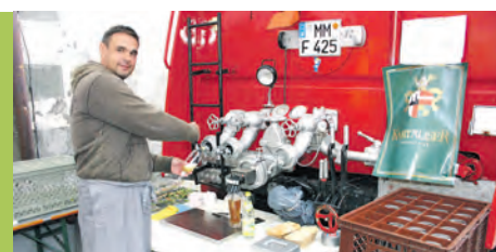
MI., 3. SEPTEMBER 2014

BUNTES PROGRAMM AM 6. SEPTEMBER VON 9.00 BIS 22.00 UHR