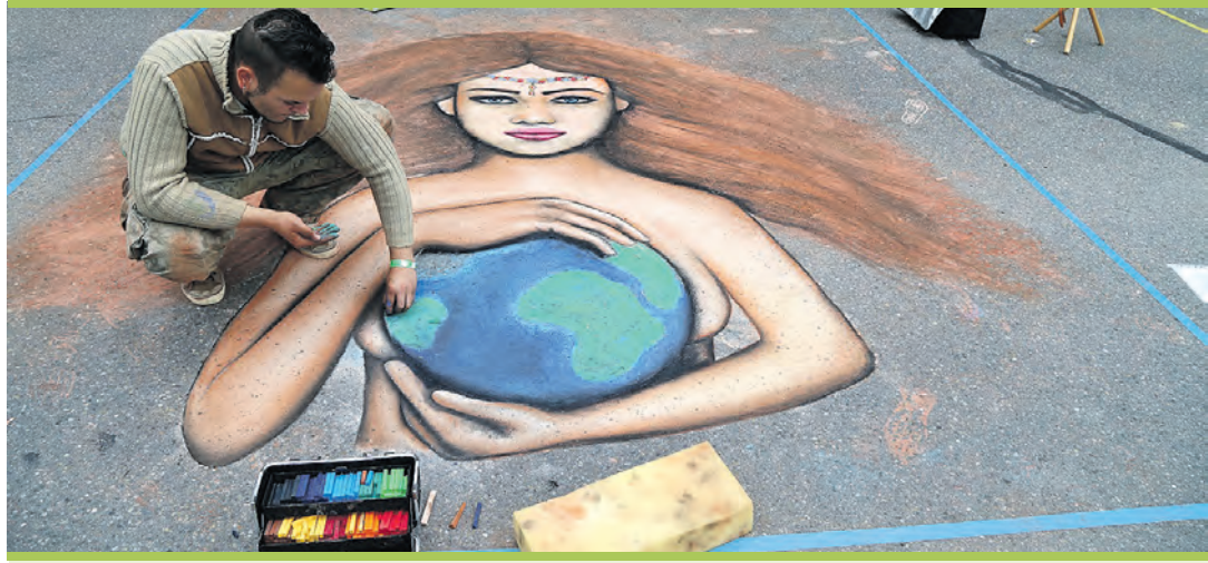
Vom Straßenkünstler, über den Tänzer, bis hin zum Puppenspieler - auf der »Bunten Kunstmeile« ist für jeden das Passende dabei.