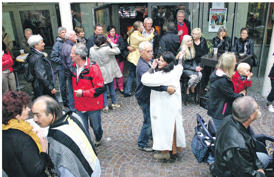
Ausgelassene Stimmung - das Radolfzeller Altstadtfest lockt traditionell jede Menge Besucher in die City. Neben dem Altstadtflair besticht das Fest vor allem durch sein abwechslungsreiches Programm.

wird, entwickelte sich in den vergangenen Jahren als Publikumsmagnet. Wie die Radolfzeller Stadtverwaltung per Presseerklärung verlauten ließ, kommt es im Zuge des Altstadtfestes zu kleineren Verschiebungen im städtischen Veranstaltungskalender: So wird wegen dem Altstadtfest der Wochenmarkt auf Freitag, 5. September vorverlegt und findet wie gewohnt auf dem Marktplatz statt. Marktbeginn ist dann um 7 Uhr. Alle Informationen zum Programm des Altstadtfestes erhalten Interessierte auf der Homepage der Tourismus- und Stadtmarketing Radolfzell GmbH unter www.radolfzell-tourismus.de/altstadtfest .