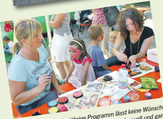
...oder Klein, das diesjährige Programm lässt keine Wünsche offen. So kommen auch die jüngsten Besucher voll und ganz auf ihre Kosten.