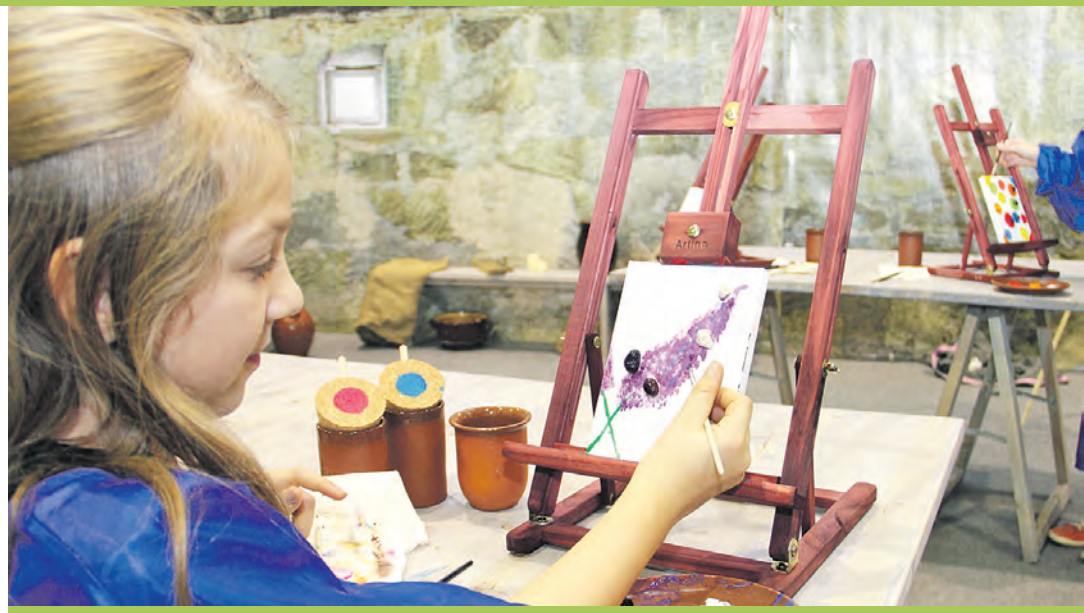
Kunstvoll wird es bei der in diesem Jahr zum ersten Mal stattfindenden »Bunten Kunstmeile« in der Teggingerstraße. Kunstinteressierte können den Künstlern dabei über die Schulter schauen, aber auch selbst kreativ werden.

keting GmbH zu erfahren war, können Besucher den Künstlern der »Bunten Kunstmeile« nicht nur beim Entstehen ihrer Arbeiten über die Schulter schauen, sondern auch selbst an der Graffitiwand experimentieren. Dabei werden sie von den teilnehmenden Berufsmalern, Straßenmalern, Graffitikünstlern sowie von internationalen und regionalen Straßenkünstlern unterstützt. Außerdem werden auch Straßenkünstler über das »Show Up!« Programm angelockt, das erst vor Ort zusammengestellt wird. Hier können am Veranstaltungstag Straßenmusiker, Tänzer, Theater, Feuershows, Zauberer, Puppenspieler und Comedians spontan das Publikum unterhalten. Alle Künstler kommen auf eigene Faust und präsentieren individuelle Shows. Die Akteure finanzieren sich ausschließlich über das »Hutgeld«. Am »Flohmarkt von Kindern für Kinder«, der traditionell vom Familienverband Radolfzell organisiert wird, dürfen auch dieses Jahr wieder Kinder aus Radolfzell und den Ortsteilen teilnehmen, um so ihr Taschengeld ein wenig aufzubessern. Interessierte können sich dazu ab sofort bei den Hauptgeschäftsstellen der Sparkasse Singen-Radolfzell und der Volksbank in Radolfzell anmelden. Weitere Informationen gibt es zudem per Mail an familienverband.radolfzell@web.de.