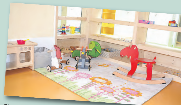
Die neue Kinderkrippe »Alte Ziegelei« in Rickelshausen lädt mit viel Platz zum Toben ein.