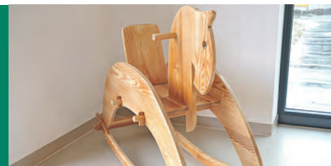
MI., 17. SEPTEMBER 2014

völkerung offen sein. Für die Kinder gibt einen Gruppenspielraum, ein »Atelier«, einen Schlafraum, eine Küche und einen Spielflur. Des Weiteren stehen ihnen eine überdachte Veranda sowie ein Gartengelände zum Spielen zur Verfügung. Auf dem Gelände des Kinderbauernhofes haben die Krippenkinder ein eigenes kleines Gelände mit überdachter Vespemöglichkeit und einem Ausguck zur Vogelbeobachtung ins Aachried. Es wird täglich durch einen kleinen Fußmarsch oder mittels einer Fahrt im Bollerwagen erreicht. Auf dem Kinderbauernhof können die dort lebenden Tiere – drei Ponys, sieben Ziegen, viele Hühner – bestaunt, gestreichelt und gefüttert werden. Die Küche des Kinderbauernhofes kann täglich frisch gekochtes Mittagessen, hergestellt aus frischen Produkten der Region, liefern. Gesundes Vesper, kleine Zwischenmahlzeiten und Getränke werden in der Kinderkrippe selbst zubereitet. Am Samstag, 27. September, um 10 Uhr wird eine kleine Eröffnungsfeier in der neuen Kinderkrippe »Alte Ziegelei« stattfinden. Im Anschluss daran, bis 14 Uhr, können alle interessierten Menschen die Räumlichkeiten der neuen Krippe und das Krippengelände am naheliegenden Kinderbauernhof besichtigen. Natürlich gibt es auch Informationen zu Konzept und Arbeitsweise des neuen Krippenteams. Mehr Infos gibt es unter www.arge-iznang.de .