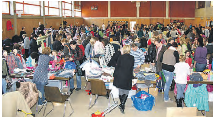
In der Krebsbachhalle in Eigeltingen werden verschiedene Schnäppchen angeboten.

sammenstoß. Das Wildschwein machte kehrt und rannte unversehrt in den Wald zurück. Doch der Anhänger am Fahrzeug der Frau brach aus und überschlug sich. Die 42-Jährige blieb bei diesem Unfall unverletzt, und der Anhänger konnte wenig später durch den verständigten Ehemann mit einem Traktor wieder aufgerichtet werden. Die Polizei schätzt den Sachschaden auf etwa 1.000 Euro.