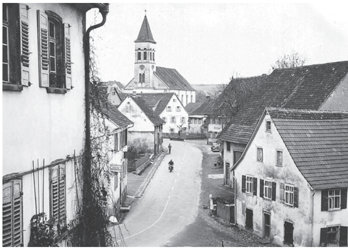
Eigeltingen hat viele auch historische Seiten - das ganze Jahr über wird das 1.250-jährige Ortsjubiläum gefeiert.