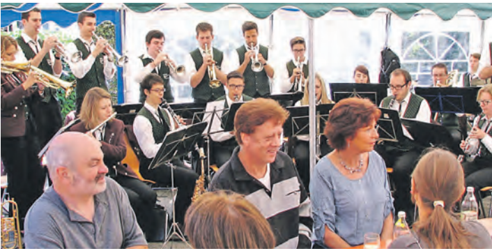
Das Dorffest in Hoppetenzell hatte wieder den Charakter eines Straßenfestes.