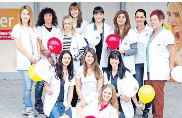
Die Mitarbeiter des neuen dm Marktes in der Werner-von-Siemens-Straße 3 in Rielasingen-Worblingen freuen sich ab der Eröffnung am Donnerstag auf zahlreiche Kunden.