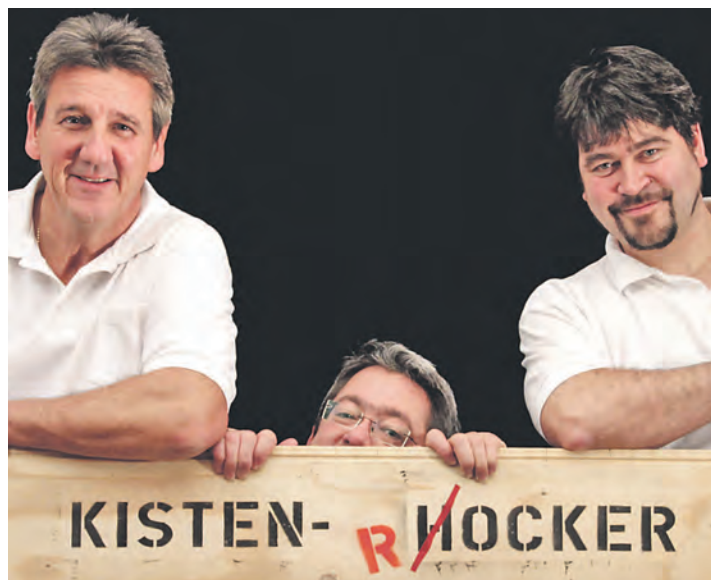
Ob sie nun hocken oder rocken, die »Kisten(h)ocker« möchten seelische »Tiefen und Untiefen« ausloten.

Stockach (swb). Die nächste Kleiderbörse CDU-Stadtverbandes und der Krabbel-Babbel-Gruppe ist für Samstag, 27. September, in der Jahnhalle in Stockach terminiert. Ein großes Angebot an Second-Hand-Artikeln kann hier von 9 bis 11.30 Uhr erworben werden. Teile aus dem Erlös werden an wohltätige Zwecke gespendet. Gut erhaltene Spenden werden zudem an die Arbeiterwohlfahrt weitergegeben. Wer Interesse an der Krabbel-Babbel-Gruppe hat, erhält Infos bei Simone Renz Tel unter 07771/9 16 59 88.