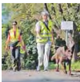
Zwölf Mensch-Hund-Teams waren beim Intensivtraining zugange. Die Teilnahmegebühren wurden der Tierrettung gespendet.

Radolfzell (swb). Einen langen Samstag über waren sie unterwegs: Motivierte Hunde und ihre Besitzer, die nach Personen suchten. Nein – nichts ist passiert. Es war ein Intensivtraining, an dem insgesamt zwölf Mensch-Hund-Teams teilnahmen. Bei der Trilarbeit lernt der Hund den Individualgeruch eines Menschen zu verfolgen und somit die entsprechende Person zu finden, denn jeder Mensch hat ein individuelles Geruchsbild, ähnlich eines Fingerabdrucks. Als »Start« erhält der Hund einen Geruchsgegenstand dieser Person, dann geht die Suche los. Alle Teilnahmegebühren an diesem Tag wurden für einen guten Zweck gespendet. Dabei konnte die stolze Summe von 1.200 Euro an die Tierrettung