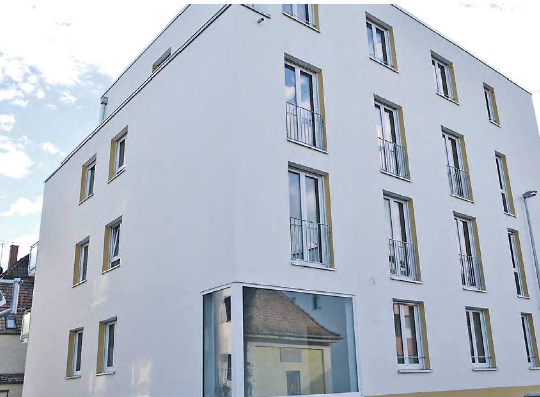
Das Projekt ist eine Gemeinschaftskooperation zwischen der Böhlinger Firma »Sprinkart Immobilien«, die für den Vertrieb zuständig war, dem Architekturbüro »Marzodko-Kaiser« aus Radolfzell und der Firma »Staub und Partner Immobilien GbR« aus Schluchsee und lässt Wohn-Träume in der Radolfzeller City wahr werden.