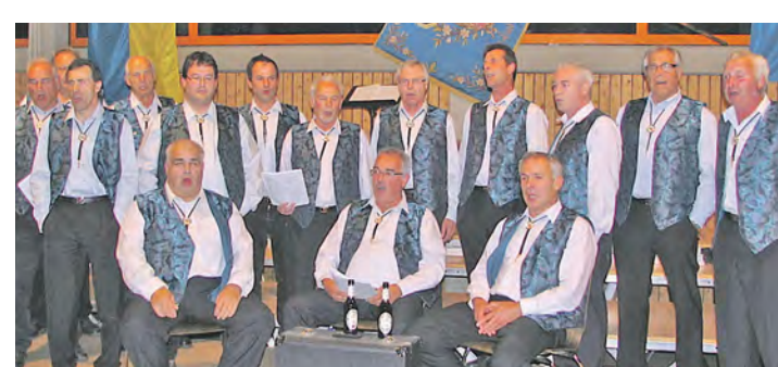
Der Männerchor aus Ramsen-Buch »Marabu« sorgte beim Eigeltinger Herbstkonzert 2013 für tolle Stimmung.