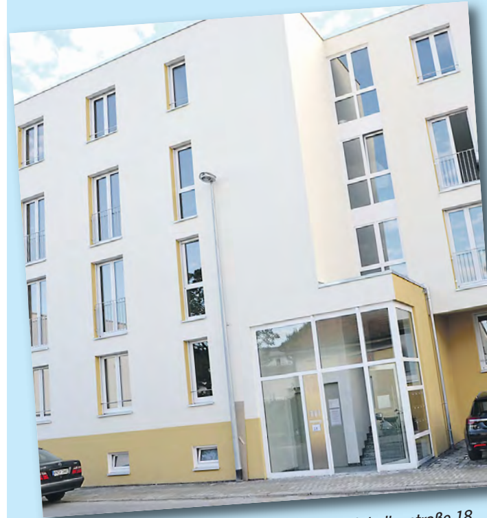
Die 18 Wohneinheiten in der Radolfzeller Markthallenstraße 18 stehen kurz vor dem Abschluss.

Mehr Informationen rund um den Neubau des Wohn- und Geschäftshauses in der Radolfzeller Markthallenstraße 18 sowie zu weiteren Bauvorhaben der Kooperationspartner »Sprinkart Immobilien«, »Marzodko-Kaiser« und »Staub und Partner Immobilien GbR« finden Interessierte jederzeit im Internet auf den Homepages www.marzodko-kaiser.de , www.immo-sprinkart.de oder www.staub-immobilien.de .