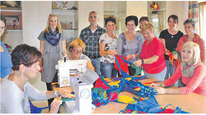
Mitglieder der Markentenderinnen und Alt Stockacherinnen nähen 4.000 Wimpel als Straßendekoration für das Jubiläum »700 Jahre Schlacht am Morgarten«.