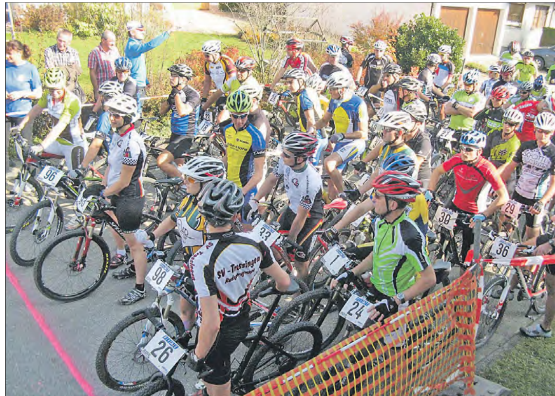
Am Sonntag 19. Oktober findet das 16. Nenzinger Mountainbikerennen statt. Wenig Teerstrecke, quer durch Feld und Flur. Das richtige zum Saisonabschluss. Startberechtigt sind alle Fahrer ohne Lizenz (Hobbyfahrer). Das erste Rennen (U 13 Schülerinnen und Schüler) startet um 11 Uhr, weiter geht es um 12.30 Uhr, bevor um 14 Uhr das Hauptrennen startet. Siegerehrung wird gegen 16.30 Uhr sein. Start ist wie jedes Jahr an der Radlerhalle in Nenzingen (Weinbergweg 23). Verpflegung reicht von Schlachtplatte, Rippe, Kraut bis zu Kaffee und Kuchen. Gestartet wird bei jedem Wetter. Mehr Infos über die Strecke und Anmeldeformular auf www.rmsv-nenzingen.de