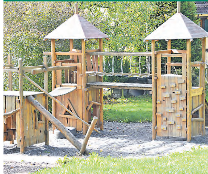
Nicht nur im Inneren wurde in den vergangenen Monaten fleißig gearbeitet, auch die Außenanlage samt Spielplatz wurden neu gestaltet.