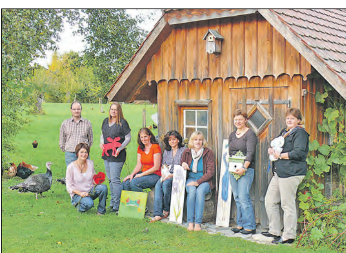
Zur Hobbyausstellung »Kreativ im Dorf« laden Hobbykünstler aus Orsingen-Nenzingen ins Dorfgemeinschaftshaus in Orsingen, Hauptstr. 8, am Samstag, 1. November 2014, von 14 bis 18 Uhr und am Sonntag, 2. November, von 11 bis 17 Uhr ein.