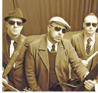
Ein Rock'n'Roll-Konzert der Band Lick75 findet in Wahlwies statt.

Radolfzell (swb). Der Skiclub Radolfzell veranstaltet am Sonntag, 26. Oktober, im TKM Milchwerk den alljährlichen Brettlemarkt. Wie seit vielen Jahren schafft der SC Radolfzell allen Wintersport-Interessierten mit dem Brettlemarkt eine Möglichkeit, günstig an eine Ausrüstung zu kommen, beziehungsweise gebrauchte Artikel weiterzuverkaufen. Die Annahme wird am Sonntag zwischen 9.30 und 11.30 Uhr abgewickelt. Der Verkauf findet zwischen 14 Uhr und 15.30 Uhr statt. Angenommen werden Oberbekleidung, Skier (alpin und nordisch), Snowboards, Ski- und Snowboardschuhe, Schlittschuhe, Skistöcke, Skibrillen und Helme, besonders auch für Kinder Inliner. Ab 15 Uhr beginnen die Anmeldungen für das Kindercamp im Zillertal und das Jugendcamp in Wald am Arlberg.