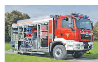
Neues Rüstfahrzeug der Feuerwehr Stockach.

Stockach (swb). 22 Jahre lang und bei über 1.500 Einsätzen war der alte Rüstwagen eine zuverlässige Unterstützung für die Feuerwehr Stockach. Steigende Instandhaltungskosten und die immer komplexer werdenden Aufgaben der Feuerwehr bei der technischen Hilfeleistung machten eine Ersatzbeschaffung unumgänglich. Nachfolger wird ein 341 PS starker und 14 Tonnen schwere Rüstwagen, den die Firma Walser in Österreich nach nur neun Monaten Bauzeit an sieben Feuerwehrmänner übergeben hat. Der Einweisung im Werk