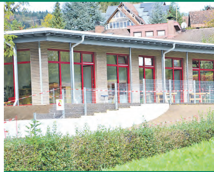
Viel Platz zum Spiel und Toben: Am vergangenen Samstag wurde der Anbau am Kindergarten in Öhningen offiziell eröffnet

Mehr Informationen rund um den Öhninger Kindergarten unter www.oehningen.de .