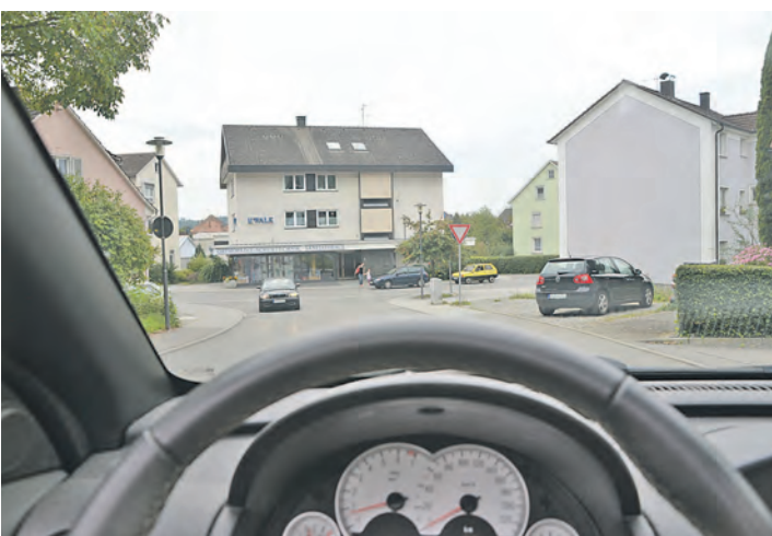
An der Kreuzung von Hägerweg und Aachenstraße in Stockach wird nach dem Willen des Gemeinderats eine Rechtsabbiegerspur zur Entschärfung installiert.