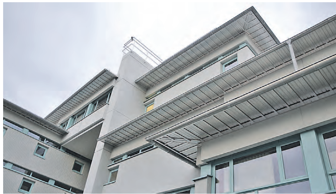
Im Stockacher Rathaus soll es künftig weniger Termine für Wochenendtrauungen geben.