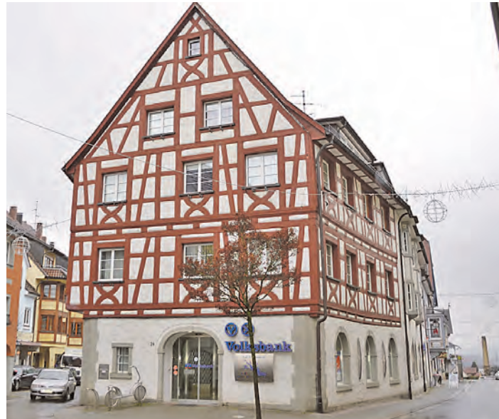
Die Volksbank-Filiale in der Stockacher Oberstadt hat ihren Schalterbetrieb eingestellt und wurde in ein Beraterzentrum umgewandelt. Das hat zu massiver Kritik geführt.