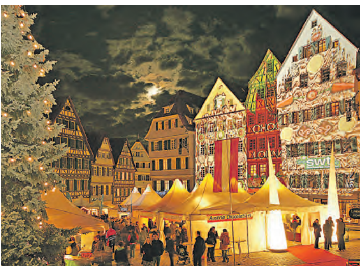
Der Schokoladenmarkt in Tübingen ist ein besonderes Erlebnis.

»Musikalischer Adventszauber«. Und eine Premiere hat auch der Krippenweg mit Egli-Figuren als Ausstellung im Pfarrhaus. Dort wird Gisela Papaccio um 14, 15 und 16 Uhr Kindern spannende Märchen vorlesen, im Bücherflohmarkt können Lesefans fündig werden, und im Kindergarten gibt es Bastelangebote und ein Kinderschminken für kleine Besucher. Vor der Kirche und auf dem Rathausplatz schweben um 14 und 18 Uhr weihnachtliche Weisen des Musikvereins über das Gelände. Beliebt. Begehrt. Bekannt. Der Heudorfer »Christkindlemarkt« kann auch kulinarisch punkten. Leckeres für Gaumen, Geschmacksnerven und Magen gibt es an allen Ecken und Enden, und zusätzlich werden abends Hähnchen am Holzfeuer knusprig gegrillt. Für den »tierischen« Faktor steht eine kleine, flauschige Alpaka-Herde parat. Der »Christkindlemarkt« in Heudorf ist freundlich, fröhlich, festlich.