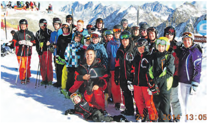
Der Skiclub Eigeltingen eröffnete die neue Wintersaison mit einer Familienfreizeit am Stubaier Gletscher.