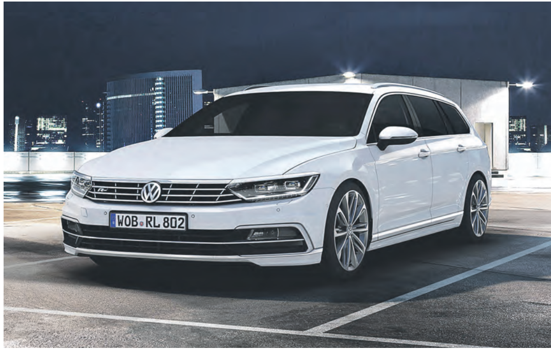
Vielseitig und sparsam im Verbrauch: VW läutet mit dem neuen Passat Variant neue Ära ein.

Einheiten jährlich (2013) die weltweit volumenstärkste Bau-