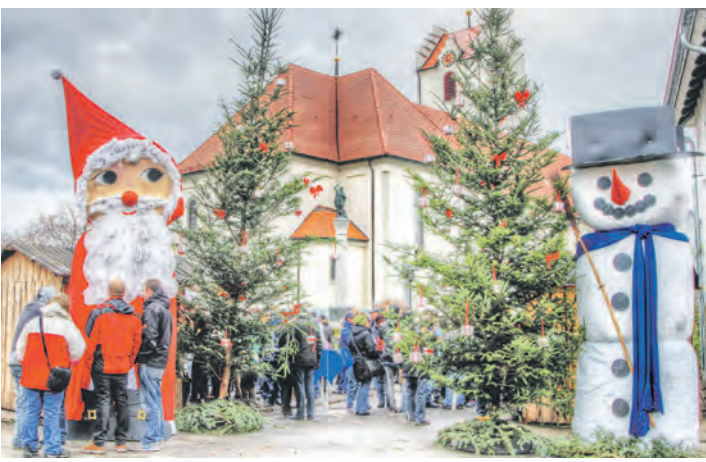
Immer noch einen Tick besser: Der »Christkindlemarkt« in Heudorf am ersten Adventssonntag ist eine Zierde seiner Zunft.