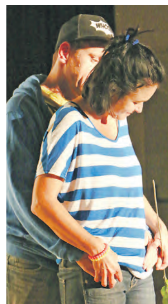
Von den Themen erste Liebe, Sexualität, Verhütung und Teenagerschwangerschaften handelt das Stück »Maria - ein Theater um die Liebe«. Aufgeführt wurde es vom Präventionstheater »Q-rage«.