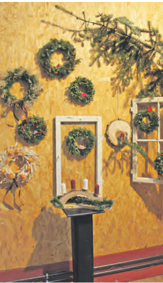
Beim Adventsbasar in Wahlwies wird Stimmung pur geboten.