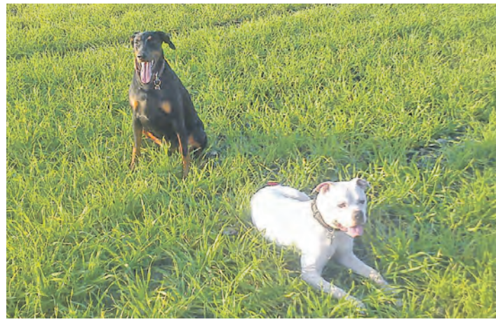
Hundebesitzer müssen für ihre Lieblinge in Orsingen-Nenzingen künftig tiefer in die Tasche greifen: Die Hundesteuer wurde angehoben.

In der gleichen Sitzung wurde eine Erhöhung der Hundesteuer von bisher 66 Euro für den