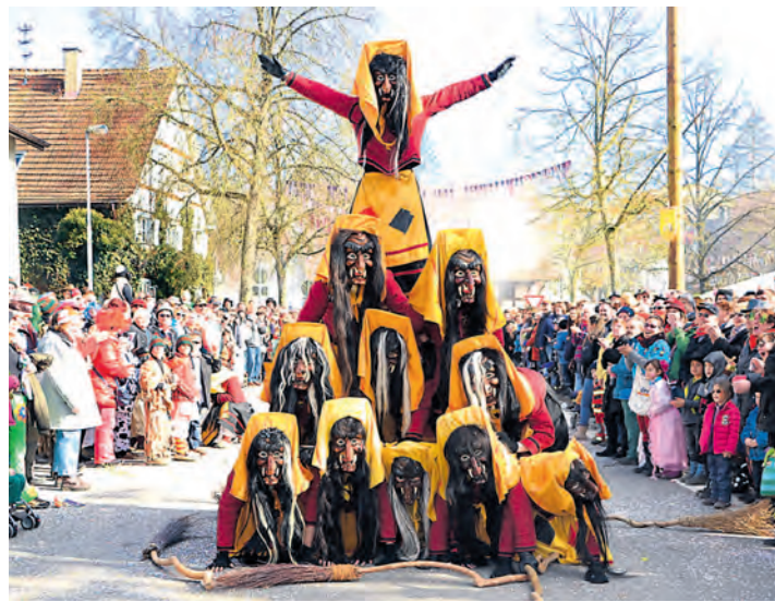
Das elfte Seenarrentreffen lockte am Sonntag tausende Hästräger, Gardemädels und Guggenmusiken nach Möggingen. Mit dabei waren auch die Altstadthexen aus Radolfzell.

Tausende Besucher beim Umzug in Möggingen