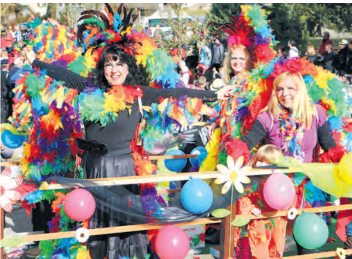
Kaiserwetter herrschte, als sich am Sonntag ziemlich genau um 14 Uhr der Höri-Umzug in Schienen in Bewegung setzte.

Höri-Umzug lockte die närrischen Massen an