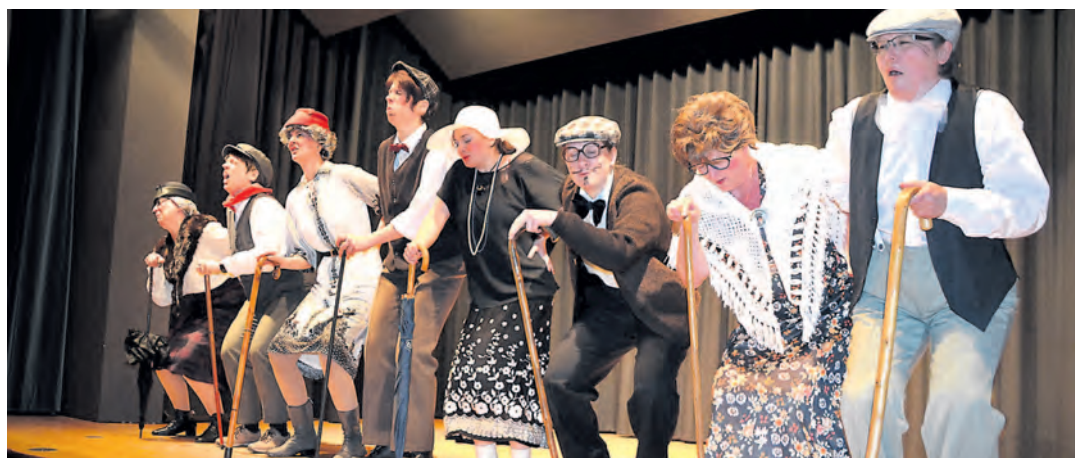
Tanzen ist keine Frage des Alters: »Oma und Opa« in der Disco.

Für Radolfzell läuft die Notrufnummer 112 in der integrierten Leitstelle des Landkreises Konstanz in Radolfzell auf. Die Notrufe werden nach einem strukturierten Frageschema bearbeitet und die nach Einschätzung des Disponenten erforderlichen Rettungskräfte alarmiert.