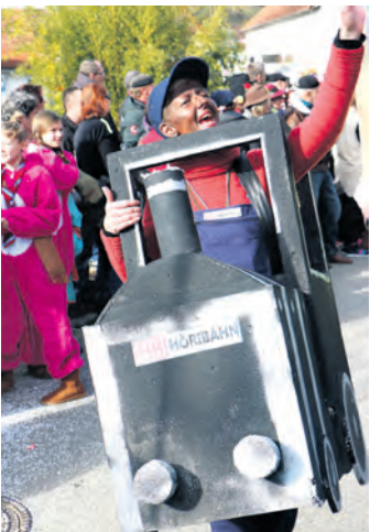
Die Mooser Rettiche kamen als Schaffner daher, gemäß ihrem Motto »Alles auf Schienen«.