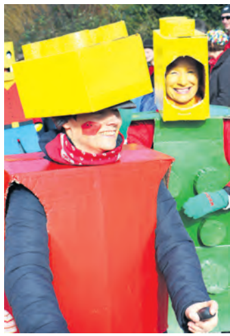
Kreativ und einfallsreich: Die Heufresser Horn bewegten sich als Legosteine durch das Dorf.