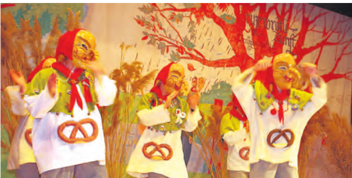
Die Sage vom Chrüzerbrötli wurde beim Überlinger Narrenspiegel sogar getanzt.