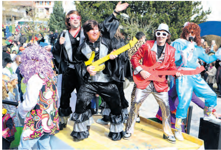
Mehrere tausend gut gelaunte Närrinnen und Narren standen am Straßenrand, um den neun Höri-Zünften zuzujubeln. Die Öhninger Piraten erinnerten an die Weltkarriere von ABBA.