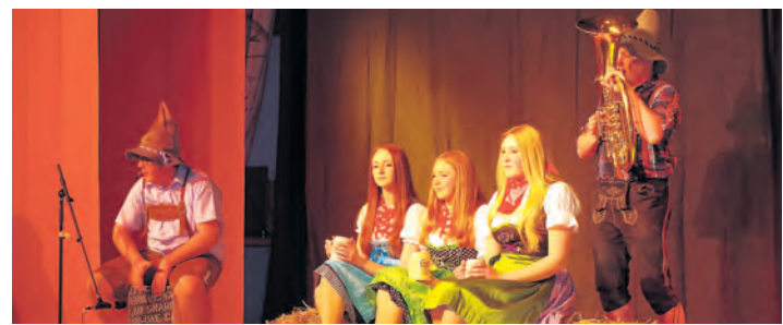
Die Trubehüeter-Zunft drängte am Samstag in Bohlingen auf die Bühne. Im Bild eine Alpen-Rock-Inszenierung mit Schuhplattler und Dirndl.

Mehr Bilder gibt es unter http://www.wochenblatt.net/wbbewegt/bildergalerien/das-jahr-2014/februar.html