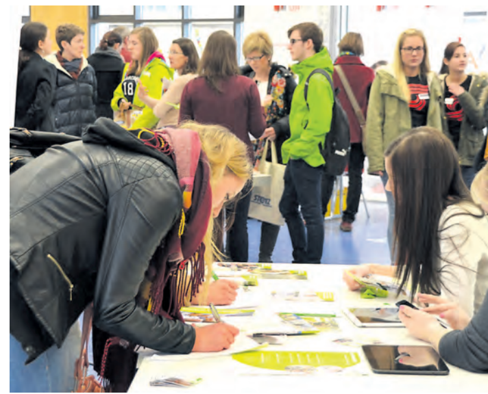
Erstmals wurde auch die Mensa der Grund- und Werkrealschule Stockach zum Veranstaltungsort des »Karrieretages« in Stockach.

Auf diesen Bausteinen, die eine Karriere ermöglichen können, baut der »Karrieretag« auf. Neben dem BSZ-Schulgebäude und der Kreissportturnhalle war der Veranstaltungsradius erstmals auf die Mensa der Grund- und Werkrealschule (GuW) in der Tuttlinger Straße ausgedehnt worden, wo die Hoch-