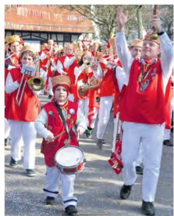
Gute Stimmung, gute Musik - bei Kaiserwetter war das Seenarrentreffen ein voller Erfolg.