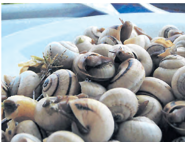
Auch Meeresschnecken werden in manchen Restaurants gereicht.

weder mit der Familie oder auch guten Freunden. Die Restaurants der Region bieten ganz viele Ideen rund ums Thema Schnecke und Fisch.