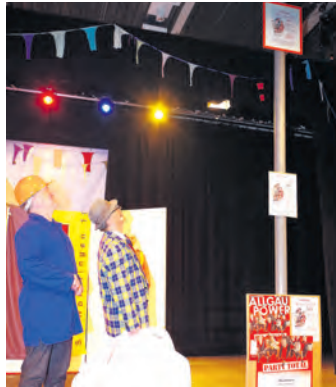
Auch der Zunftmeister und der Bürgermeister mussten die Hälse mächtig zu den neuen Plakathaltern in der Gemeinde recken.

Worblingen (of). Der Lob des Publikums war einhellig. In der frisch renovierten und energetisch sanierten Hardberghalle macht der Narrenspiegel der Schafflinger noch einmal so viele Spaß. Ein freies Plätzchen konnte man denn auch am