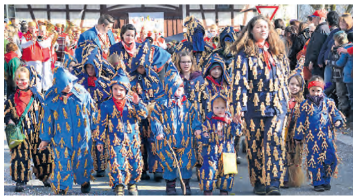
Nicht nur die großen Narren zeigten sich im Häs, auch die Kleinsten putzten sich für den Umzug heraus. Mehr Bilder gibt es im Internet unter www.wochenblatt.net/ubbewegt/bildergalerien/das-jahr-2014/februar.html .