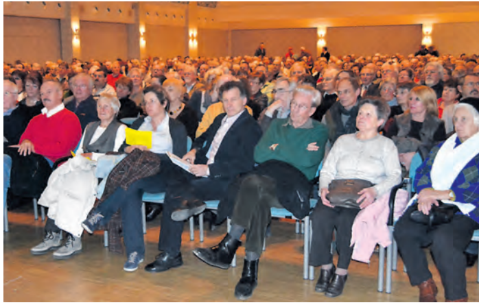
Rund 700 interessierte Bürger fanden sich beim Stadtgespräch zur Seetorquerung im Milchwerk zusammen. Die Ergebnisse der rund 300 eingegangenen Vorschläge liegen nun vor.

Auswertungen des Stadtgesprächs zur Seetorquerung liegen vor